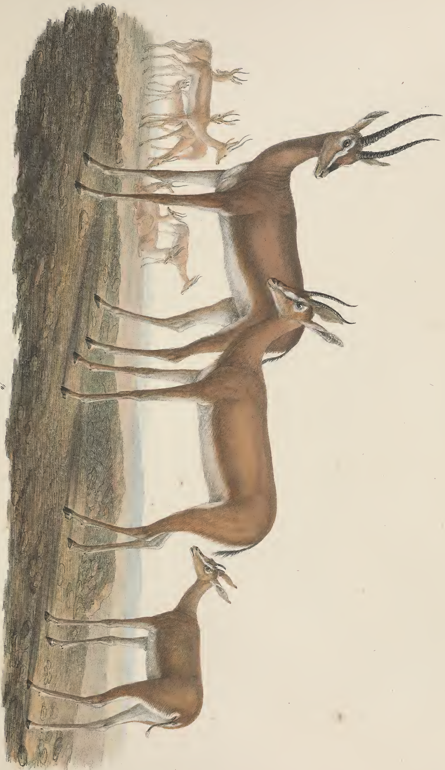
ANTILLOPE arabica .