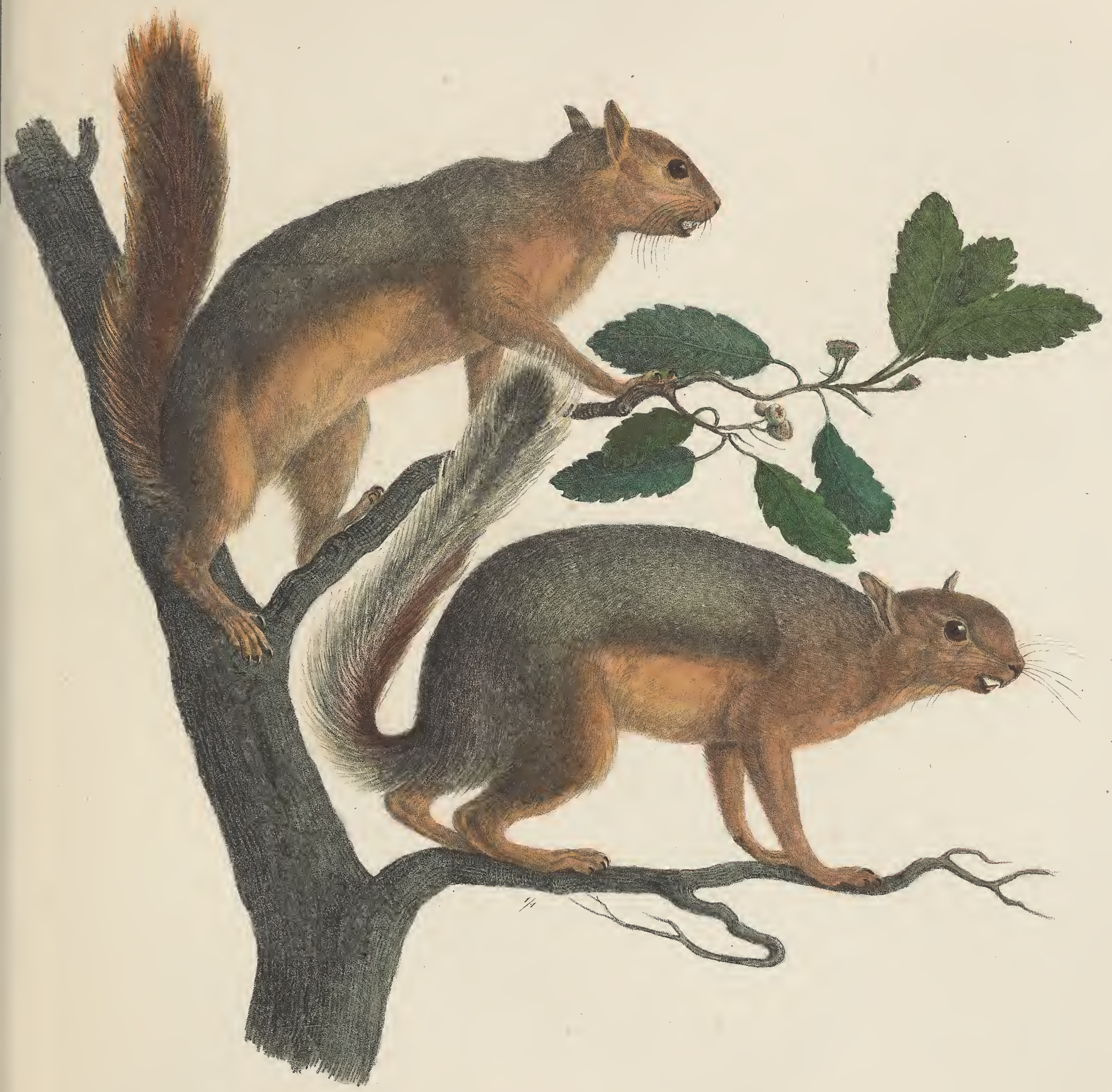
SCIURUS * syriacus . Libanon.