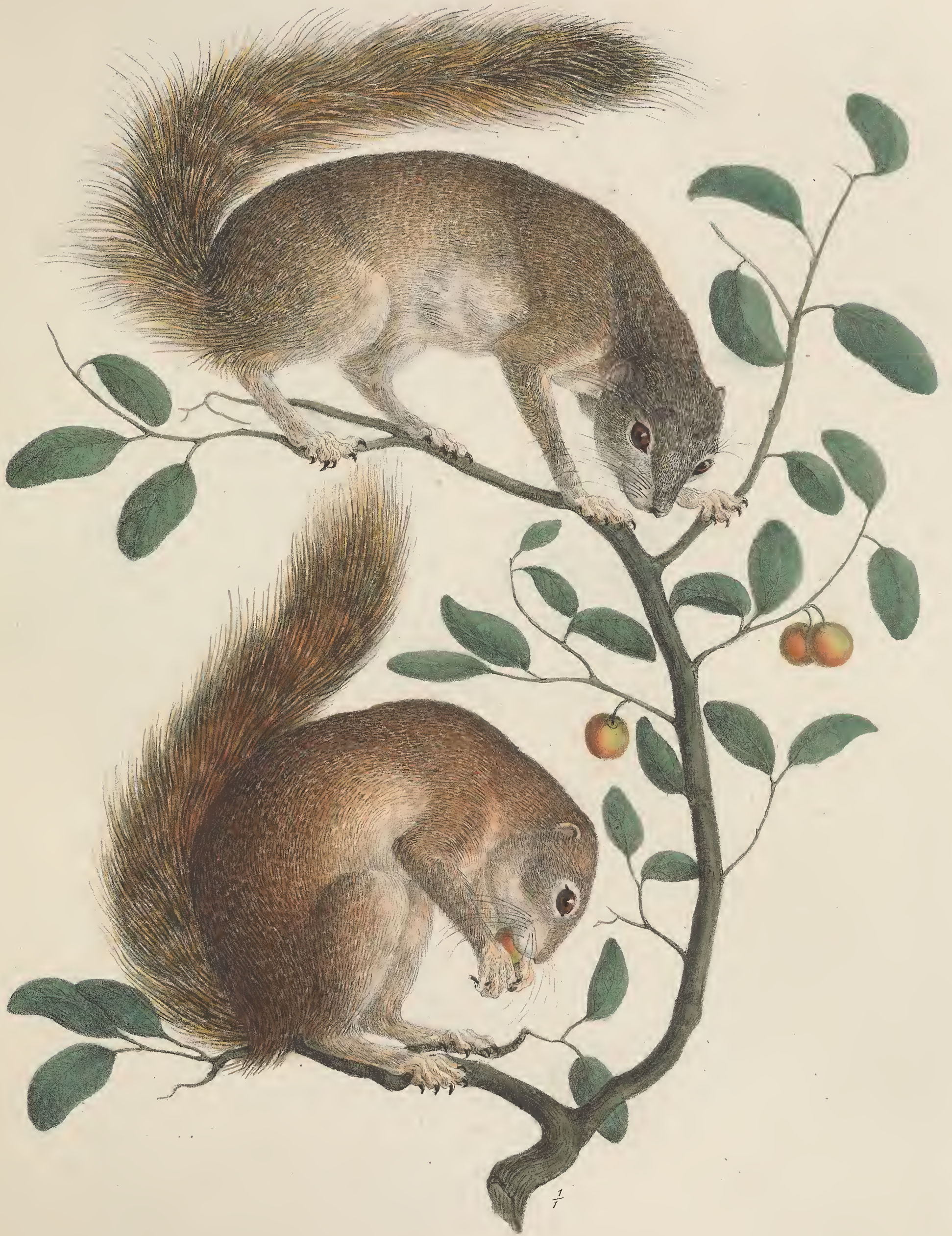
SCIURUS * brachyotus Habessinica.