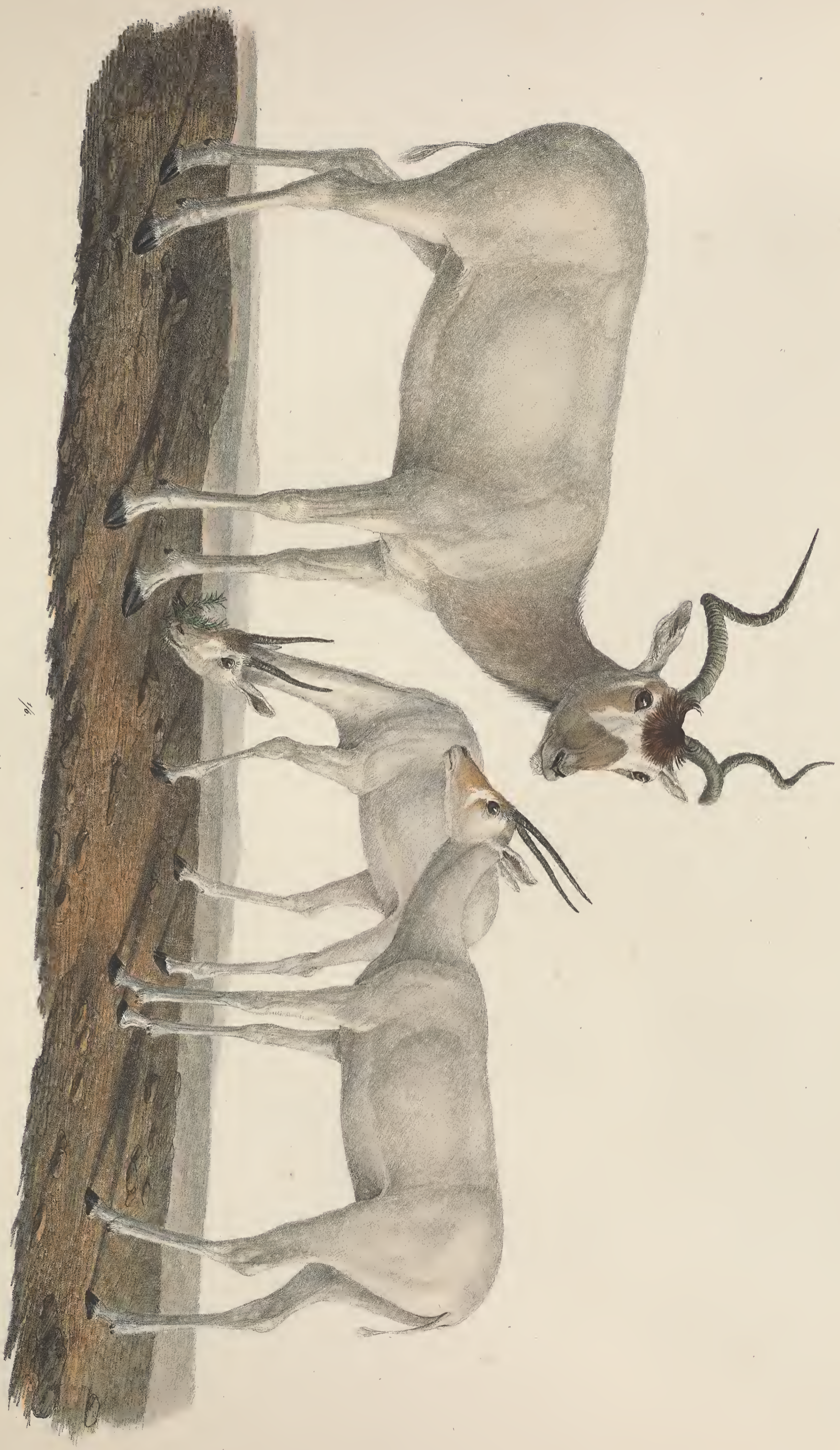
ANTILOPPE Adhae feminae. Dougatae.