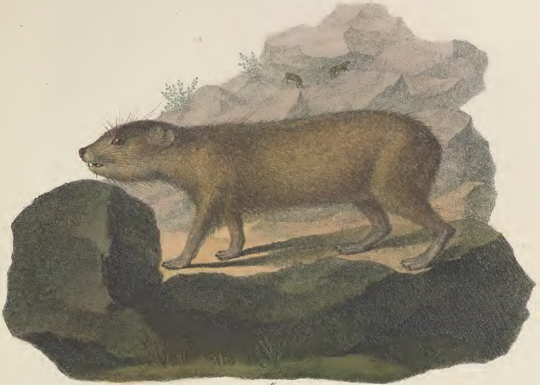
1/2. HYRAX * ruficeps. Dongala.