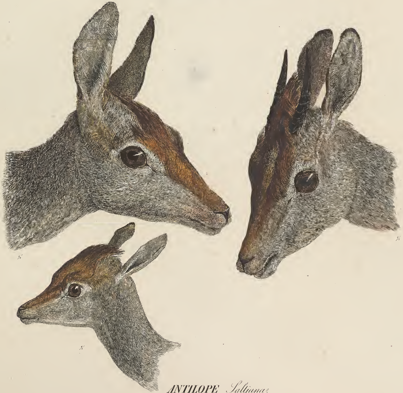
ANTILOPE Saltiana. Habessinia.