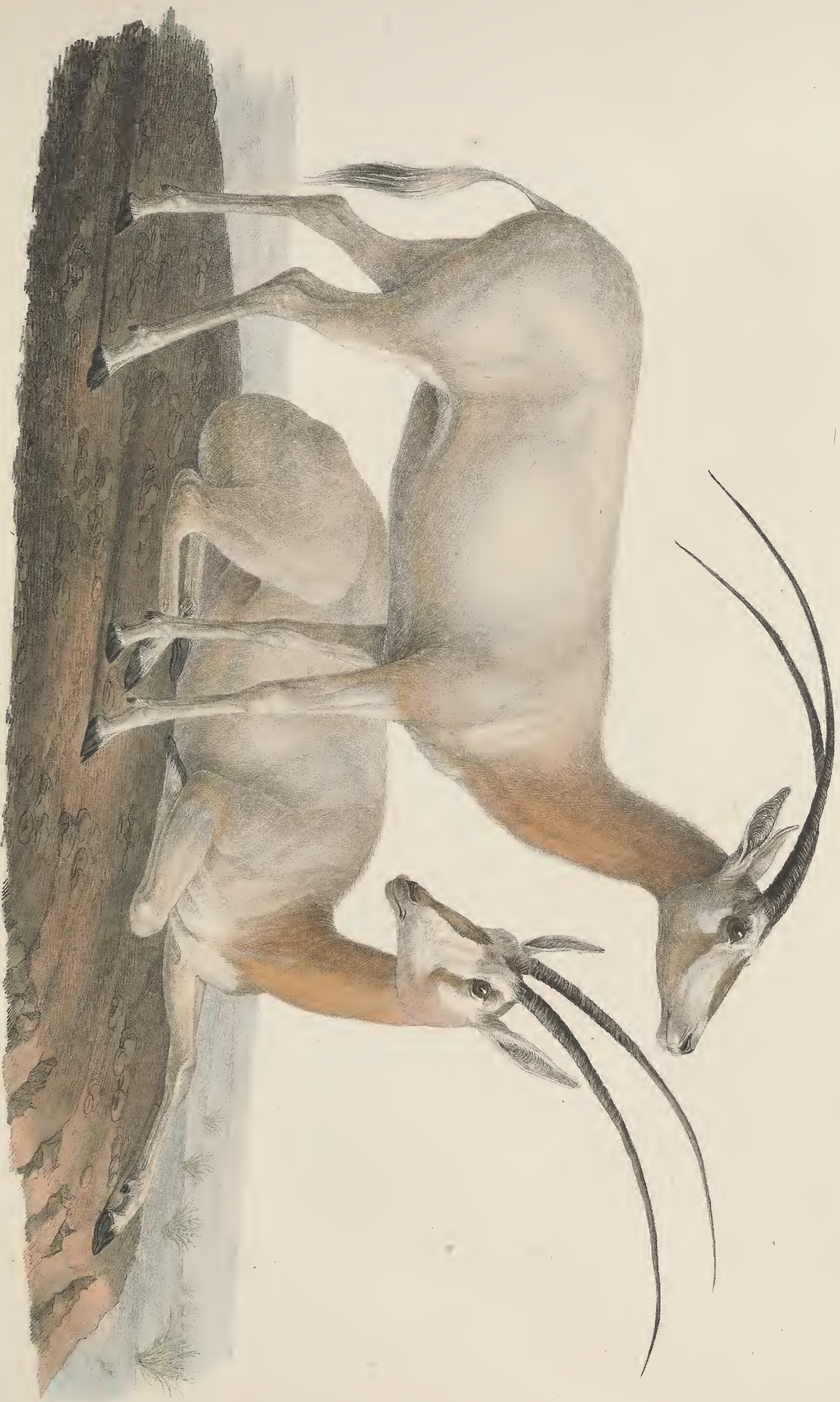
ANTILOPE 76. leucocorys femina. Dorcas.