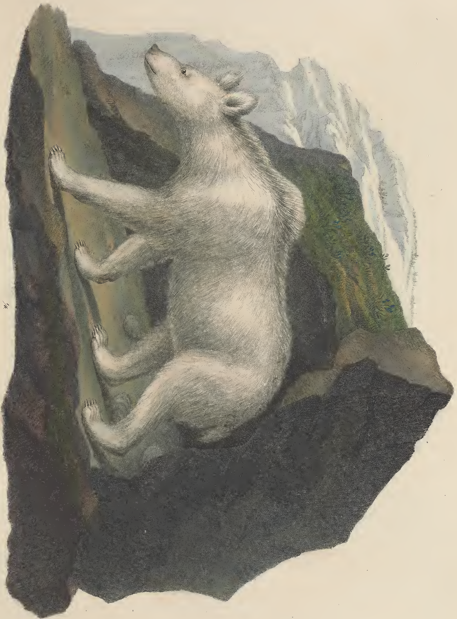
URSUS sibiricus. Linnæus.