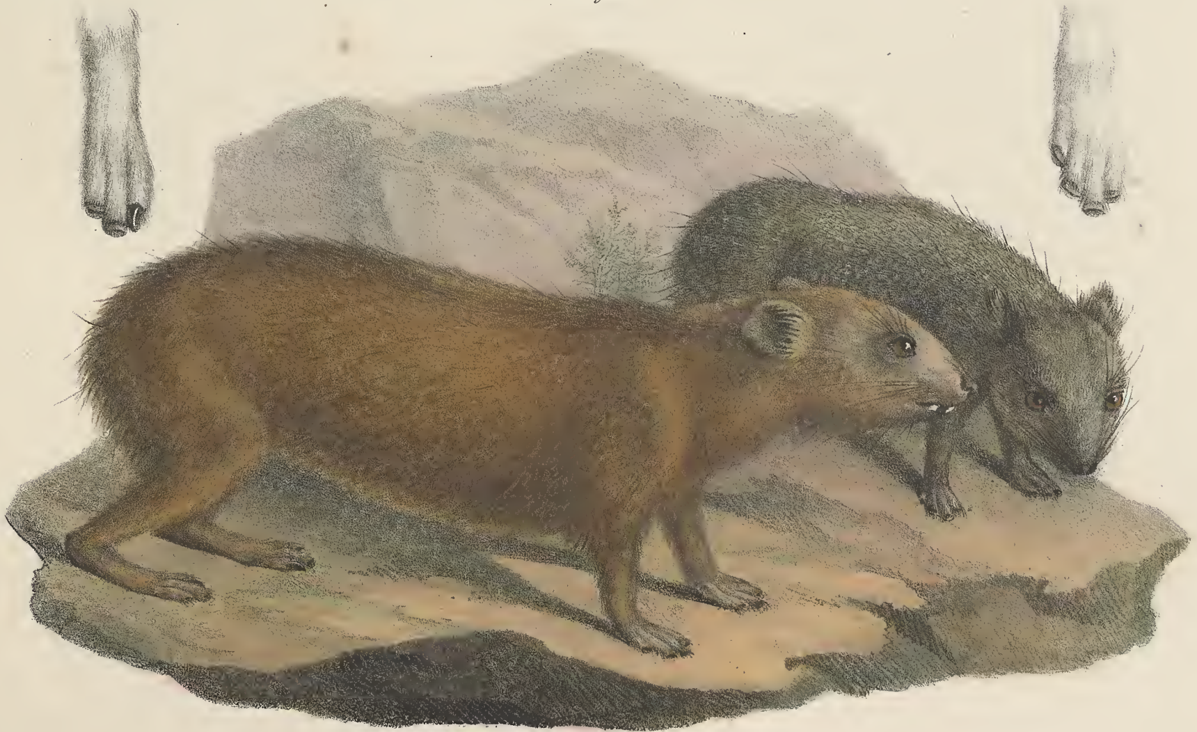
1/2. HYRAX syriacus. Sinai.