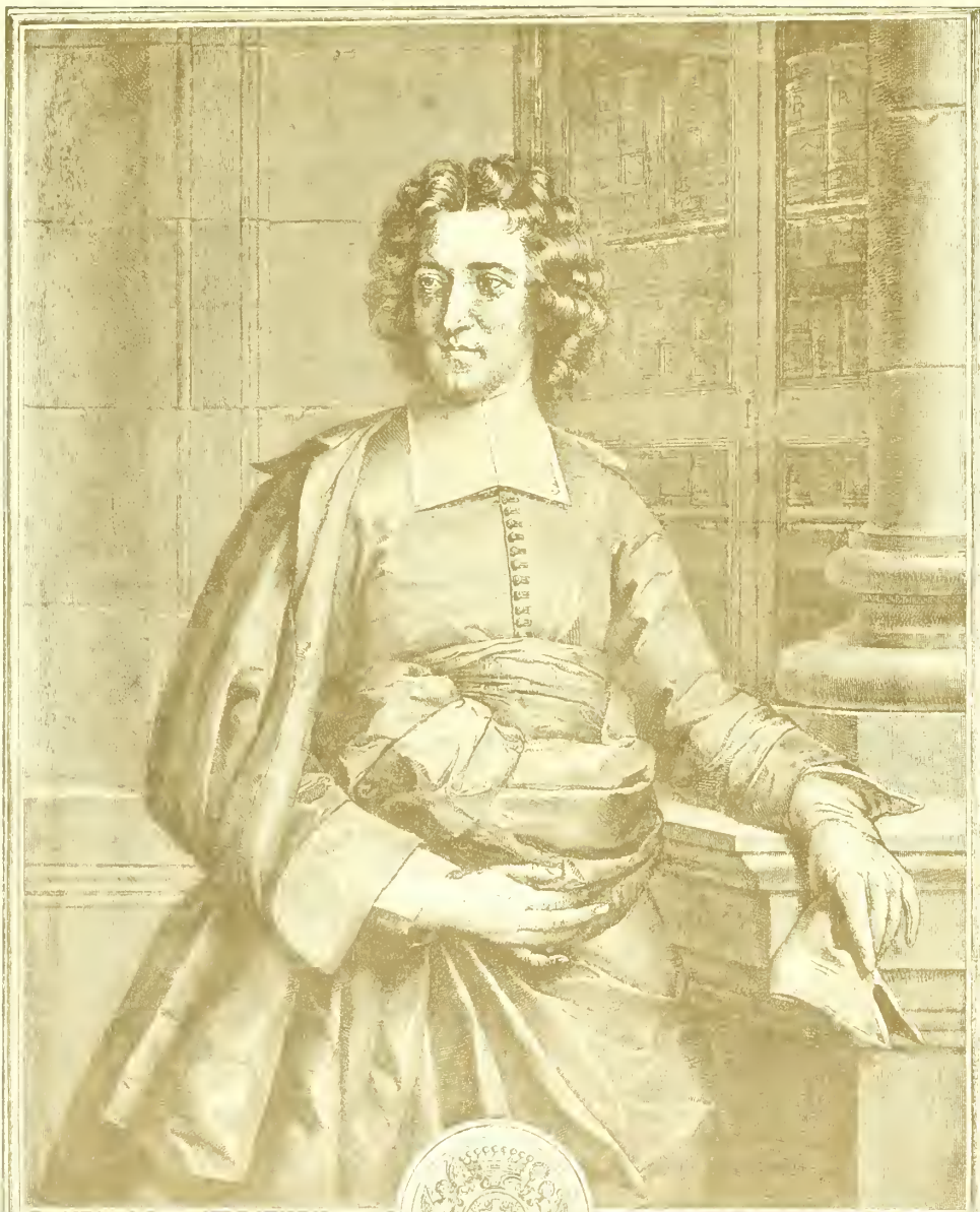
Joannes Paulus 1703