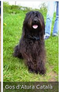
Gos d'Atura Català