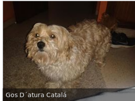
Gos D'atura Catalá