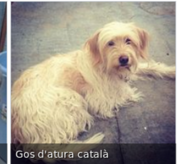
Gos d'atura català

Quan s'insereix un fitxer multimèdia, des d'una finestra emergent podem cercar al repositori Wikimedia Commons totes les imatges, vídeos o àudios que continguin un determinat text.