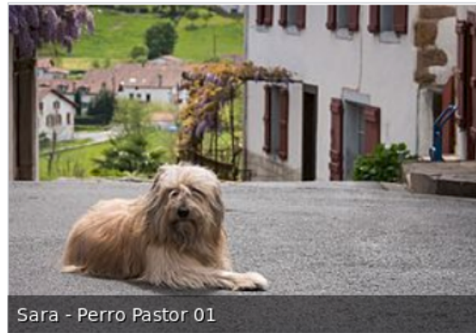
Sara - Perro Pastor 01