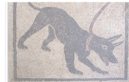
Mosaic romà mostrant un gos amb collar

anàlisis determinar de manera Els gossos