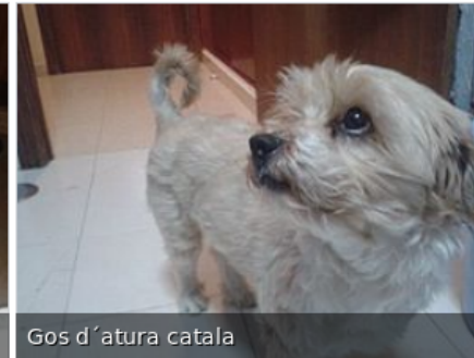
Gos d'atura catala