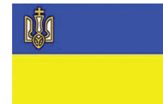
Прапор флоту УНР від 14.01.1918 р.

24 СІЧНЯ 1918 Р. – Українська Центральна Рада прийняла «Тимчасовий Закон про український державний флот». Відповідно до нього Чорноморський флот проголошувався флотом Української Народної Республіки, яка, своєю чергою, взяла на себе «всі зобов'язання російського уряду щодо Чорноморського флоту й щодо утримання флоту й портів».