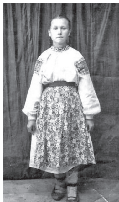
Переселенка до Криму з Західної України (с. Степове Первомайського району, початок ХХ ст.)

Досить промовисто, що ніхто з колгоспників, присутніх на цих руйнівних для себе зборах, не поцікавився ні долею села, ні долею земель, які вони мали покинути. Мабуть, така цікавість була для всіх вельми небезпечною. Адже на зборах були присутні і не заявлені у протоколі представники енкаведистських структур. Збори ухвалили: «Схвалити постанову Ради Міністрів СРСР про переселення в Кримську область і повністю в складі колгоспу переселитися в колгосп ім. Кірова Зуйського району Кримської області. Просити виконком Чуднівської райради депутатів трудящих затвердити наше рішення і підняти клопотан-