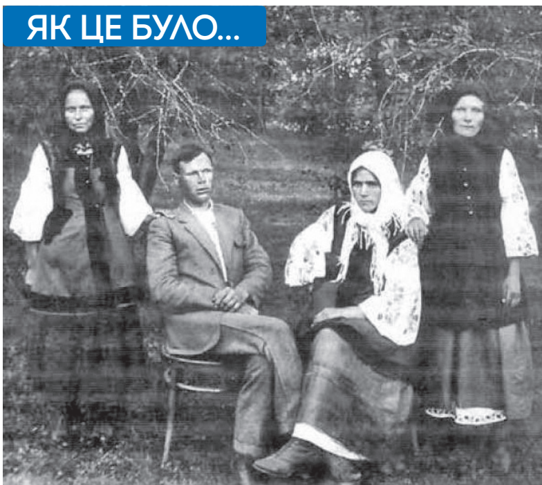
Переселенці до Криму з Полтавщини. с. Зуя, 1928 р.

литися в Кримську область» (цитуються мовою оригіналу).