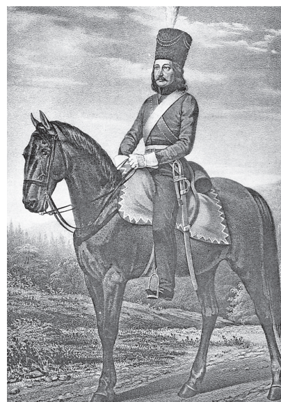
Шеренговий Литовсько-Татарського Кінного полку в 1797-1801 рр.

У цього народу тривалий час зберігався власний суспільний поділ: існувала власна аристократія, прирівняна у правах до польської шляхти; її представники носили титули: бек, оглан, султан, ага, сеїд. Султанами звалися представники двох найшанованіших родів: Остринських