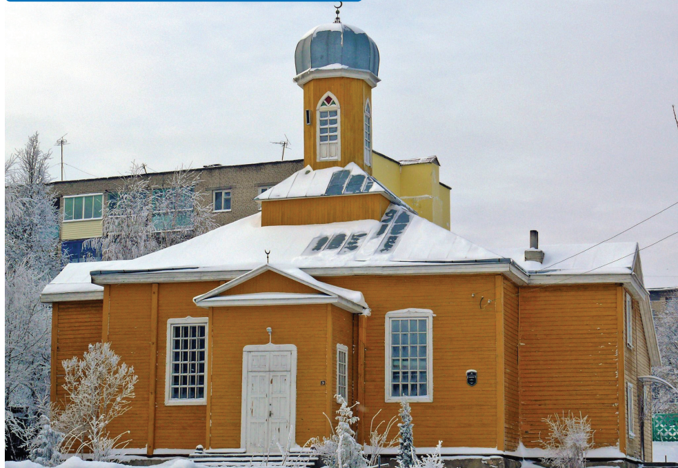
Мечеть у м. Новогрудок (Білорусь)