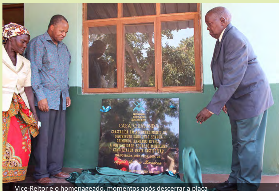
Vice-Reitor e o homenageado, momentos após descerrar a placa

Em 1967, foi integrado na equipa de trabalho para a construção do edifício onde encontra-se actualmente a funcionar a Faculdade de Agronomia e Engenharia Florestal, seguido da construção do Pavilhão Gimnodesportivo, em 1968.