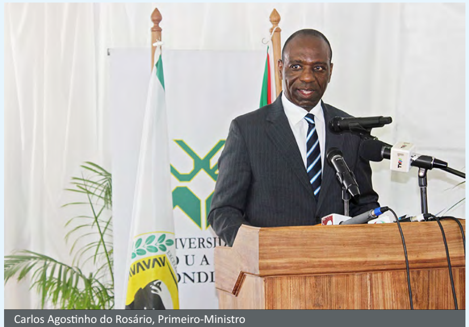
Carlos Agostinho do Rosário, Primeiro-Ministro

Fez saber que, o Governo, reconhecendo o papel da mulher na sociedade, integra nas políticas e estratégias de desenvolvimento do país, a componente do género, através de acções que incluem a aposta na educação e formação da rapariga, a promoção da inserção da mulher no mercado de