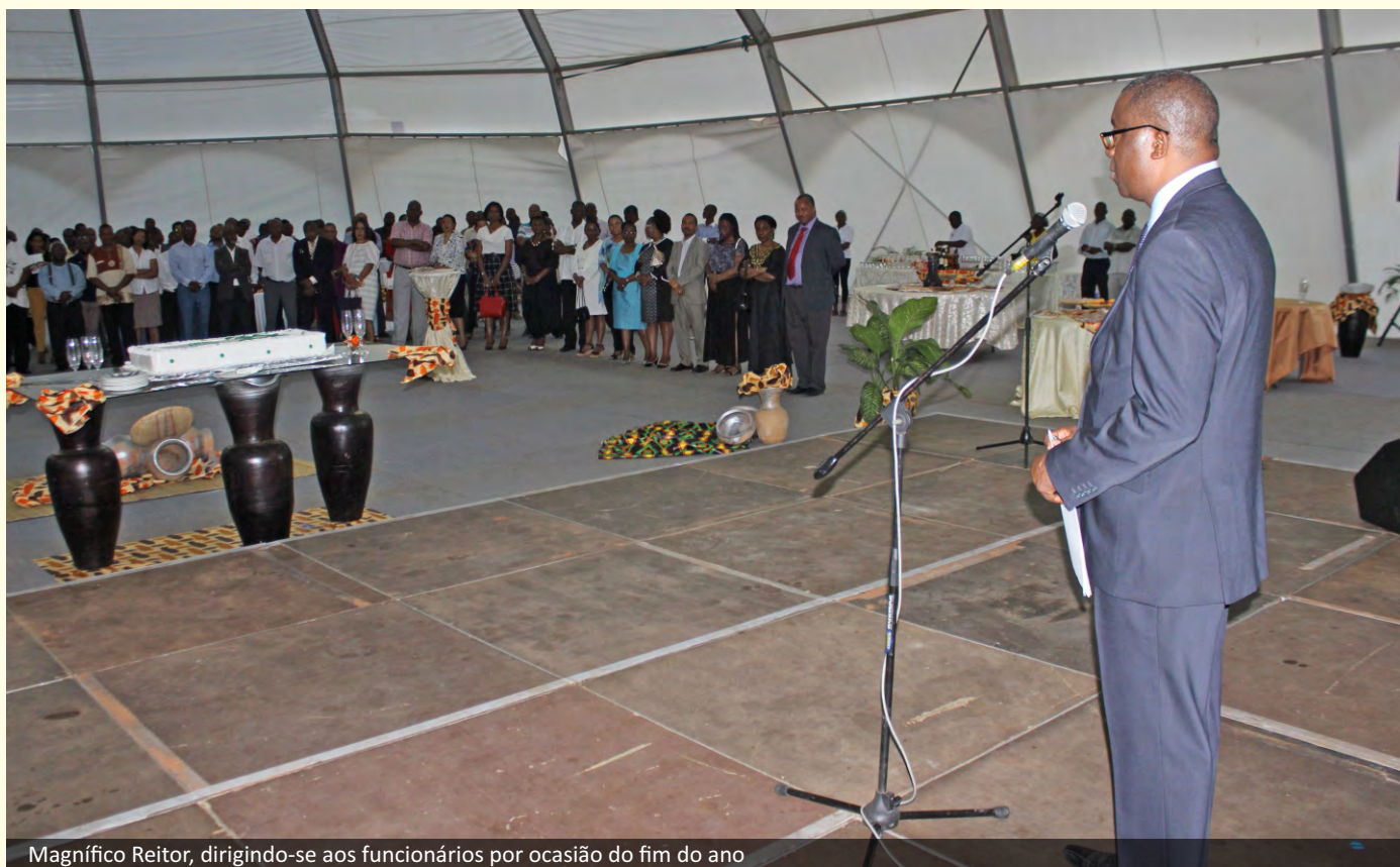
Magnífico Reitor, dirigindo-se aos funcionários por ocasião do fim do ano

Momentos culturais marcaram igualmente a confraternização envolvendo a direcção da Universidade e os funcionários, entre docentes e o corpo técnico administrativo (CTA).