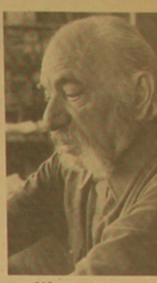
Семьдесят тысяч своих сыновей.