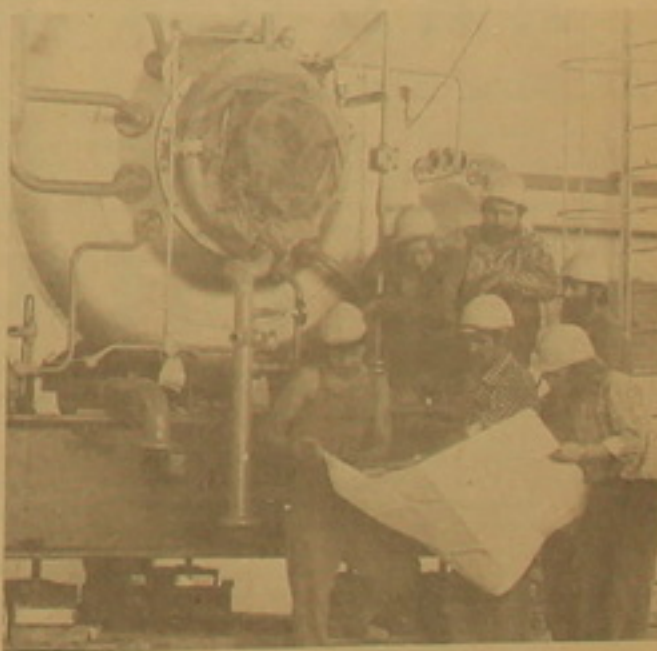
Украинская ССР. Ударными темпами возводятся компрессорную станцию [Ивано-Франковская область] строители из ГДР. Это одна из десяти станций украинского участка магистрального газопровода Урлагой — Помары — Ужгород...

ЦЕНТР УПРАВЛЕНИЯ ПОЛОТЕМ. 23. (ТАСС). Орбитальная научная станция «Салют-7», на борту которой работает Владимир Ляхов и Александр Александров, к 12 часам московского времени совершила 8 тысяч 250 оборотов вокруг Земли.