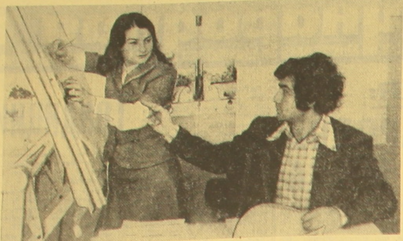
В конструкторском бюро Ереванского опытного светотехнического завода ведется разработка светильников новых типов...