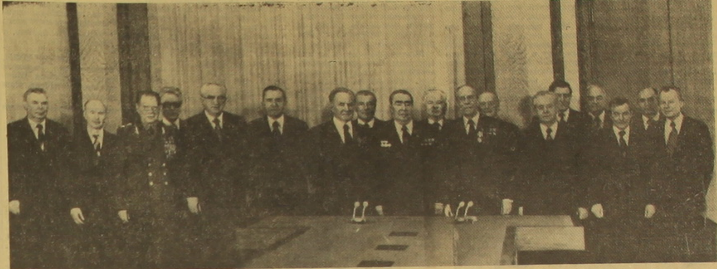
На снимке: руководители Коммунистической партии и Советского государства при вручении наград товарищам А. Я. Пельше и А. Н. Косыгину.

Генеральный секретарь ЦК КПСС, Председатель Президиума Верховного Совета СССР Л. И. Брежнев вручил 19 марта в Кремле высокие награды Родины члену Политбюро ЦК КПСС, председателю Комитета партийного контроля при ЦК КПСС А. Я. Пельше и члену Политбюро ЦК КПСС, Председателю Совета Министров СССР А. Н. Косыгину. В зале присутствовали товарищи Ю. В. Андропов, А. А. Громыко, А. П. Кириленко, Д. Ф. Устинов, К. У. Черненко, П. Н. Демичев, Б. Н. Пономарев, М. С. Соколов, Н. А. Тихонов, И. В. Калинин, В. И. Долгих, М. В. Зимин, К. В. Русаков, М. С. Горбачев, а также секретарь Президиума Верховного Совета СССР М. П. Георгадзе.