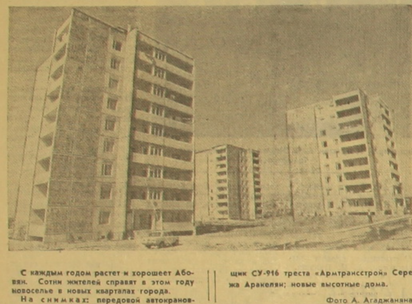
С каждым годом растет и хорошеет Аб-Вей. Сотни жителей справят в этом году новоселье в новых кварталах города. На снимках: передовой автокранов-