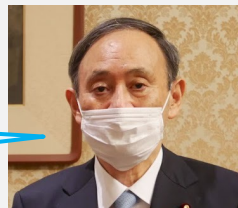
菅総理の施政方針演説の内容を政策分野別に色分け