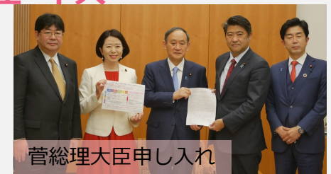
菅総理大臣申し入れ

提言はアンケートでいただいた4万7000件の意見、当事者、講師、議員の意見を反映させる形で、自見議員とともに執筆。 4万7000件のアンケートはすべて議員事務所内で企画・取りまとめを行なった。生データで皆様からの声1件ずつに目を通しました！