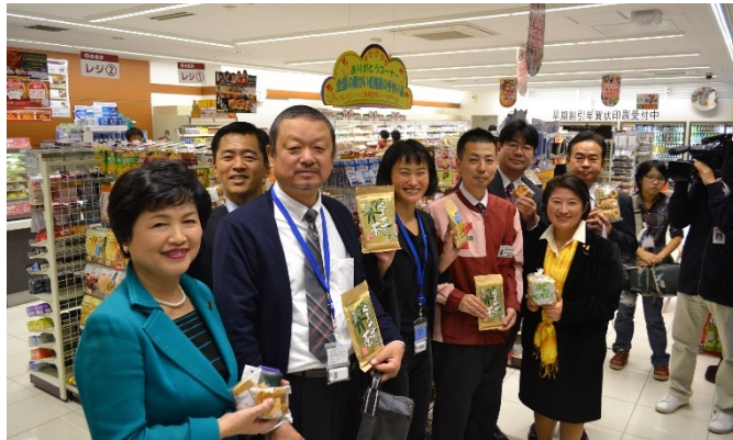
全国の障がい者施設で生産された商品(菓子・雑貨等)販売コーナーを議員会館内セブンイレブンに常設

塩崎厚生労働大臣への申入れ 障がい者の所得拡大推進のに向けた施策や政策に関する要望を提出