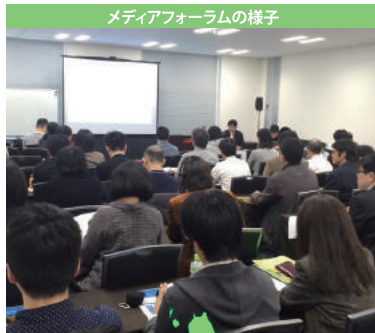
メディアフォーラムの様子