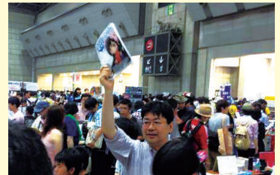
AFEE(エンターテインメント表現の自由の会)のブースにて