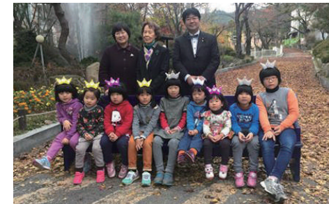
寄付金で運営される海外の児童養護施設視察(韓国の安養市)

知的障がい者の中でも、特化した才能があるのに発揮する場、自覚する場を持っていない人がいます。知的障がい者が特別支援学校を出て就職する前に、就業支援とは別に通える「知的障がい者のカレッジ(福祉型教育支援の大学)」を創設し、自分の得意分野を見つけ、自信を持つ教育を受けてから就職する流れを作るべきです。その第一歩として、国公立大学で知的障がい者向けのクラスを作り、一定量の知的障がい者を受け入れ、健常者とも共に学ぶ機会をつくることから始めるべきです。