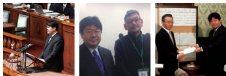
立法者として本会議場での「審判」非常に珍しいシーンです 『新世紀エヴァンゲリオン』の監督庵野秀明さんと 議員の本職である法律の作成と提案に多く携わりました