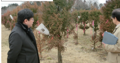
森林総合研究所林木育種センターで無花粉スギの研究を視察