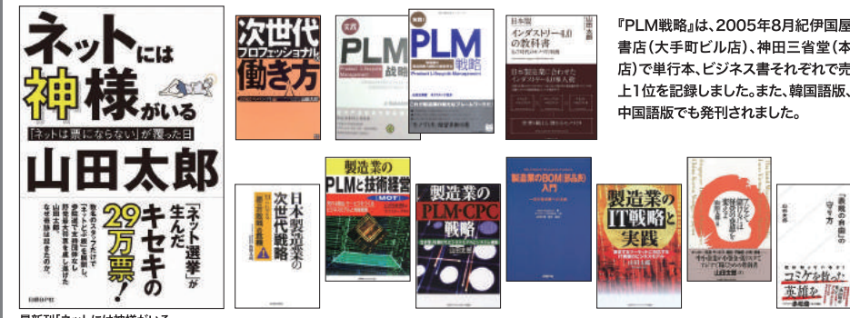
最新刊「ネットには神様がいる」

『PLM戦略』は、2005年8月紀伊国屋書店(大手町ビル店)、神田三省堂(本店)で単行本、ビジネス書それぞれで売上1位を記録しました。また、韓国語版、中国語版でも発刊されました。