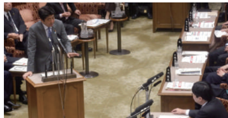
質問していないのに、総理に「表現の自由」に言及されたことも

マンガ・アニメ・ゲームは、一度、制作が終わると、その原画やソフトウェアの全てを完全に保存するということが非常に難しいのが現状です。「MANGAナショナルセンター」を国立国会図書館の支部機関として創設し、日本のメディアアートや商業芸術などをアーカイブ(収集、保存)し修復、展示、調査研究、情報提供、人材育成と交流等に役立たせていきます。日本のコンテンツ産業を、世界を相手に戦っていける成長産業につなげる、その拠点としての役割を担うことになるでしょう。