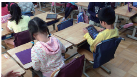
一人ひとりにタブレット(東京都ITCパイロット小学校)

ネット社会を考える場合、大切なことは、ネットの本質は自由ということ。同時に、自由には責任が伴います。この自由と責任のバランスをとることが現代ではとても大切です。そして自由に活動することを制約する法律の修正と自由の結果としてネット社会で弱者となる人を保護するための法律や施策が必要です。