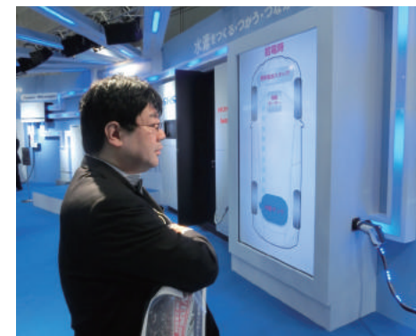
スマートエネルギー展にて水素自動車

政府は、グローバルマーズへの海外進出支援をしっかりと行うべきです。更に日本経済の根底を支える中小企業対策として、IoTインフラを拡充し、輸出の際に特に生ずる大企業と中小企業との格差をなくすこと、クールジャパンの促進など有効な手段となります。