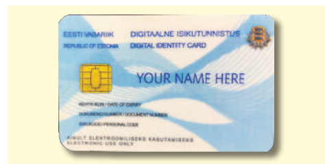
エストニアではこのカードで10秒でネット投票可能

時代に合わせて、行政と政治の在り方も変化すると考えられます。eガバメントで行政を効率化、民間へのサービスレベル上げたり、若者の選挙参加や投票率の向上を目指してネット投票などを導入したりする必要もあるでしょう。その他、立法や行政にはクラウド時代の法整備、ネット技術利用のノーアクションレター(法律適用の事前確認)、ネット犯罪に対する捜査機関の専門性向上も必要です。