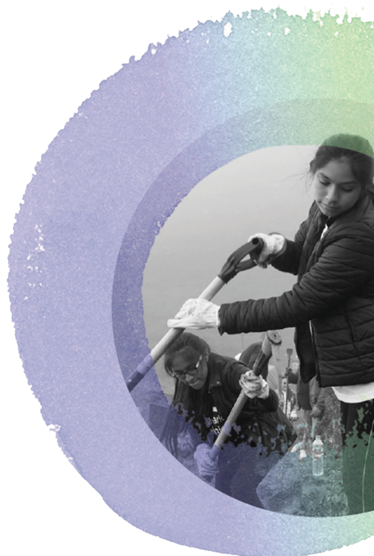
Voluntária trabalhando em projeto de conservação da natureza no Peru, 2021.

A primeira parte do relatório consiste em três capítulos de enquadramento que apresentam as principais ideias que sustentam o relatório. A introdução discute como investigar o potencial de contribuição que o voluntariado pode fazer para construir sociedades igualitárias e inclusivas. Segue-se dois capítulos quantitativos: um sobre estimativas de voluntário/as globais e outro sobre uma pesquisa de percepção de voluntários sobre voluntariado no Sul Global durante a pandemia da COVID-19. Estes capítulos lançam luz sobre dados, tendências e padrões de voluntários.