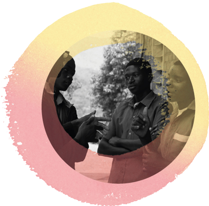
Voluntária discute violência de gênero com estudantes

A segunda parte do relatório concentra-se nos três modelos de parcerias entre pessoas voluntárias e Estado: governança deliberativa, coprodução de serviços sociais e inovação social. A partir de estudos de casos realizados na África, Ásia e o Pacífico, Europa e a Comunidade de Estados Independentes (CEI), Estados Árabes e América Latina e o Caribe, os três capítulos investigam os componentes do modelo de cooperação entre pessoas voluntárias e Estado e discute seus fatores indutores, desafios e barreiras.