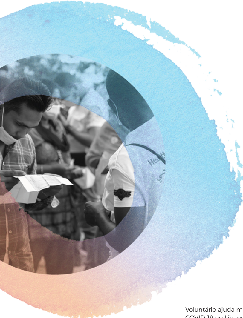
Voluntário ajuda migrantes a terem acesso às vacinas da COVID-19 no Líbano, 2021.

A colaboração sustenta as parcerias entre pessoas voluntárias e Estado na coprodução. Em todos os estudos de caso, ambas as partes alavancam as parcerias para resultados mutuamente benéficos na coprodução de serviços. Ao defender os serviços para migrantes e pessoas com deficiência e ajudando membros da comunidade a navegar em processos altamente burocráticos em governos, muitas vezes de difícil acesso, os esforços das pessoas voluntárias contribuem na entrega efetiva de serviços a grupos marginalizados capacitando governos a integrar melhor grupos em desvantagem na sociedade por meio do fornecimento de serviços. Embora desempenham papéis-chave nos diferentes estágios nos processos coprodução, desde o co-desenvolvimento de ideias à sua implementação, o envolvimento de pessoas voluntárias com as autoridades estatais — que muitas vezes se deve à sua insatisfação com a forma como as autoridades locais lidam com os desafios do desenvolvimento — pode ser visto como um déficit de confiança entre Estado, usuários de serviços e pessoas voluntárias.