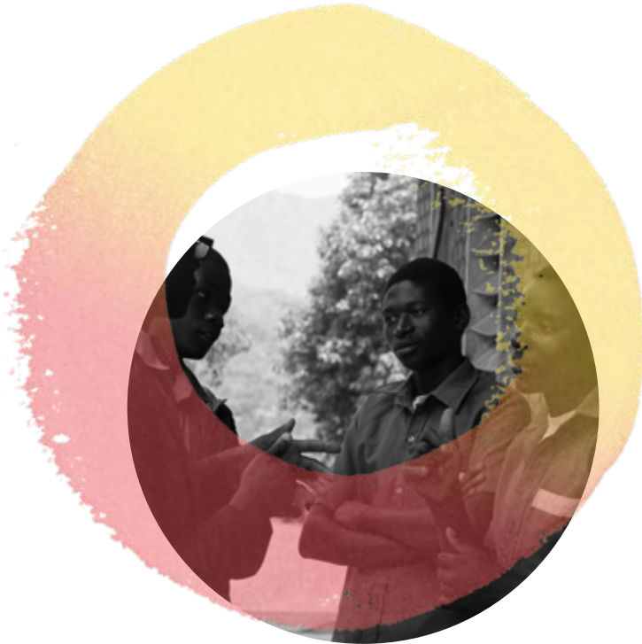
2021年，在马拉维，一名志愿者与学生讨论性别暴力问题。

本报告的 第二部分 重点介绍了志愿者-国家伙伴关系的三种模式：协商式治理、共同生产服务和社会创新。第3章基于来自非洲、亚洲和太平洋、欧洲和独立国家联合体（独联体）、阿拉伯国家以及拉丁美洲和加勒比地区的研究案例，研究了志愿者-国家模式的组成部分，并讨论了其驱动因素、挑战和障碍。