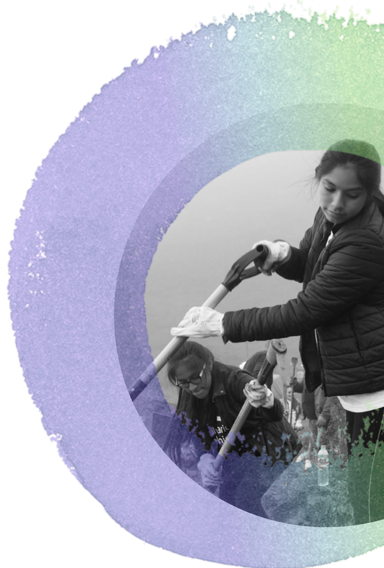
Una voluntaria trabaja en un proyecto de conservación de la naturaleza en el Perú (2021).

La primera parte del informe consta de tres capítulos que exponen las ideas centrales del documento. La introducción aborda los métodos para investigar cómo el voluntariado podría contribuir a la creación de sociedades igualitarias e inclusivas. A continuación, tenemos dos capítulos cuantitativos: uno sobre las estimaciones relativas al voluntariado a escala mundial y otro que presenta una encuesta realizada a voluntarios y voluntarias para averiguar sus opiniones respecto al voluntariado en el Sur Global durante la pandemia de COVID-19. Estos capítulos dan luces sobre los datos, las tendencias y los patrones del voluntariado.