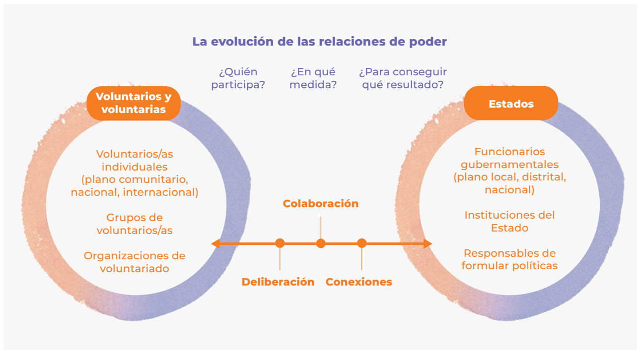
Figura 1. Evolución de las alianzas entre los voluntarios y el Estado

Habida cuenta de que las alianzas entre los voluntarios, voluntarias y el Estado no son estáticas y ninguna de las partes es una entidad homogénea, el informe presenta un marco para comprender la evolución de estas relaciones a través de tres tipos de alianzas: deliberación, colaboración y conexiones.