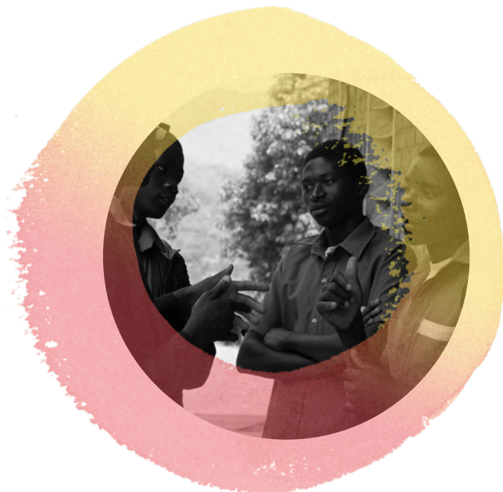
Un voluntario habla sobre la violencia de género con alumnos de Malawi (2021).

El estudio hace énfasis en las repercusiones de la pandemia tanto en las relaciones entre los voluntarios, voluntarias y el Estado como en el propio voluntariado, ofrece perspectivas sobre este ámbito en una época sin precedentes y ayuda a llenar los vacíos de información sobre el voluntariado en el Sur Global.