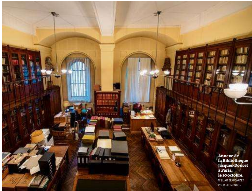
Annexe de la Bibliothèque Jacques-Doucet à Paris, le 10 octobre.

► La direction du prestigieux établissement, abritant des livres rares, est mise en cause P. 20-21