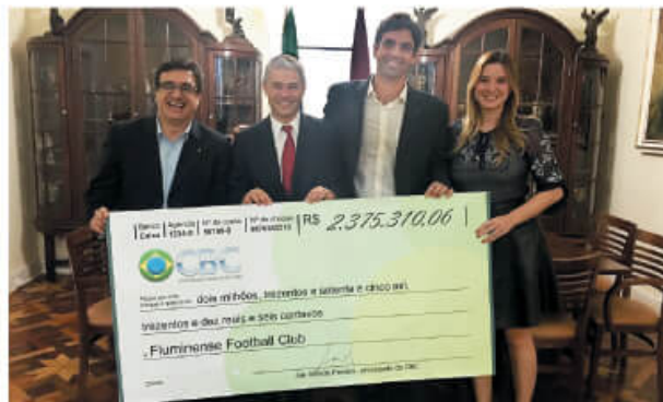
INCENTIVO - Cheque simbólico foi entregue ao Fluminense, para investir em esportes olímpicos