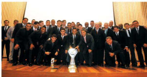
HOMENAGEM MERECEIDA - Campeões exibem a taça na festa de premiação da Primeira Liga

Na campanha, o meia marcou um lindo gol no triunfo por 4 a 3 sobre o Cruzeiro, em Belo Horizonte. Ele fez questão de dividir os méritos com os companheiros e torcedores.