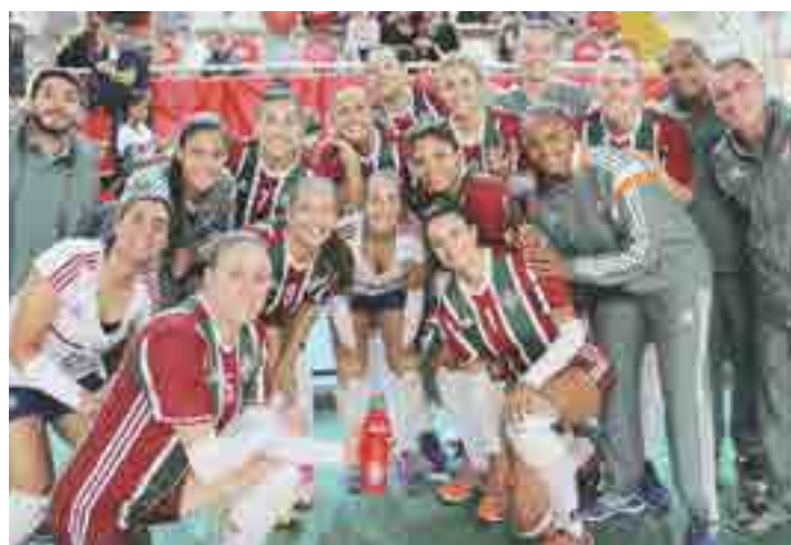
RECONHECIMENTO - Time de Guerreiras é aplaudido de pé pelo público na Argentina

Com excelente campanha, o jogo mais esperado aconteceu na semifinal, em Buenos Aires, quando Fluminense e Camponesa Minas se enfrentaram. Os dois times estarão na Superliga a partir de outubro e disputaram ponto a ponto a chance de avançar para a grande final Metropolitana. E esta foi a única derrota sofrida pelas Tricolores, por 3 sets a 1, com parciais de 34×32, 24×26, 22×25 e 18×25. O Flu venceu o San Lorenzo por 3 sets a 1 na disputa de terceiro lugar e foi