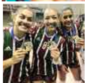
DOMINANTE - Conquista do 25º título carioca consolida o Fluminense como o maior campeão do Rio de Janeiro