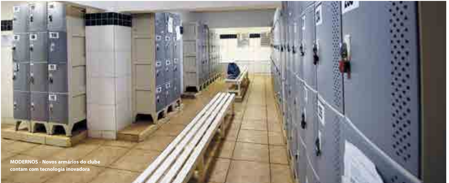
MODERNOS - Novos armários do clube contam com tecnologia inovadora