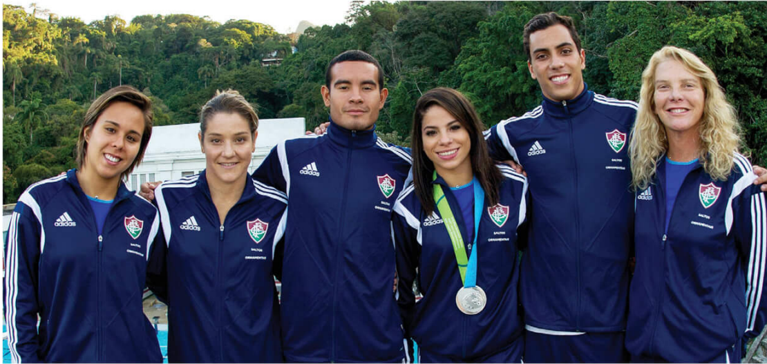
Equipe de saltos ornamentais do Fluminense tem grande tradição e orgulha o Brasil nos Jogos Olímpicos