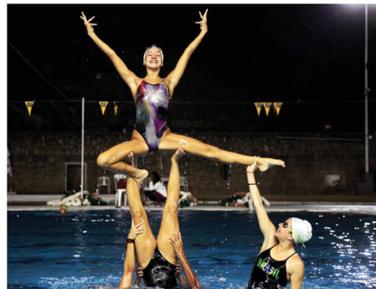
Nado sincronizado tem forte apoio do Fluminense