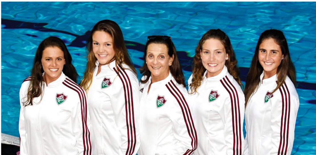
Nado sincronizado tem dedicação intensa e costuma fazer bonito com a força da torcida carioca