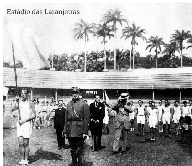
Estádio das Laranjeiras

Em 1919, a CBD – Confederação Brasileira de Desportos – empenhou-se numa campanha para sediar o terceiro Campeonato Sul-Americano de Futebol, que seria o primeiro evento internacional realizado no Brasil. Prontamente, o Fluminense, atendendo ao apelo dos dirigentes da entidade, assumiu o desafio e a responsabilidade de construir o Estádio das Laranjeiras, inaugurando-o na data prevista para o início do