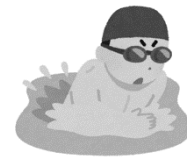
la brasse, nager la brasse