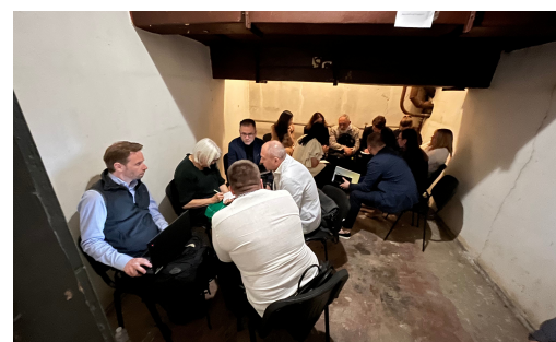
Entrevista en Kiev con la administración de la Secretaría del Comisionado para los Derechos Humanos del Parlamento ucraniano en el refugio durante la alerta aérea.