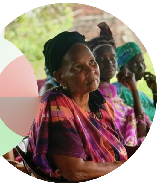
Sesión de sensibilización sobre la violencia sexual y de género en una zona rural, región de Gabu (Guinea-Bissau).

El acceso a los derechos humanos y a la justicia es fundamental en tiempos de conflicto y crisis con el fin de prevenir y abordar los crímenes de guerra, proteger a los civiles, garantizar la rendición de cuentas, amplificar los esfuerzos para mantener la paz y promover el desarrollo con posterioridad a un conflicto, incluido los esfuerzos de justicia transicional. Al mismo tiempo, las medidas de seguridad son esenciales a la hora de salvar vidas, reducir la violencia y mantener el contrato social y la cohesión.