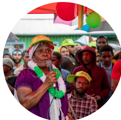
En 2023, el PNUD abrió un espacio de educación por la paz en una escuela local de Kupari, en la provincia de Hela (Papúa Nueva Guinea). En los últimos años, la provincia se había convertido en una área de conflictos entre comunidades.

De cara a la programación de SALIENT en 2024, el equipo desarrolló consultas nacionales en Ghana, Kirguistán, Panamá y Papúa Nueva Guinea con el fin de determinar las necesidades de estos países en materia de reducción de la violencia armada.