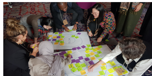
Conocimientos y Aprendizaje Colaborativos sobre Estado de Derecho, Seguridad y Derechos Humanos 2023: fomentar el cambio a través de MEL, innovación e integración. PNUD

En 2023, la unidad de MEL (co)ideó y organizó una serie de actividades de aprendizaje para estimular la reflexión colectiva, el intercambio de conocimiento y el aprendizaje.