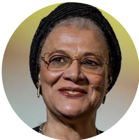
La jueza Amina Augie, del Tribunal Supremo de Justicia de Nigeria, contó su experiencia para llegar a convertirse en jueza en el evento de la Plataforma por la Justicia de Género. #HagueTalks

En 2023, la Plataforma por la justicia de género , una alianza mundial entre el PNUD y ONU Mujeres para promover la igualdad de género y cerrar la brecha de justicia en materia de género mundial, amplió su red y alcance gracias a nuevas asociaciones. Asimismo, se incrementó el apoyo a la programación a nivel nacional y 31 países recibieron ayuda a través de la Plataforma.