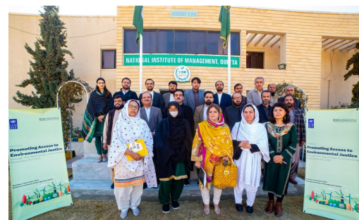
Sesión de consultas sobre la promoción del acceso a la justicia ambiental con las principales administraciones públicas en Baluchistán PNUD