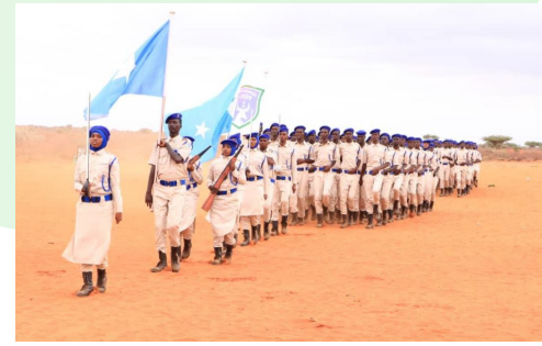
Reclutas básicos de las recién formadas fuerzas policiales de Galmudug.