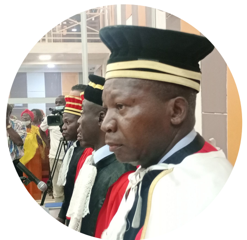
En la República Centroafricana, acabar con la impunidad es la prioridad del Programa Conjunto sobre el Estado de Derecho. PNUD República Centroafricana

Durante 2023, el GFP proporcionó financiación catalizadora y/o experiencia técnica para la elaboración de programas conjuntos sobre el Estado de derecho en la República Centroafricana, la República Democrática del Congo, Haití, Libia, Mali y Somalia