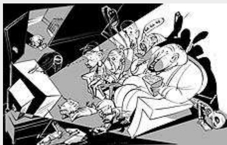
Ilustración: Raúl Arias

«Es difícil imaginar un ambiente más eficaz que el nuestro para producir... obesidad». La cita, procedente de una investigación estadounidense de hace seis años, sigue vigente. Incluso en el Viejo Continente. Y es que los hábitos sedentarios no han hecho más que generalizarse en los últimos tiempos, en especial uno de los que parecen más peligrosos: ver la tele.