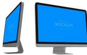
Monitores (Pantalla Plana)