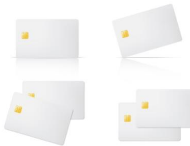
Tarjeta con chip (Anuladas)