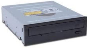
Unidad de CD/DVD