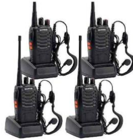
Radio de Comunicación