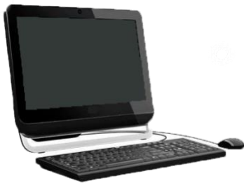
Todo en 1