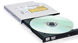
Lectoras de CD/DVD