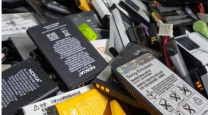
Batería de Celular