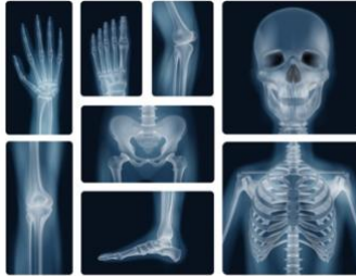
Placas de Rayos X