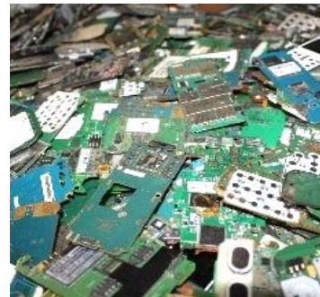
Tarjeta de Celulares