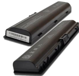
Batería de Portátil

Para ampliar la información, no dude en contactarnos.