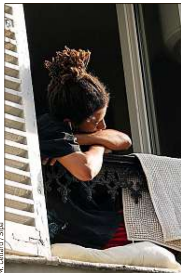
Un rapport affirme que les mesures sanitaires vont se poursuivre.

Rapport Et si le « stop-and-go » devenait notre quotidien d'ici à 2040 ? En épluchant le Rapport Vigie 2020 de Futuribles, qui explore 16 scénarios de rupture à l'horizon 2040-2050, une question se pose : peut-on envisager un retour au monde