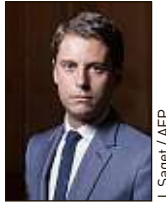
J. Saget / AFP