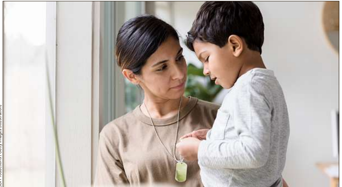
(illustration)