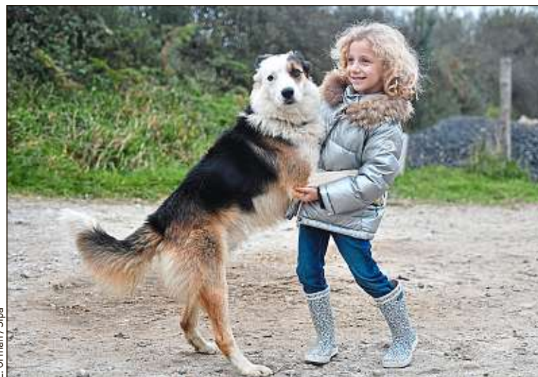
Les chiens seraient plus prompts au jeu quand leur maître est attentif.

montrait beaucoup d'attention, en les complimentant verbalement et en les caressant. Il s'avère que l'attention humaine augmente chez ces animaux à la fois la fréquence et l'intensité de comportements comme les courbettes, les déhanchés, le pugilat, la course-poursuite, les mordillements affectueux, etc. Parmi les hypothèses retenues, la présence d'un humain pourrait déclencher un afflux d'ocytocine, hormone dite de l'amour, qui amène un état émotionnel plus positif et donc plus propice au jeu.