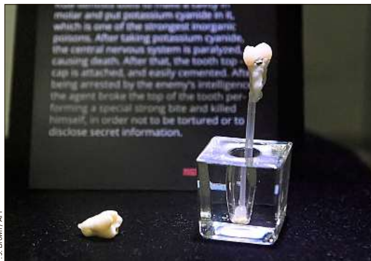
Une fausse dent d'espion du KGB sera mise en vente samedi, à Beverly Hills.

utilisé pour tuer l'auteur bulgare Georgi Markov, dissident assassiné à Londres en 1978. Il est estimé entre 2500 € et 4000 €. Tout aussi emblématique des films d'espionnage, la fausse dent contenant du cyanure a existé. « Elle était conçue pour se briser lorsqu'on la mordait d'une certaine manière, explique Julien's Auction. Ainsi, les agents capturés pouvaient, si nécessaire, mettre fin à leurs jours pour éviter d'être torturés. » Un exemplaire sera en vente pour un prix estimé entre 650 € et 1000 €.