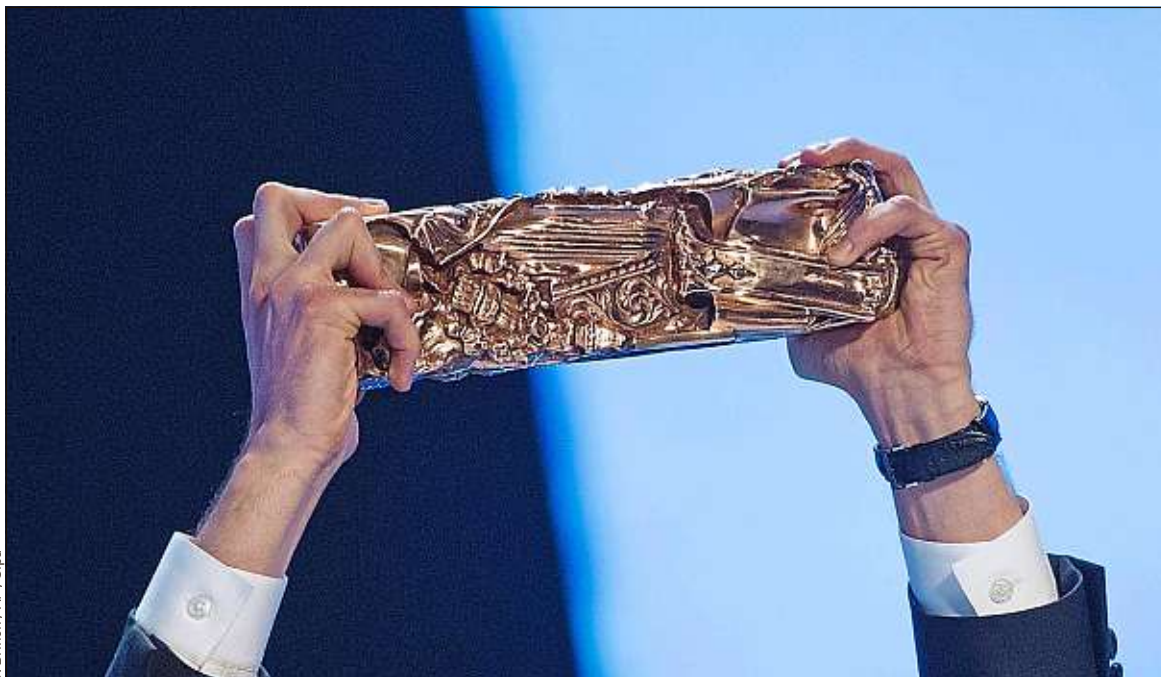
Les membres de l'Académie des César sont appelés à voter pour les films sortis en 2020.