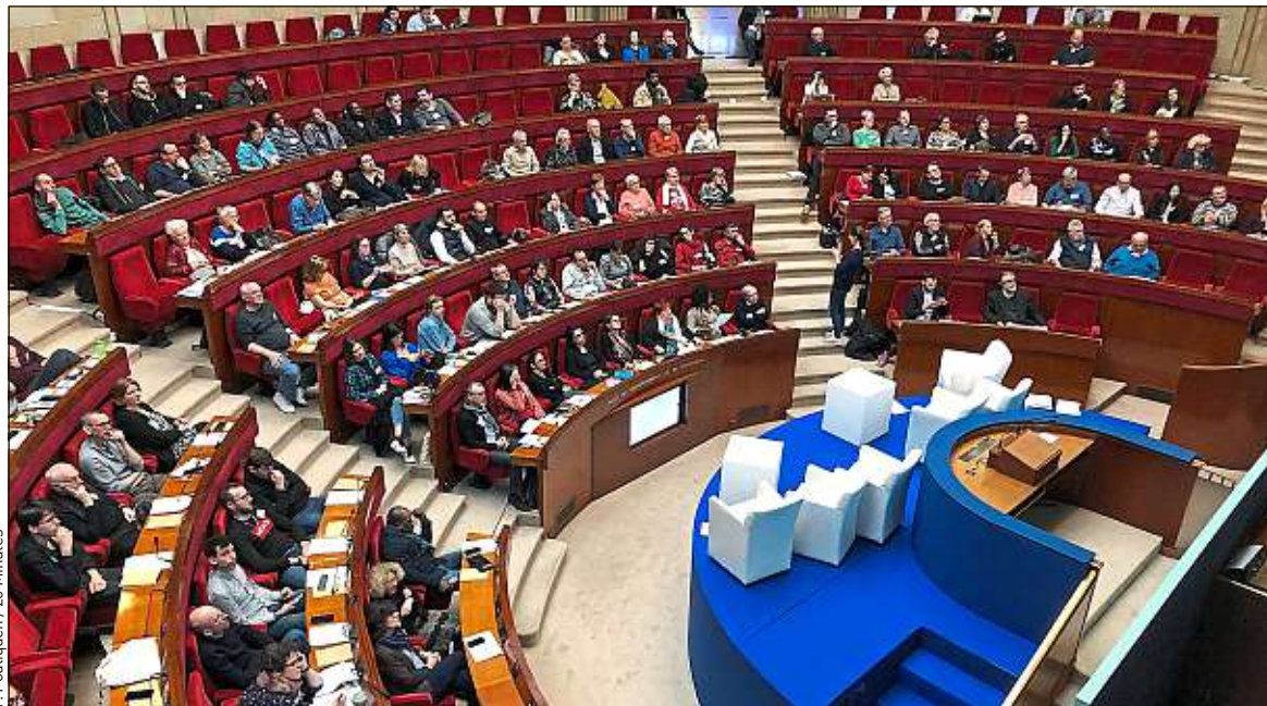
Les membres de la Convention citoyenne pour le climat réunis en hémicycle, en février 2020.

Non, le compte n'y est pas. Le gouvernement a beau dire, le texte manque globalement d'ambition. Il reprend un grand nombre de nos mesures, mais, très souvent, il en réduit la portée ou n'en prend qu'une partie. Un exemple typique est celui de la rénovation énergétique des bâtiments, une proposition-clé de notre rapport, car concernant un domaine fort émetteur de gaz à effet de serre en France. Nous