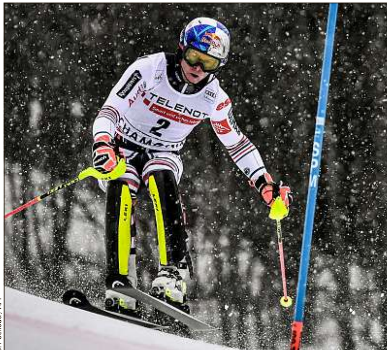
Le skieur de Courchevel est leader du classement de la Coupe du monde.

Cortina d'Ampezzo, ses chalets de luxe, son corso Italia et... Alexis Pinturault. C'est lui le grand favori du combiné de ces mondiaux à huis clos, qui débute ce mercredi. « J'ai des objectifs élevés, mais c'est aussi une quinzaine où il faut skier à fond, du type "ça passe ou ça casse" », témoigne le skieur de Courchevel, qui avance sans pression démesurée. Solide leader du classement de la Coupe du monde, le Français rêve de devenir le meilleur skieur du monde sur une saison, le premier au pays depuis Killy et Alphand. Et la reconnaissance en prime ? Malgré un palmarès béton, Pinturault traverse le sport français sans trop de paillettes.