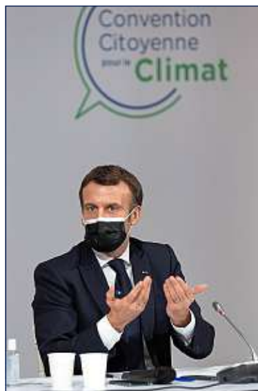
Emmanuel Macron en décembre, lors d'un point d'étape avec la Convention.