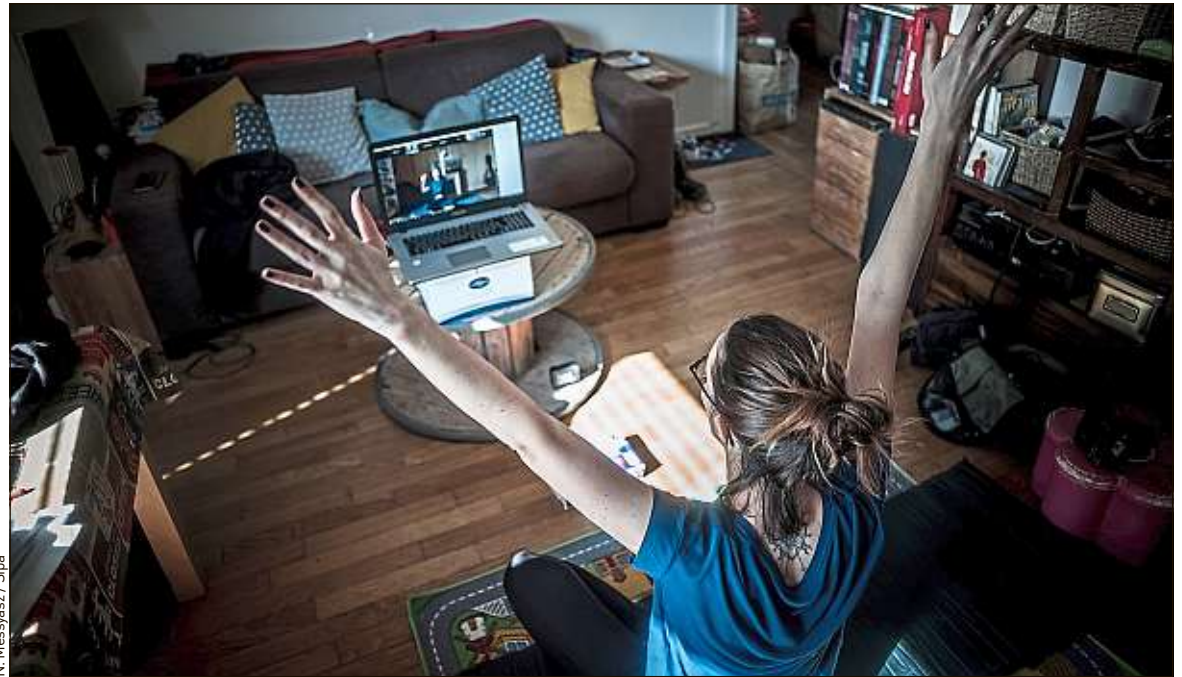
Des activités comme le yoga, qui permettent de bouger, peuvent être aisément pratiquées à la maison.