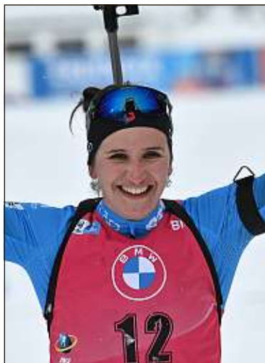
Julia Simon fait preuve de sérénité.

Mardi, le double champion olympique et quintuple champion du monde de ski alpin Ted Ligety, âgé de 36 ans, a annoncé qu'il disputera la dernière course de sa carrière, le 19 février. « La semaine prochaine, le géant des Championnats du monde de Cortina sera ma dernière course, a écrit le skieur américain sur son compte Instagram. J'ai accompli tous mes rêves d'enfant, mais il est temps de rester avec ma famille. »