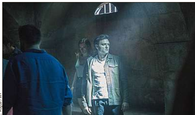
Une bande d'amis dans un escape game plus dangereux que prévu.

Les premiers films sur les escape games sont eux aussi des films d'horreur. Le plus connu, Escape Game , sorti en 2019, raconte comment des individus qui ne se connaissent ni d'Eve ni d'Adam reçoivent la même invitation à participer à une escape room. Salle d'attente qui prend feu, cabane près