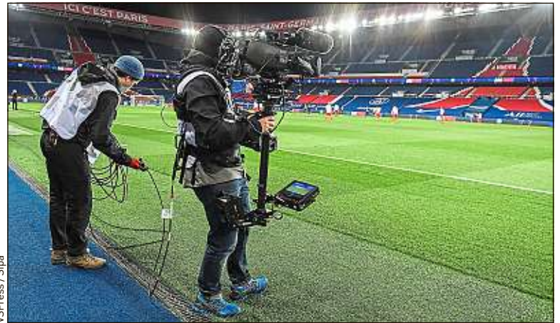
Les droits télé de la Ligue 1 devraient être renégociés à la fin de la saison.