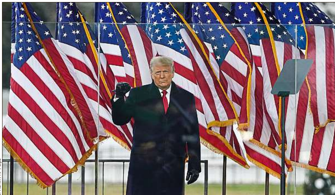
Donald Trump s'adresse à ses supporters avant l'attaque contre le Capitole, le 6 janvier, à Washington.

Lundi, démocrates et républicains se sont mis d'accord sur les règles. Le procès va commencer ce mardi par un débat de quatre heures, suivi d'un vote préliminaire. Ensuite, les procureurs démocrates auront seize heures pour présenter leur dossier. Ils accusent Donald Trump d'avoir « volontairement incité à la violence » ses supporters, qui ont pris d'assaut le Capitole, le 6 janvier. Les avocats de l'ex-président américain disposeront de la même durée. Ils soutiennent que son discours relevait