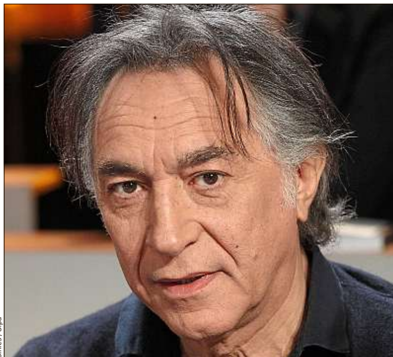
L'acteur (ici en 2016) a-t-il eu raison de s'exprimer si vite ?