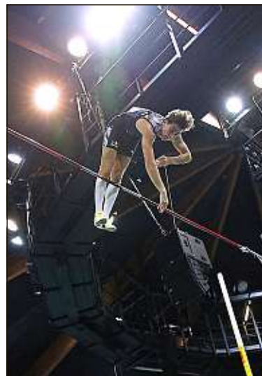
Armand Duplantis à Liévin en 2020.