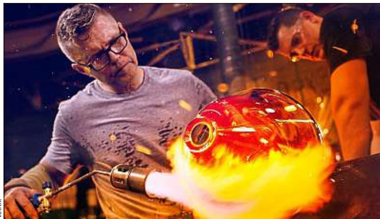
Des candidats prêts à braver le feu pour remporter la compétition et 50 000 €.

C'était sans compter sur l'imagination sans limite des producteurs venus d'outre-Atlantique. Le 22 janvier, Netflix a mis en ligne la deuxième saison d'« En verre et contre tous », une émission dans laquelle s'affrontent dix souffleurs et souffleuses de verre.