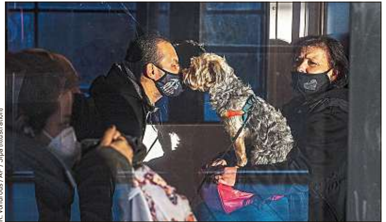
R. Vondroux / AP / Sipa (illustration)

Le fait d'être plus souvent à la maison a permis une meilleure adaptation de ces animaux de compagnie, comme le souligne Laurine : « Le confinement nous a permis d'être présents pour accompagner le chiot dans notre nouvelle vie et de répondre à ses besoins. » Pour