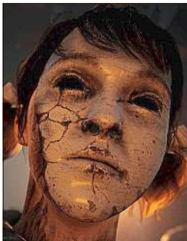
Bonne ambiance entre vivants et morts dans le jeu vidéo The Medium .

Les musées ouvrent, ferment, ouvrent, etc.