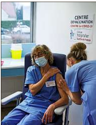
En France, le vaccin AstraZeneca est injecté en priorité aux soignants.

Pour ce qui est des cas contact de personnes infectées par les variants brésilien et sud-africain, la DGS élève aussi le niveau de vigilance. Elles doivent « bénéficier d'un test PCR dès l'identification », précise-t-elle. Et même en cas de résultat négatif, elle insiste sur « l'importance de bien respecter la période de quarantaine de sept jours depuis le dernier contact à risque et sur la nécessité de réaliser un test RT-PCR à J7, à l'issue de cette période ». Anissa Boumediene