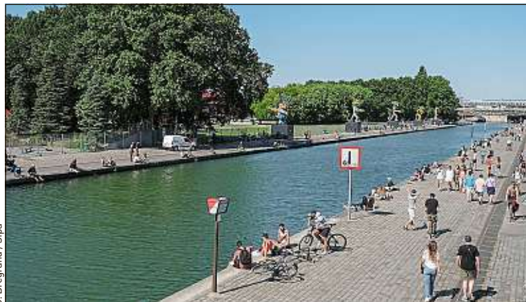
L'association Paris en selle demande des aménagements sur ce tronçon.