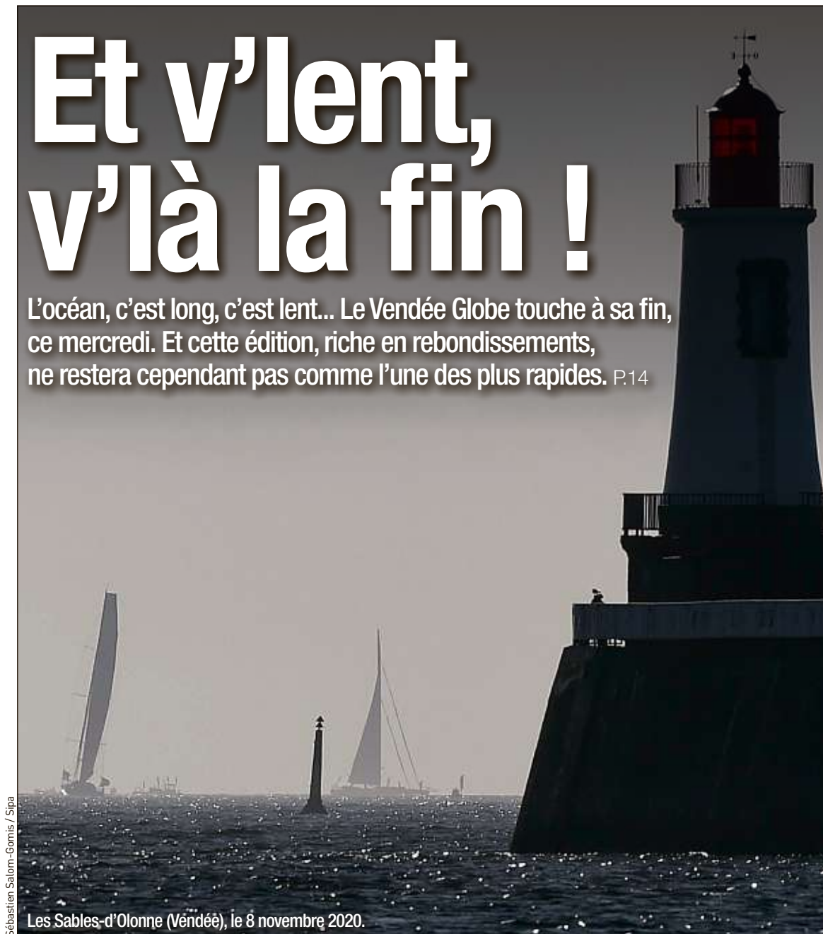
Les Sables-d'Olonne (Vendée), le 8 novembre 2020.

L'océan, c'est long, c'est lent... Le Vendée Globe touche à sa fin, ce mercredi. Et cette édition, riche en rebondissements, ne restera cependant pas comme l'une des plus rapides. P.14