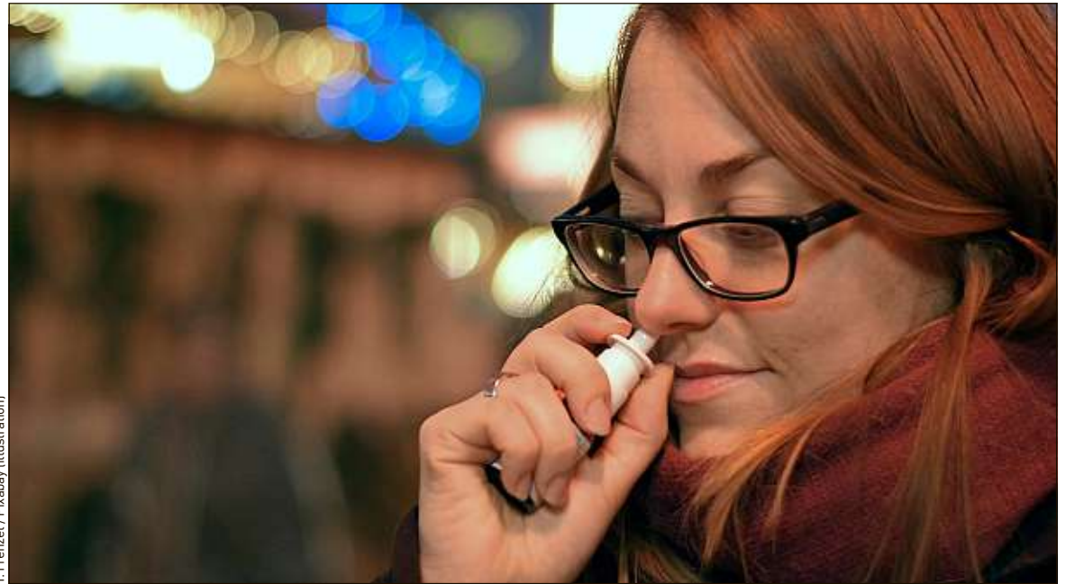
T. Frenzel / Pixabay (illustration)

► Bain de bouche. Et pourquoi pas un dispositif aux effets similaires pour une hygiène buccale anti-Covid ? Un bain de bouche, lui aussi capable de réduire la charge virale, a été mis au point par le géant Unilever. Le groupe néerlandais-britannique a commandé une étude indépendante sur l'efficacité virucide de son produit à base de chlorure de cétylpyridinium (CPC),