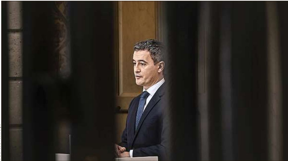
Le ministre de l'Intérieur a laissé entendre aux juges que la plainte qui le vise a été déposée par vengeance politique.