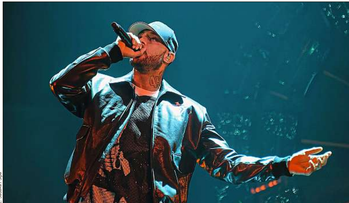
Booba (ici en concert en 2018 à Nanterre, dans les Hauts-de-Seine) vient de dévoiler Ratpi World , sa reprise de Barbie Girl .

Si Booba a surpris ses fans avec cette « cover », il est loin d'être le premier à s'être frotté à ce carton planétaire qui a marqué toute une génération (en bien ou en mal, on vous laisse décider). Avant B2O, la chanson du groupe scandinave avait déjà fait une incursion dans le rap en 2016 avec My World , de Jul. Comme Booba, le rappeur marseillais avait totalement réécrit la chanson, tout en conservant