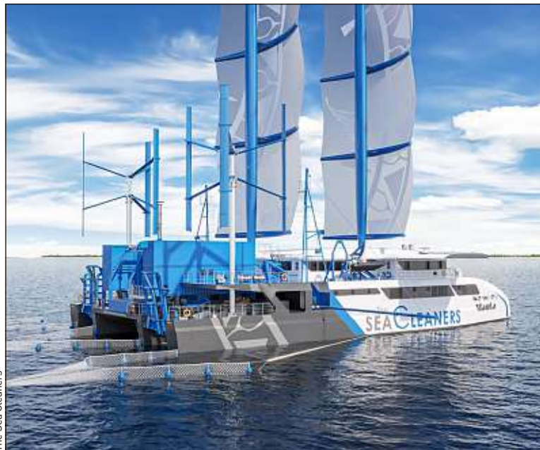
The skippeur Yvan Bourgnon espère mettre à l'eau le bateau en 2024.

Un centre de collecte des déchets, un centre de tri et une usine de recyclage. Le Manta remplira ces trois fonctions à la fois, avec la particularité de le faire sur l'eau. Car c'est d'abord un bateau. Un voilier géant qu'imagine Yvan Bourgnon. Mardi, le skippeur franco-suisse et The Sea Cleaners, l'association qu'il a fondée autour de ce projet, ont dévoilé la maquette de leur futur navire avec laquelle ils vont démarcher les chantiers navals. «La construction devrait être lancée en 2022 pour une mise à l'eau en 2024», confie le navigateur.