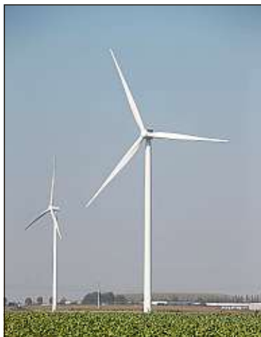
Selon un sondage, 76 % des Français ont une bonne image des éoliennes.

Une loi autorisant la mort médicalement assistée au Portugal sera soumise vendredi au vote des députés, a-t-on appris auprès du Parlement. Le pays pourrait devenir le quatrième en Europe à dépénaliser l'euthanasie.