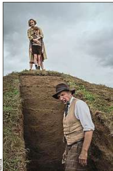
Carey Mulligan (en haut) et Ralph Fiennes dans The Dig .

dans la réalité de l'Angleterre à la veille de la Seconde Guerre mondiale. «Ces deux personnes ont fait table rase de leurs différences sociales pour parvenir à un but commun. Elles méritaient un film», explique Carey Mulligan à 20 Minutes .