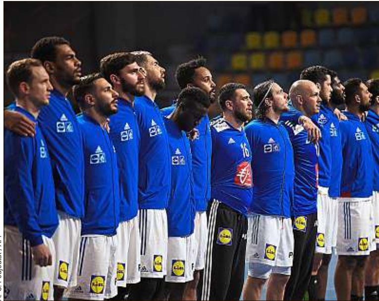
Si les Bleus l'emportent en Egypte, ils gagneront aussi un nouveau surnom.

A cette question, tous nos interlocuteurs ont répondu par la négative. A commencer par le sélectionneur : « Les faits sont là, il reste très peu d'Experts dans ce