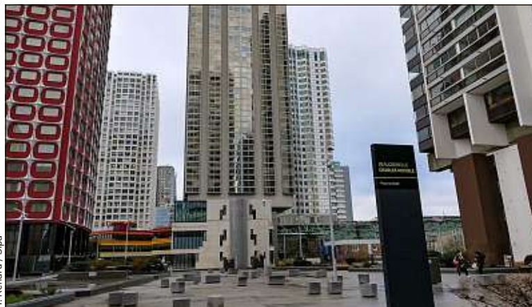
La dalle Beaugrenelle, où Yuriy, 15 ans, a été lynché, le 15 janvier.

La vidéo est d'une violence inouïe. Une dizaine d'individus s'acharnent sur Yuriy, 15 ans, à terre. C'était le 15 janvier, sur la dalle Beaugrenelle (15 e ). L'adolescent, qui souffre de multiples fractures, notamment au crâne, reste dans un état critique. L'enquête, elle, se précise. Et si aucune interpellation n'a encore eu lieu, les enquêteurs penchent pour un règlement de comptes entre bandes rivales, en l'occurrence entre celles de