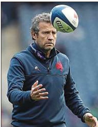
Fabien Galthié et les Bleus sont en stage une semaine dans le Sud.

La Floride fait ami-ami avec le CIO. La Floride peut-elle sauver les Jeux olympiques en cas de désistement de Tokyo sur fond de crise sanitaire ? Le responsable des finances de la Floride a écrit une lettre au Comité international olympique (CIO) afin de convaincre celui-ci de se tourner vers la Floride, si le Japon venait à abandonner les JO 2020.