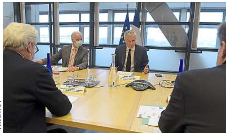
Alain Griset (au fond à g.) et Bruno Le Maire ont reçu les restaurateurs, mardi.

L'inquiétude réside aussi dans le manque de visibilité sur les semaines et mois à venir. C'était d'ailleurs l'une des demandes de la délégation reçue