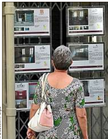
Les recherches de biens immobiliers ont grimpé après le confinement.

Nous constatons que les prix au m 2 dans les villes moyennes augmentent, et donc