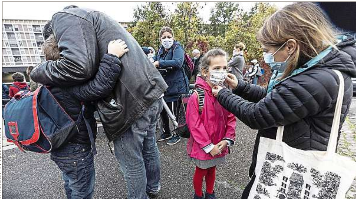
Le variant du Covid-19 est soupçonné de rendre la maladie plus contagieuse et d'infecter davantage les enfants.

Ce début d'année a comme un parfum de mars 2020. Du moins en Angleterre et en Écosse, où les écoles resteront fermées jusqu'aux vacances de février. Les autorités britanniques ont annoncé lundi soir un confinement strict jusqu'à mars pour répondre à l'explosion du nombre de cas de Covid-19 et aux hôpitaux surchargés (lire ci-dessous). Face à des chiffres qui ne baissent toujours pas en France (346 décès et 20 489 nouveaux cas mardi), certains s'interrogent. Ne faudrait-il pas garder les écoles fermées et les enfants au chaud ? En cause, le variant anglais du coronavirus.