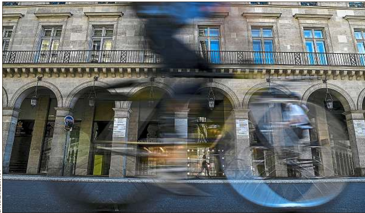
Plus de 318 000 bicyclettes ont été volées en 2018, selon les chiffres du ministère de l'Intérieur.