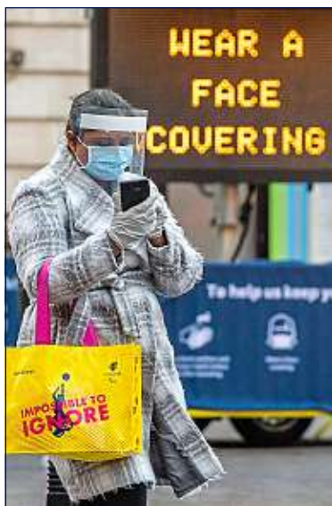
Le nombre de contaminations ne cesse d'augmenter outre-Manche.

Pour ce qui est de la France en particulier, le pays reste sur une ligne de crête. « Avec un R aux alentours de 1, parfois un peu en dessous, la France peut encore se placer dans les pays qui maîtrisent l'épidémie, note Antoine Flahault. Mais son cas peut s'aggraver à tout moment. » Jean-Loup Delmas