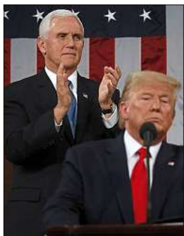
Le vice-président des Etats-Unis, Mike Pence (à g.), et Donald Trump.

L'ancienne garde des Sceaux Elisabeth Guigou a-t-elle couvert les agissements d'Olivier Duhamel ? Dans les années 1990, elle fréquentait le couple formé par le politologue et sa femme, Evelyne Pisier. « Mais elle ne savait rien, a fait savoir à 20 Minutes son entourage. Elle reconnaît les avoir côtoyés. Mais c'est tout ! » Nommée en décembre à la tête d'une commission sur les violences sexuelles faites aux enfants, elle n'entend pas démissionner. « Elle travaille et a rencontré des associations de victimes. »