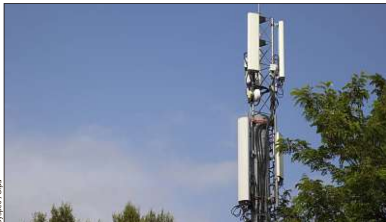
Pour Xavier Niel, la technologie sera disponible à Paris « avant fin février ».

La 5G très prochainement à Paris ? C'est en tout cas ce que prédit Xavier Niel. Le nouveau réseau sera disponible dans la capitale « avant fin février pour tous les opérateurs », a assuré le fondateur de Free, lundi. « Paris a été une ville prudente, il y a eu une peur. Mais j'ai l'impression que les choses avancent dans le bon sens », a-t-il ajouté dans un entretien à BFM Business.