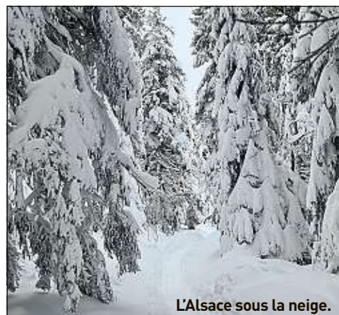
L'Alsace sous la neige. S. Wolff

Cette photo nous a été envoyée par Sylvie Wolff via Instagram @wolffsylvie.