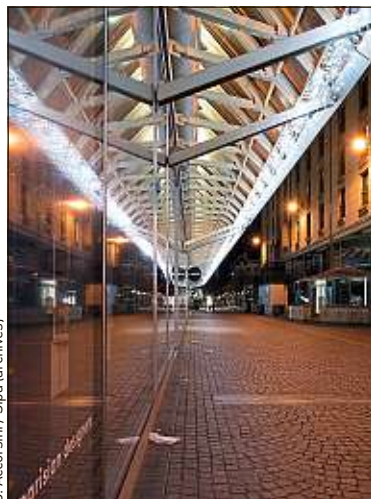
Le couvre-feu est jusqu'à présent maintenu à 20 h à Paris.

exemple – pourraient rapidement « basculer », le taux d'incidence général et/ou concernant les plus de 65 ans étant désormais supérieur à 200 cas pour 100 000 habitants (le seuil