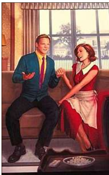
WandaVision, le 15 janvier sur Disney+.