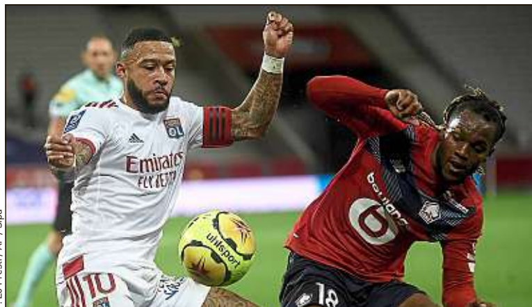
Le Lyonnais Depay (à g.) et le Lillois Sanches sont en pleine confiance.

► Parce qu'ils sont en pleine confiance. Une seule défaite en 17 matchs de Ligue 1. Le rythme imposé par l'OL et le Losc en tête du championnat donne le tournis. Seulement battu à Brest en novembre, Lille est constant et impressionnant depuis le début de saison. A l'inverse de Lyon, les Dogues ont aussi joué en Ligue Europa, en semaine. Un rythme fou qui ne les a pas empêchés de se qualifier brillamment pour les seizièmes de finale, tout en jouant