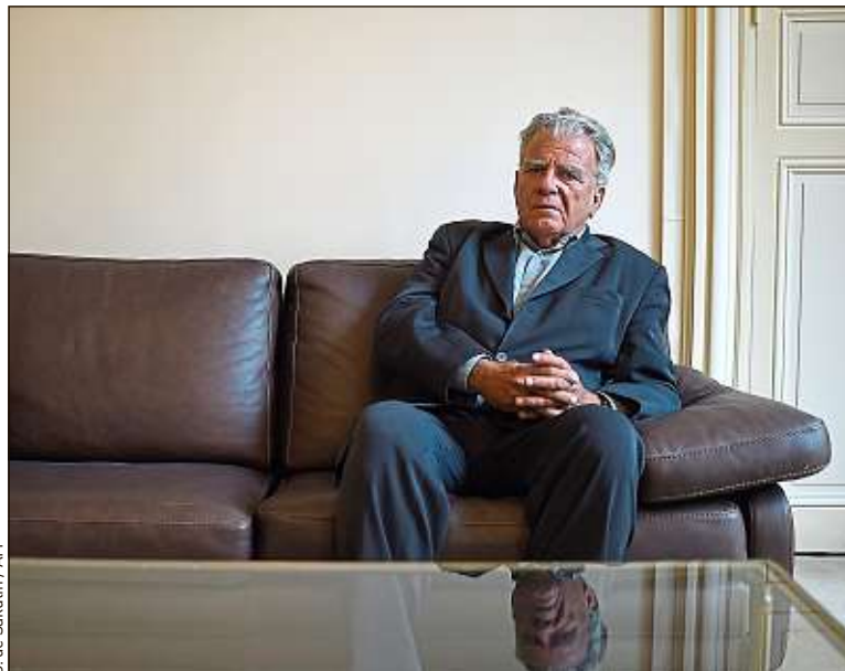
Olivier Duhamel est visé par une enquête pour viols et agressions sexuelles.