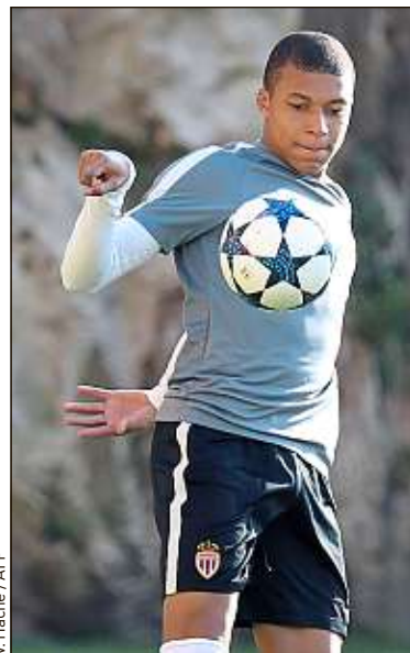
Kylian Mbappé, à Monaco, en 2017.