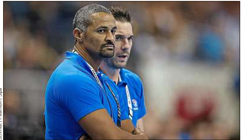
Didier Dinart (à g.) et Guillaume Gille, lors des championnats du monde 2019.