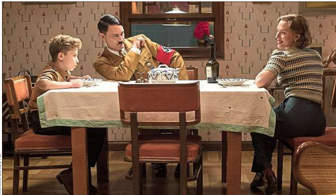
Le réalisateur et scénariste Taika Waititi incarne lui-même Adolf Hitler, ami imaginaire du jeune héros.

Le film Jojo Rabbit , de Taika Waititi, raconte l'histoire d'un gamin des Jeunesses hitlériennes, qui a pour ami imaginaire un Adolf Hitler grotesque et fantasmé. « Bien que je ne ressemble en rien à Hitler, je ne voyais personne d'autre que moi pour jouer le rôle, car je ne voulais pas faire prendre ce risque à quelqu'un d'autre », confie Taika Waititi à 20 Minutes . Acteur, réalisateur et scénariste de cette comédie qu'il qualifie d'« antihaine », le Néo-Zélandais a dû avoir recours à un maquillage sophistiqué pour ressembler à « Adolf », comme l'appelle familièrement le jeune héros.