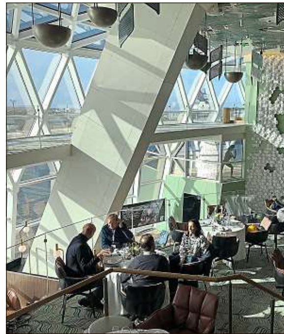
Du luxe à tous les étages, 11 restaurants... Le « Celebrity Apex » naviguera dès cet été en Méditerranée.