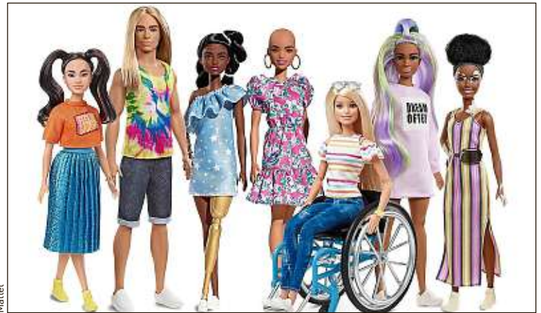
Lancée en 2015, la gamme Fashionistas s'agrandit cette année.