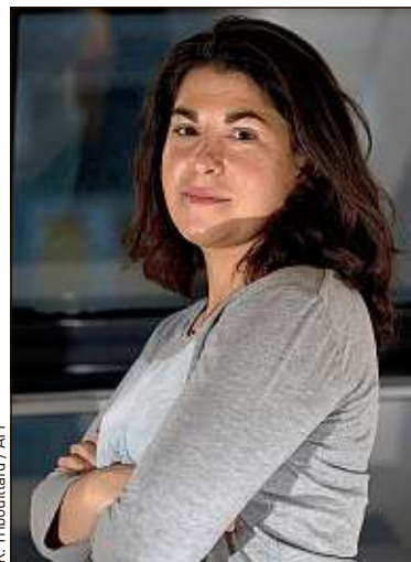
Caroline Boudet a écrit L'Effet Louise .

que la scolarisation en milieu ordinaire est un simple droit pour leur enfant. Et beaucoup de chefs d'établissement ignorent aussi qu'ils ne peuvent pas refuser d'accueillir un enfant handicapé à plein temps. L'école française n'est pas encore inclusive. Elle se contente d'offrir un strapontin aux élèves handicapés, mais ne les intègre pas vraiment en adaptant l'enseignement.