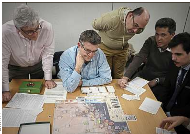
La guerre au Moyen-Orient était disputée sous forme de jeu, lundi à Paris.