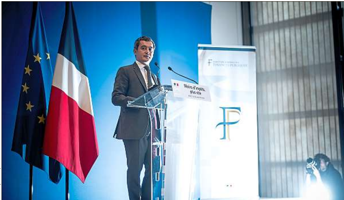
Le ministre des Comptes publics, Gérald Darmanin, s'est satisfait de la mise en place de la réforme de l'impôt.