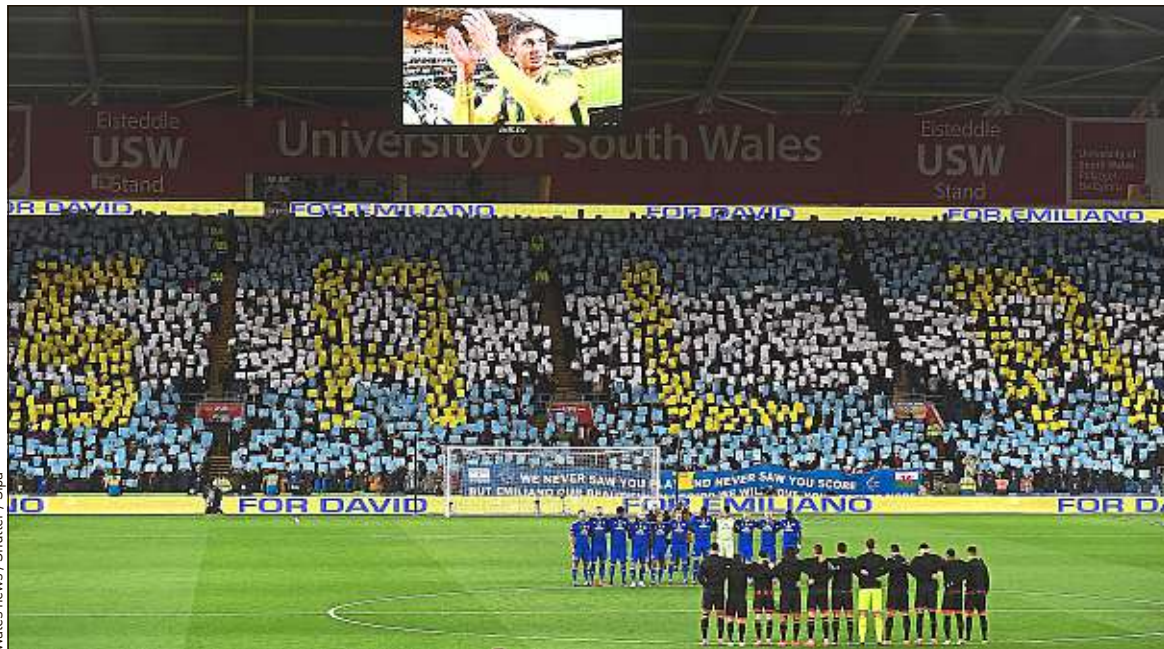
Le club gallois de Cardiff, où avait été transféré Emiliano Sala, n'a toujours pas réglé le montant du transfert à Nantes.

► Sait-on pourquoi l'avion s'est écrasé ? Depuis que l'épave du Piper Malibu a été retrouvée le 3 février 2019, à 68 m de profondeur au large de Guernesey, les enquêteurs de l'AAIB (l'équivalent du Bureau d'enquêtes et d'analyses en France) ont publié plusieurs rapports. Le 14 août, ils révélaient que Sala et Ibbotson ont été exposés à des niveaux nocifs de monoxyde de carbone. Comment ce gaz, produit par les moteurs à piston, mais normalement évacué hors de l'appareil, a-t-il pu pénétrer dans l'appareil ? L'AAIB évoque « une mauvaise étanchéité de la cabine ou des fuites dans les systèmes de chauffage et de ventilation ». ► Quand sera rendu le rapport final de l'AAIB ? Les conclusions sont attendues avant la prochaine audience, le 16 mars. « Tous les facteurs techniques, opérationnels, organisationnels et humains qui ont provoqué l'accident ont été étudiés », a expliqué à 20 Minutes Crispin Orr, inspecteur-chef à l'AAIB.