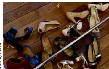
J. Delay / Sipa