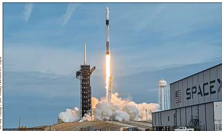
Lancement de la capsule Crew Dragon , dimanche en Floride.

SpaceX, créée en 2002, passera à « l'âge de la maturité si elle réussit le