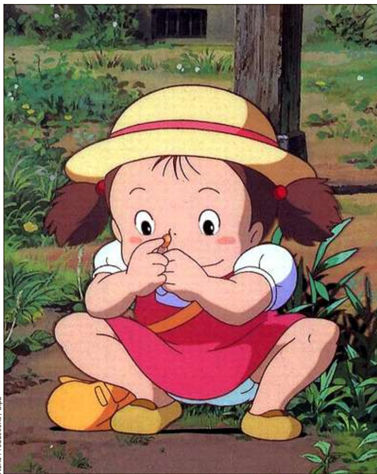
Nana Productions / Sipa

► Tout en splendeur. Dès le 1 er avril, le spectateur se plongera dans des longs-métrages plus difficiles d'accès [ Le Château ambulante (2004) et Le Vent se lève (2013)] où Miyazaki-san s'interroge sur la vieillesse et la création. Pompoko (1994) de Takahata a de quoi émouvoir tant son message écologique est poignant. Caroline Vié