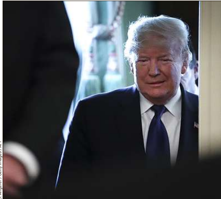
Dans cette affaire, Donald Trump ne devrait pas prendre la parole.

Techniquement parlant, il faudrait un vote de 51 sénateurs pour convoquer des témoins. Des républicains semblent être favorables à cette option, comme Mitt Romney et Susan Collins, mais il en faudra 4 au total, en plus des 47 sénateurs démocrates. Eux réclament déjà la convocation de quatre protagonistes-clés. Parmi ceux-ci, l'ancien conseiller à la Sécurité nationale, John Bolton. Après avoir tergiversé, il a indiqué début janvier qu'il accepterait de témoigner s'il est convoqué. Autre témoin réclamé :