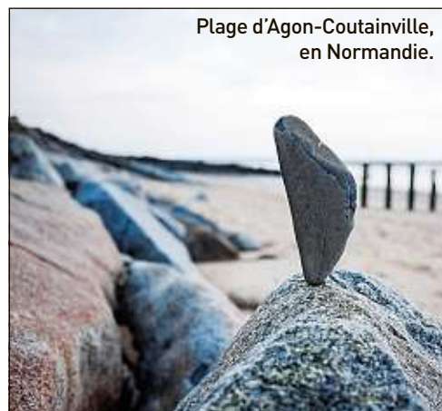
Plage d'Agon-Coutainville, en Normandie.