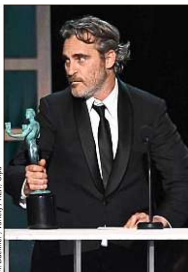
Joaquin Phoenix a été désigné meilleur acteur lors des SAG Awards.

presque notre main à couper. Car Joker est de ces films « à oscars », puisqu'il contient l'ingrédient incontournable : l'acteur qui transforme son corps, tels Charlize Theron dans Monster ou Matthew McConaughey dans Dallas Buyers Club . Après des semaines de légumes cuits à la vapeur et 24 kg en moins sur la balance, Joaquin Phoenix a enfilé le costume de l'avant-Joker, Arthur Fleck.