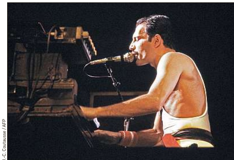
Le piano de Freddie Mercury est représenté sur les pièces de monnaie.

jouent des notes du début de Bohemian Rhapsody . Au centre se trouve l'inscription « Queen », soulignée par un micro. « C'est vraiment un moment où l'on pense : "Qui aurait pu imaginer une chose pareille pour nous" », a déclaré Brian May dans un communiqué de la maison de disques Universal. Le prix de ces pièces en édition limitée destinées aux collectionneurs s'échelonne de 13 £ (15 €) pour une pièce de 5 £ (près de 6 €), jusqu'à 2 020 € (2 360 €) pour la pièce dorée de 100 £ (117 €).