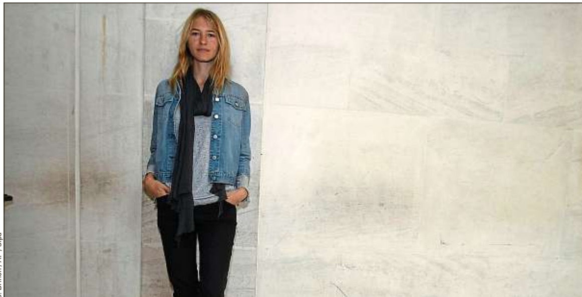
L'ex-mannequin Sara Ziff (ici en 2010) a fondé la Model Alliance pour défendre les conditions de travail des modèles.

Pour se faire une place, il faut persévérer et avoir le « look » : un air « subtil », « un peu malade » et être « très mince », se rappelle Arhel. La jeune femme avait un IMC de 15,3, bien en dessous des standards de l'OMS pour une « corpulence normale », entre 18,5 et 25. « Les habits qu'on vous demande