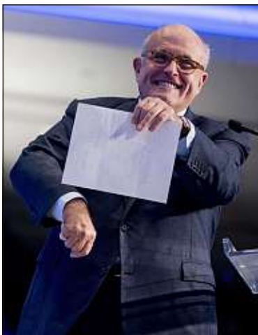
Une lettre de l'avocat de Trump, Rudy Giuliani, a été publiée jeudi.

Regina Duarte, célèbre actrice brésilienne de telenovelas, a rencontré, lundi, le président Jair Bolsonaro. Elle a laissé entendre qu'elle pourrait accepter de remplacer le secrétaire à la Culture, limogé après avoir paraphrasé un discours de Goebbels.