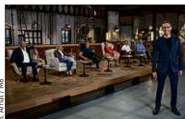
S. Amal / M6

«Payer la terre» ou le coût du déclin d'un peuple de l'Arctique P.7