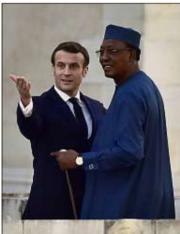
Emmanuel Macron et le président tchadien, Idriss Déby, lundi à Pau.