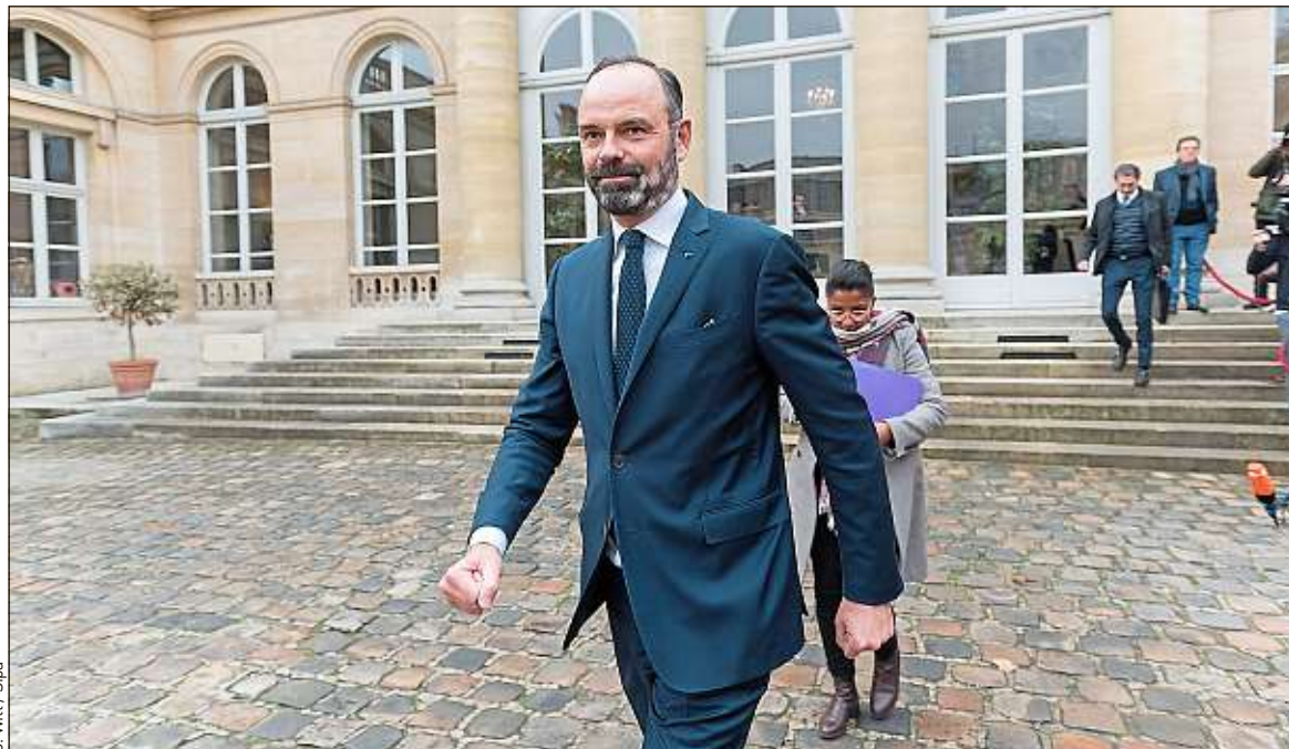
Edouard Philippe a demandé aux syndicats une solution pour atteindre l'équilibre financier du système des retraites.