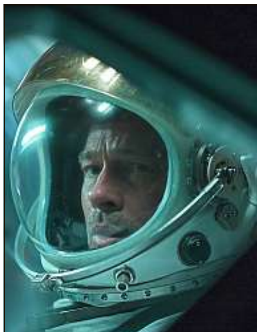
La prouesse technique d' Ad Astra ne sera pas récompensée.