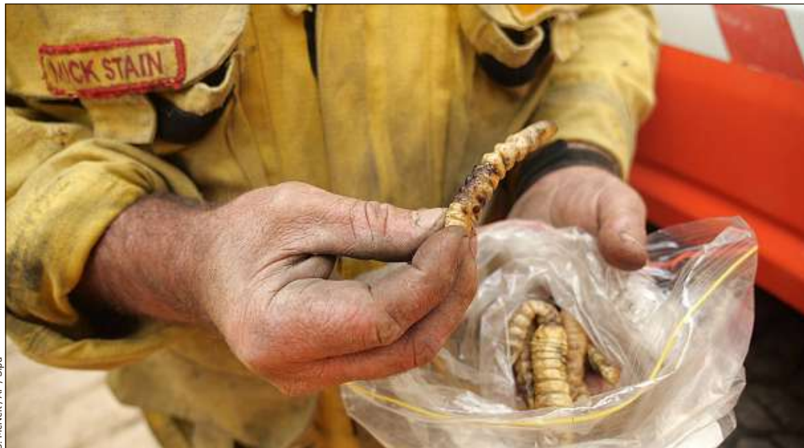
Les insectes font partie du « million de milliards » d'animaux victimes des incendies qui touchent l'Australie.

d'hectares en Australie. « Un incendie est un élément naturel dans le fonctionnement d'un écosystème, et même