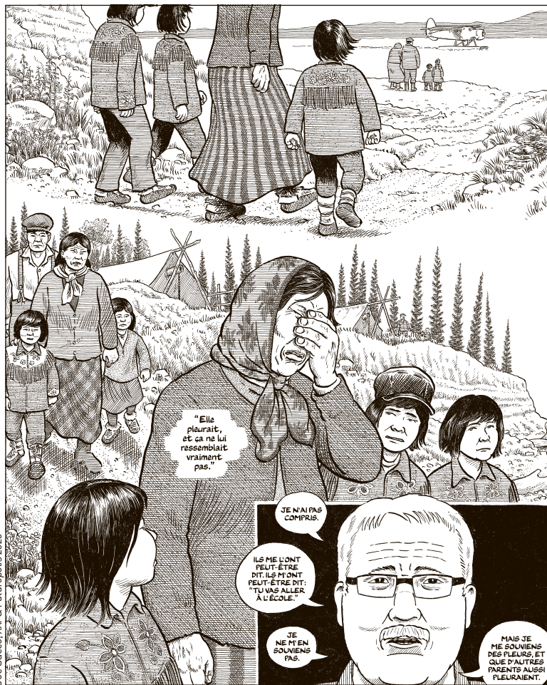
Joe Sacco, XXI & Futuropolis 2020