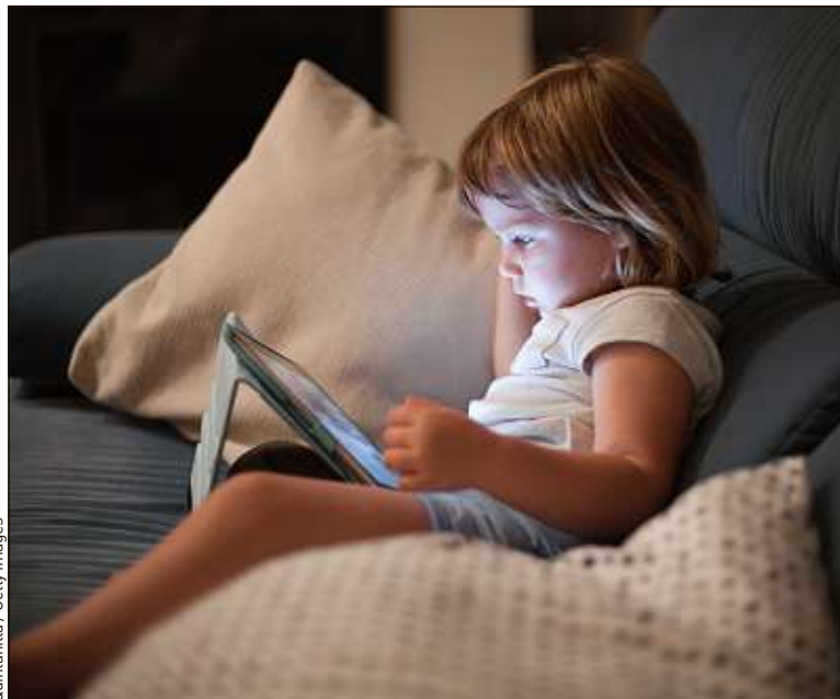
Regarder un écran le matin influencerait sur la concentration de l'enfant.

Depuis des années, le débat fait rage. Certains médecins alertent sur les effets néfastes des écrans sur la santé et l'apprentissage des plus petits ; d'autres tempèrent, précisant qu'aucun danger n'a été prouvé scientifiquement. « Il n'est pas recommandé de placer un enfant de 1 an devant un écran. A 2 ans, une heure devant l'écran doit être un maximum », indiquait l'Organisation mondiale de la Santé, en avril. Ce mardi, une étude de Santé publique France se penche sur les liens entre exposition aux écrans le matin et troubles du langage.