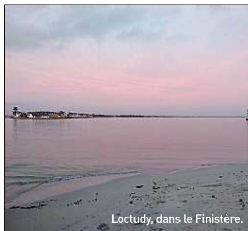
Loctudy, dans le Finistère.