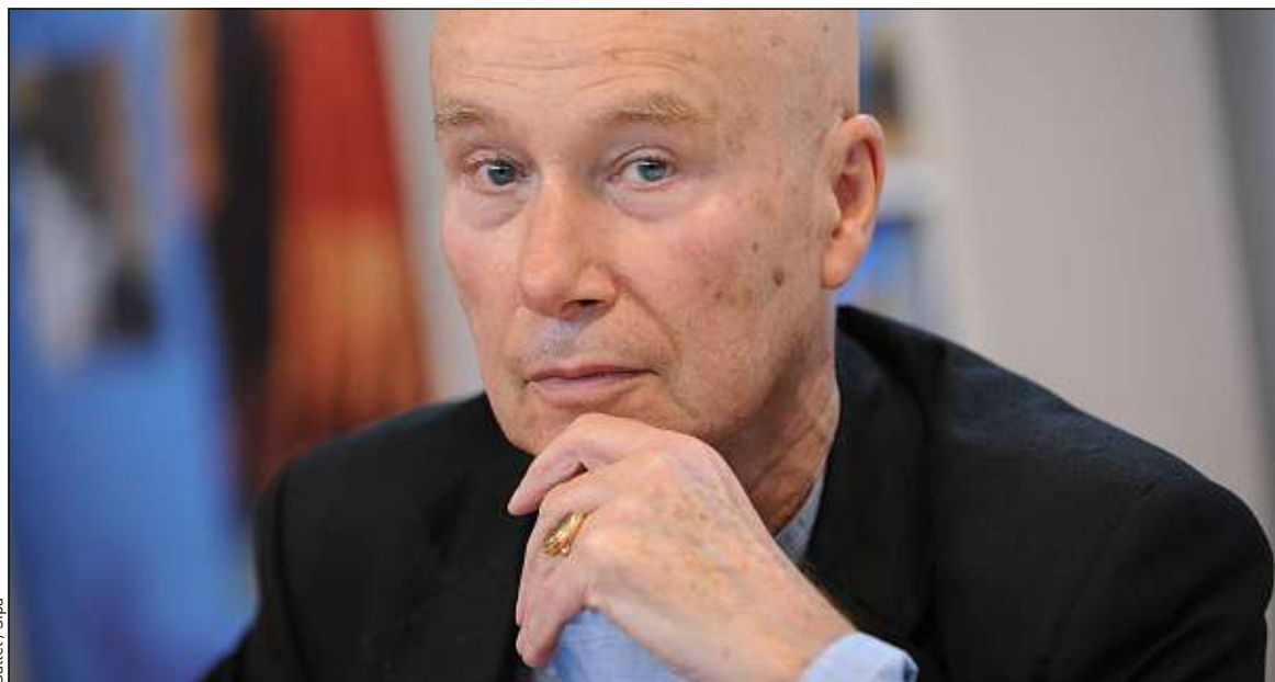
L'écrivain Gabriel Matzneff, âgé de 83 ans, est la cible de vives critiques depuis plusieurs jours.

jugé comme une erreur. Baudelaire a été considéré comme quasi irresponsable, et n'a donc pas été emprisonné. Mais la croyance en un lien intime entre l'œuvre et son auteur est bien ancrée depuis le romantisme, et leur séparation relève d'une position d'esthète qui n'est pas majoritaire dans la société.