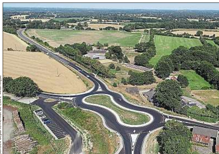
Conseil départemental de Loire-Atlantique

Ce rond-point vise à améliorer la sécurité routière, explique la collectivité.