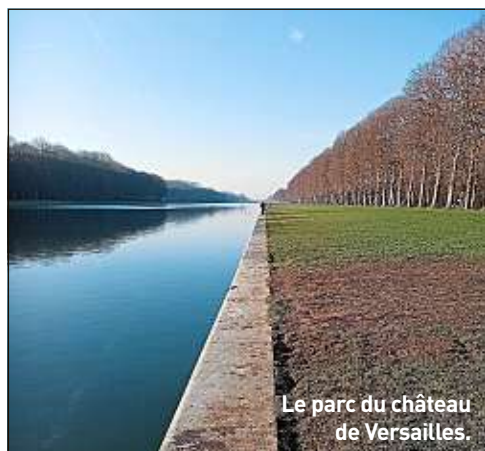
Le parc du château de Versailles.