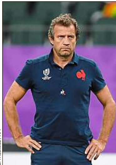
Fabien Galthié, le sélectionneur.

« Les jeunes qu'on a pris ont gagné dans les équipes nationales précédentes [en U20], rassure le manager Raphaël Ibanez. On n'a pas le sentiment de prendre un risque particulier. Il y a une forme de logique à retrouver ces noms. » Et puis il ne s'agit que d'un