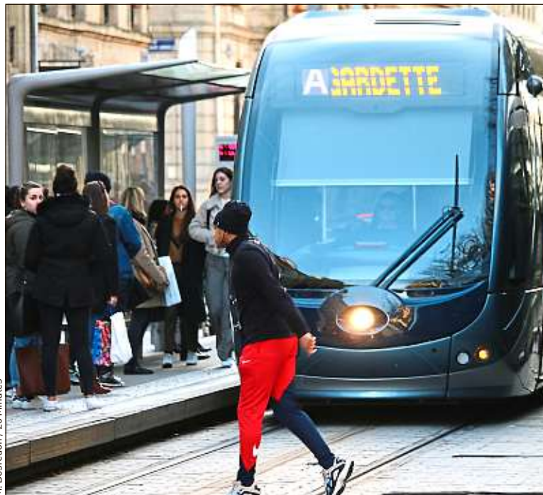
M. Bosredon / 20 Minutes

Au 36 e jour de grève contre le projet de réforme des retraites, la mobilisation reste forte à la SNCF comme à la RATP. Dans les transports en commun des grandes villes de province, la grève est en revanche beaucoup moins incommode pour les usagers. Par exemple, à Nantes, le réseau de la TAN a été peu perturbé. A Bordeaux, l'entreprise privée Keolis (dont la SNCF est actionnaire à 70 %), qui gère le réseau TBM, annonce un taux de grévistes de 24 % chez ses conducteurs pour ce jeudi.