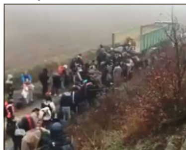
Capture d'écran Twitter

Dimanche, un train Bordeaux-Marseille est tombé en panne en rase campagne à Tonneins, dans le Lot-et-Garonne. Il a dû s'immobiliser en pleine voie vers 7h30 à la suite d'un problème d'électrification de la ligne. Mais l'évacuation de la centaine de passagers s'avérait difficile car il n'y avait pas de chemin praticable pour le bus de substitution. Des agriculteurs ont donc proposé d'acheminer les voyageurs dans la benne de leurs tracteurs jusqu'au bus de substitution, sur environ 1 km. La SNCF reconnaît que le procédé n'est pas courant.