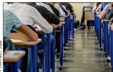
K. Komrad / Sipa