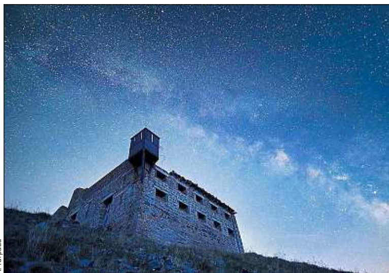
Le fortin du mont des Fourches (Alpes-Maritimes), sous la Voie lactée.