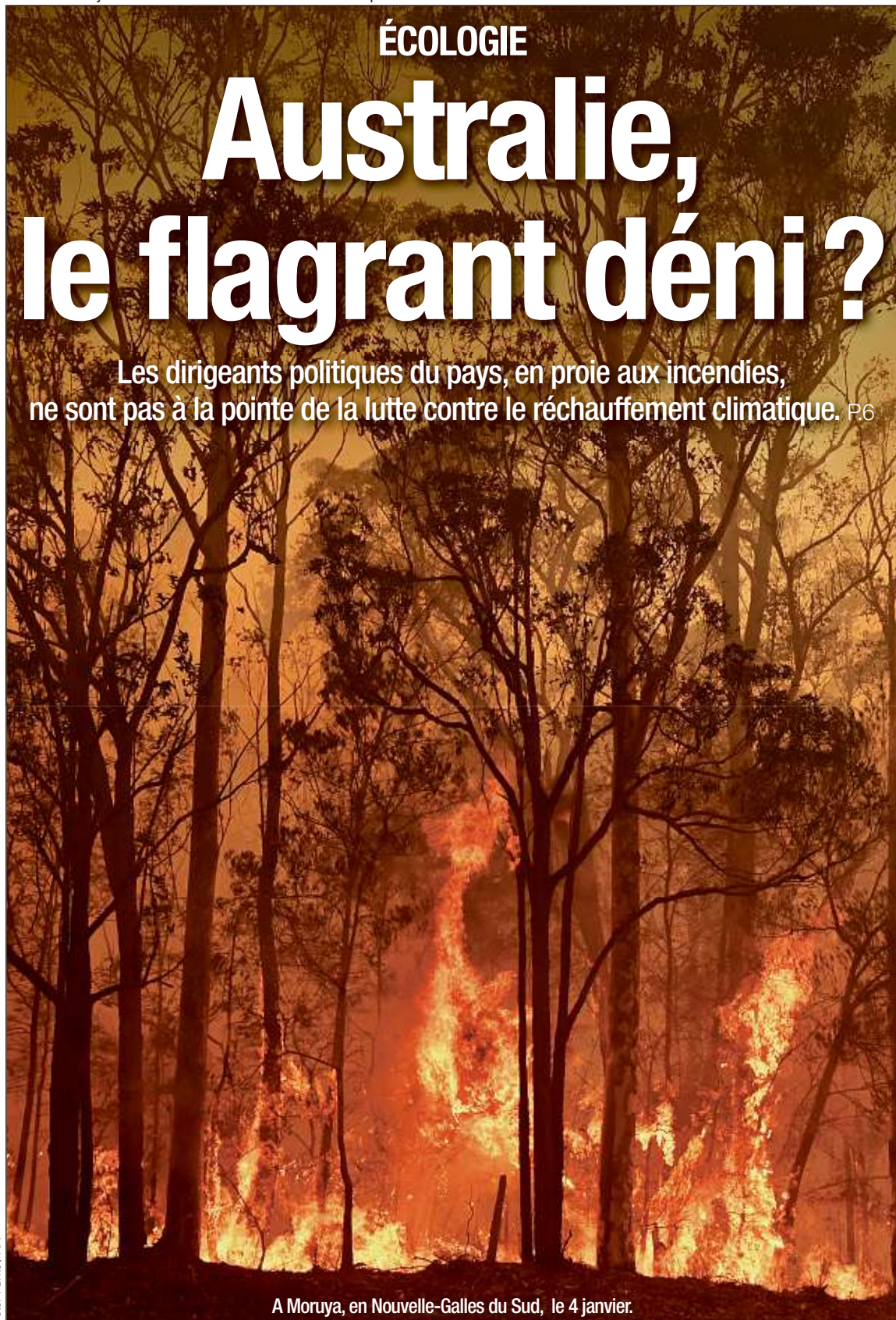
A Moruya, en Nouvelle-Galles du Sud, le 4 janvier.

Les dirigeants politiques du pays, en proie aux incendies, ne sont pas à la pointe de la lutte contre le réchauffement climatique. P.6