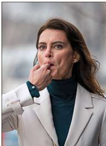
Catrinel Marlon en train de siffler.

Le prochain film de Tarantino aura un lien avec «Reservoir Dogs». Quentin Tarantino a trouvé le sujet de son prochain film et il sera en lien avec Reservoir Dogs . Le réalisateur l'a annoncé à Deadline en marge des Golden Globes dimanche.