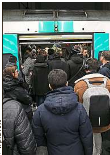
Malgré le stress, de nombreux usagers sont solidaires de la grève.