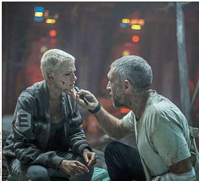
Les deux comédiens se font poursuivre par des créatures féroces.

Dans Underwater de William Eubank, un groupe de scientifiques fait le grand plongeon. Un tremblement de terre met leur base de forage en péril, et les voilà contraints d'essayer de survivre sous l'eau en tentant de remonter à la surface. Vincent Cassel incarne le capitaine d'une équipe dans laquelle on reconnaît Kristen Stewart et T.J. Miller. Ce petit film d'horreur fait ressentir de joyeux frissons en confrontant les héros à des créatures pas vraiment amicales. Une bonne occasion pour 20 Minutes de retrouver Vincent Cassel.