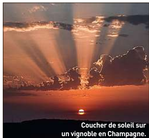
Coucher de soleil sur un vignoble en Champagne.

Vous êtes doué pour la photographie? Envoyez vos images à contribution@20minutes.fr ou postez-les sur Instagram avec le hashtag #nosinternautesontdualent