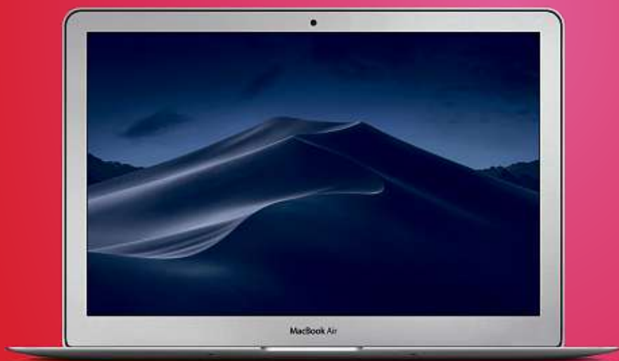
Apple MacBook Air

8 Go DE MÉMOIRE. JUSQU'À 12H D'AUTONOMIE. INTEL® CORE™ i5 – 128 Go SSD