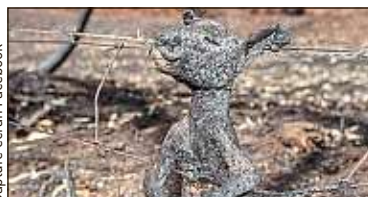
Capture écran Facebook