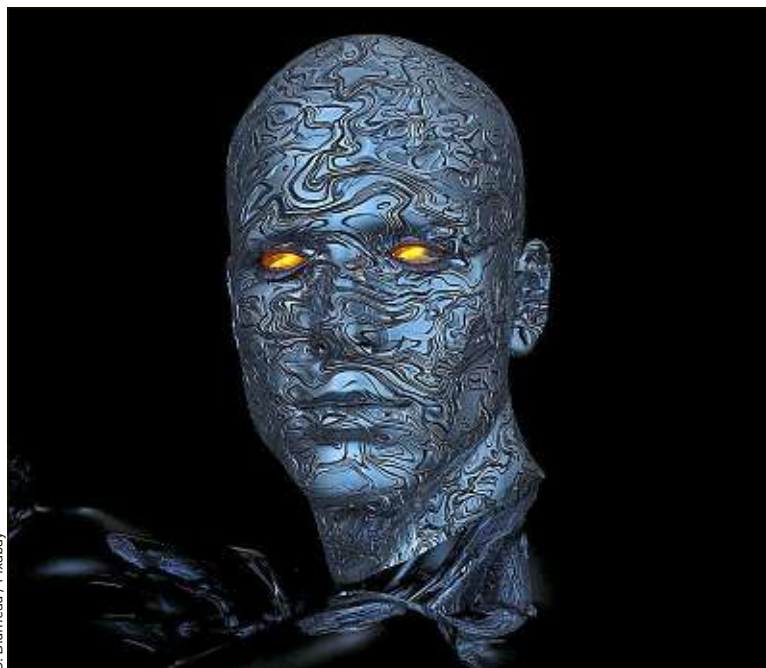
Des avatars humains seraient-ils capables de développer une personnalité ?

En tout cas, on ne pourra pas dire que Samsung ne maîtrise pas l'art du teasing. « Have you ever met an artificial ? » (avez-vous déjà rencontré un artificiel ?), a twitté fin décembre le compte Twitter Neon, en légende de plusieurs photos de visages humains. Neon est une technologie d'avatars réalistes qui peuvent « créer de manière autonome de nouvelles expressions, de nouveaux mouvements, de nouveaux dialogues (même en hindi), complètement différents des données initialement utilisées pour les