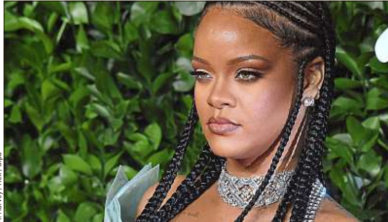
L'album de Rihanna est fin prêt, mais elle joue avec les nerfs de ses fans.

Très prise par sa marque de vêtements et de cosmétiques Fenty, la chanteuse n'a pas sorti d'album depuis 2016. Mais bonne nouvelle, R9, son nouveau cru, est fin prêt! Pourtant, comme elle l'a fait savoir sur Instagram, Rihanna n'a pas encore envie de le sortir... Va-t-elle