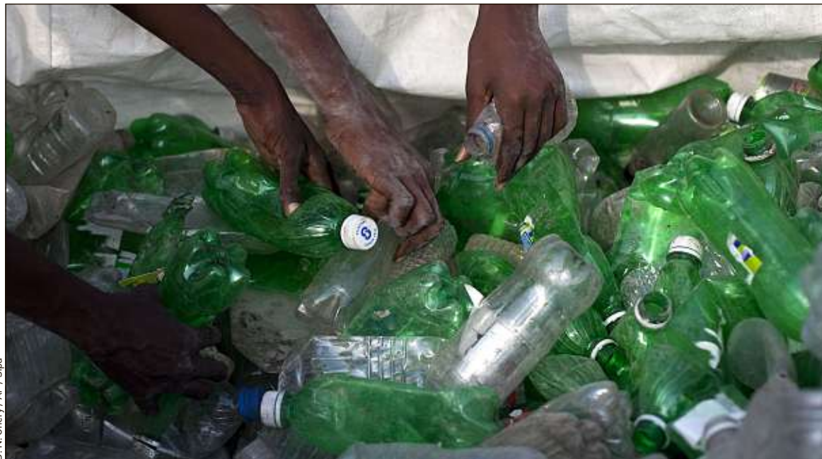
Les débris ramassés peuvent être échangés contre de l'argent, des crédits téléphones et des connexions wifi.

Implantée en Haïti, à Rio de Janeiro, aux Philippines et en Indonésie, Plastic Bank essaime dans ces pays des « centres de collection », petites boutiques où les populations locales peuvent rapporter les emballages plastique ramassés et les échanger contre de l'argent. De