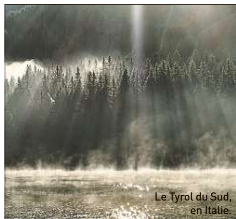
Le Tyrol du Sud, en Italie.