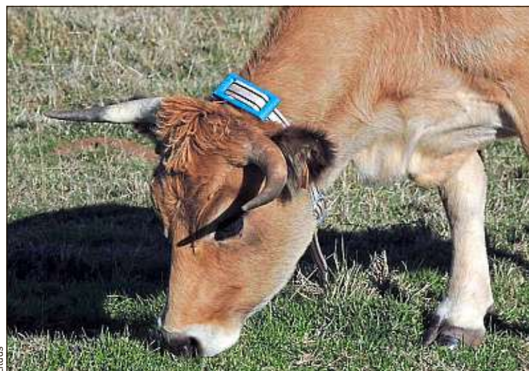
Le collier connecté permet aux éleveurs d'être alertés sur la santé des bovins.