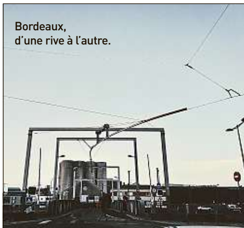
Bordeaux, d'une rive à l'autre.