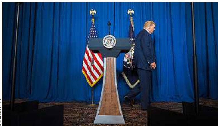
Donald Trump, ici vendredi en Floride, a menacé de frapper 52 sites iraniens.

On cite souvent l'arbitrage d'une puissance tierce comme solution