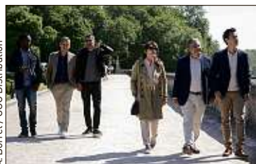
A. Borrel / UGC Distribution

Un maire mène la fronde contre les compteurs Linky P.4