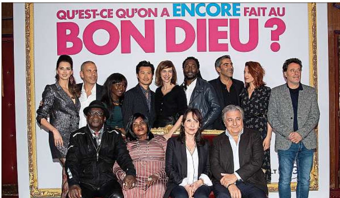
Les couples de Qu'est-ce qu'on a fait au bon Dieu? sont de retour. Un nouveau succès au box-office leur est promis.