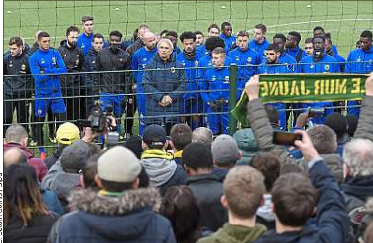
La semaine dernière, les supporters sont venus en nombre à la Jonelière.

Emiliano Sala, dont l'avion a disparu lundi 21 janvier au-dessus de la Manche, sera dans tous les esprits ce mercredi soir (21 h) à la Beaujoire, lors de Nantes-Saint-Etienne. L'affiche vintage sera le premier match des Canaris depuis la disparition de l'Argentin. « Il faut qu'on soit beaucoup plus forts que l'émotion. [...] Il ne faut pas qu'on explose, pas qu'on craque... », espère l'entraîneur Vahid Halilhodzic. A la Jonelière, un psychologue a proposé ses services pour soutenir joueurs et salariés. « Tout le staff est attentif. On fait passer beaucoup de sagesse, beaucoup de paroles positives », selon Halilhodzic, proche d'Emiliano Sala et très marqué par sa disparition. Ce mercredi soir, différents hommages à Sala, organisés par le FCN, vont avoir lieu lors de la rencontre contre les Verts. « Tout