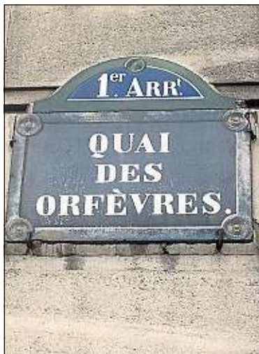
Le procès se poursuit ce mercredi.

Trois juges devront enquêter sur l'explosion rue de Trévis, à Paris. Le 12 janvier, rue de Trévis, à Paris (9 e arrondissement), une explosion faisait 4 morts et 66 blessés. L'enquête sur son origine, qui pourrait être une fuite de gaz, a été confiée à trois juges d'instruction, mardi. Les victimes et leurs proches pourront désormais se porter partie civile.