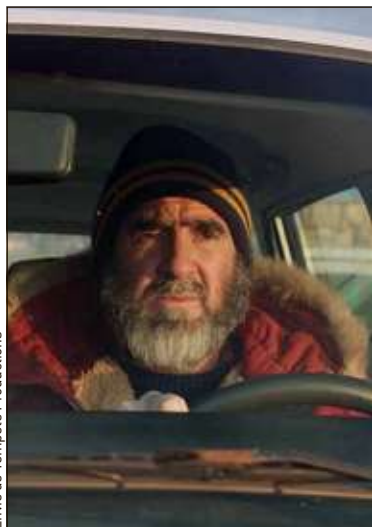
Eric Cantona joue un artiste bourru dans «Ulysse & Mona».

Plus de vingt ans de carrière Ulysse & Mona baigne dans ces bonnes ondes. Dans cette comédie tendre, l'ancien footballeur distille ses qualités