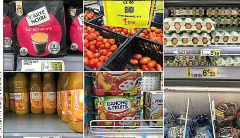
La situation est d'autant plus tendue que 23% de la population est au chômage.

Venue en urgence à La Réunion pour trois jours (du 28 novembre au 1 er décembre), au plus fort de la crise des «gilets jaunes», la ministre des Outremer, Annick Girardin, avait notamment annoncé une baisse de 10 % du coût du BQP – il s'établissait à 290 € en 2018, rappelle Zinfos974. Un rabais insuffisant pour lutter contre la vie chère, l'une des principales revendications des «gilets jaunes» réunionnais, selon les témoignages que 20 Minutes a pu