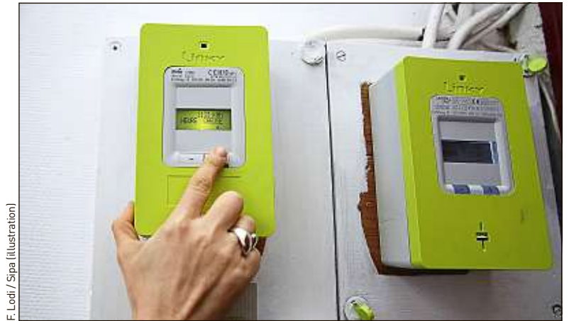
(Illustration)