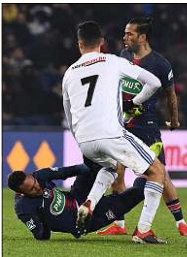
Neymar (au sol) est touché au pied.

Après le pétard, le huis clos pour le Vélodrome. Lundi, la Ligue de football professionnel (LFP) a prononcé un huis clos total à titre conservatoire au Stade-Vélodrome, après un jet de pétard qui avait entraîné une longue interruption du match Marseille-Lille (1-2). Ainsi, la réception de Bordeaux en L1, programmée le 5 février, devrait avoir lieu à huis clos.