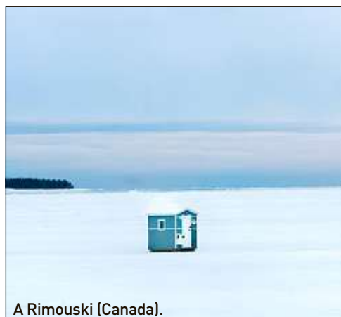
A Rimouski (Canada).