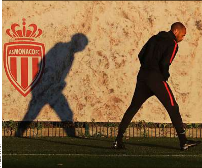
La forte personnalité de Thierry Henry menace ses ambitions.

Un costard d'entraîneur bien trop grand pour un immense footballeur. Trois mois après son arrivée sur le banc de Monaco et avant la demi-finale de Coupe de la Ligue à Guingamp (21 h 05), Thierry Henry a été prié, vendredi, de quitter ses fonctions, laissant la place à son prédécesseur, Leonardo Jardim. Avec un bilan de quatre victoires, cinq nuls et onze défaites, «Titi» a manqué son examen de passage en tant que coach. Un échec qu'il doit, en partie, à son passé d'ancienne idole.