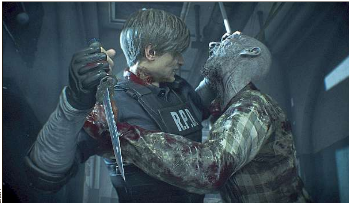
Les graphismes ont été remodelés, mais les zombies se révèlent toujours aussi résistants.

Les cadavres ambulants se révèlent incroyablement résistants. Comptez plusieurs balles en pleine tête pour vous en débarrasser. Un bon truc ? Visez les genoux : un zombie à terre est un zombie