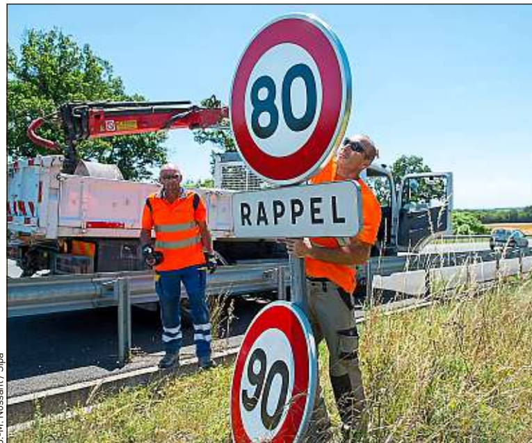
Le passage à 80 km/h sur les axes secondaires est entré en vigueur le 1 er juillet.