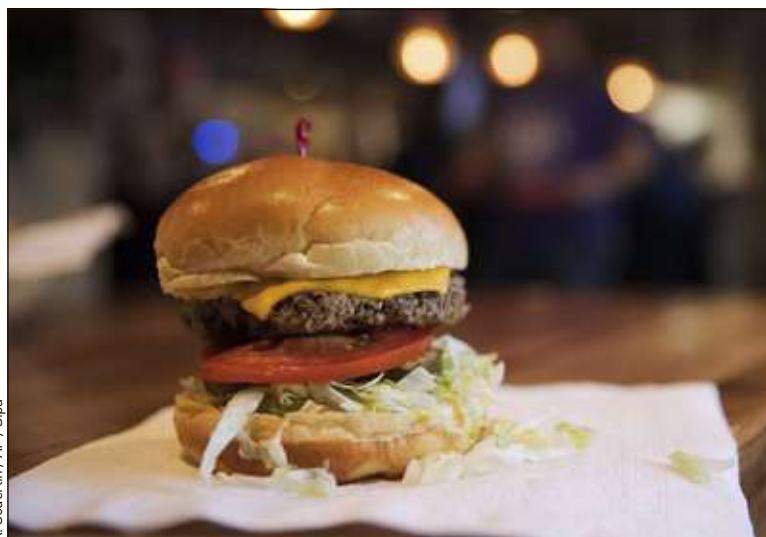
En Suède, le géant américain du fast-food vient de lancer le McFalafel.

comme une sauce au yaourt afin de ne pas imposer le véganisme aux enfants. Le McFalafel renforce l'offre végétarienne et végane de l'enseigne en Suède, où un McVegan existe déjà. En France, en dehors de certaines offres à durée limitée ou des salades, les clients McDonald's qui ne mangent ni viande ni produits d'origine animale sont, eux, confrontés à un choix plus restreint. Nul doute que, en fonction des demandes, McDo multipliera les McFalafel.