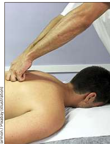
La profession veut être reconnue.