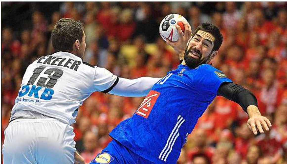
A la toute dernière seconde du match face à l'Allemagne, Nikola Karabatic a offert le bronze à l'équipe de France.

Handball Les Bleus ont fini les Mondiaux sur une bonne note, en battant l'Allemagne