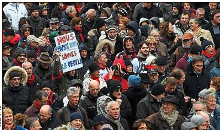
Les manifestants assuraient défendre les institutions, pas le chef de l'Etat.