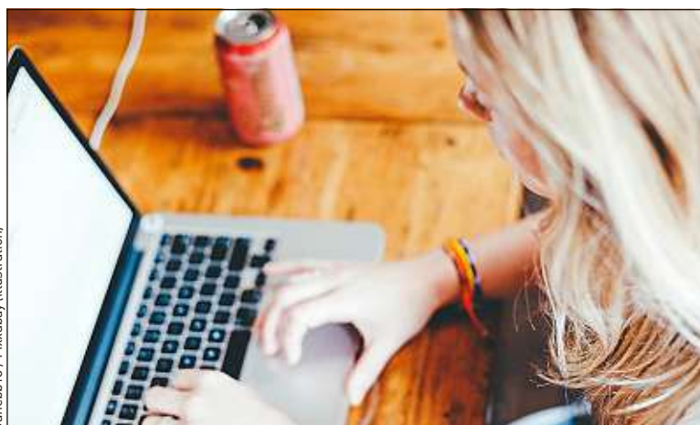
Le groupe a rallié à sa cause plus de 400 personnes en une semaine.