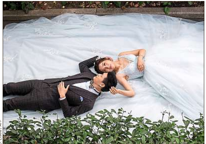
Seules les femmes célibataires de plus de 30 ans sont concernées.

le South China Morning Post . Au sein du parc, environ la moitié des salariés sont des femmes. « Certaines [...] ont moins de contact avec le monde extérieur », a expliqué le responsable des ressources humaines. D'où l'idée de leur accorder plus de vacances « pour leur donner davantage de temps et d'opportunités d'être en contact avec des personnes de sexe opposé ». Selon le DRH, les salariées sont plus productives quand elles ont une vie personnelle épanouissante.