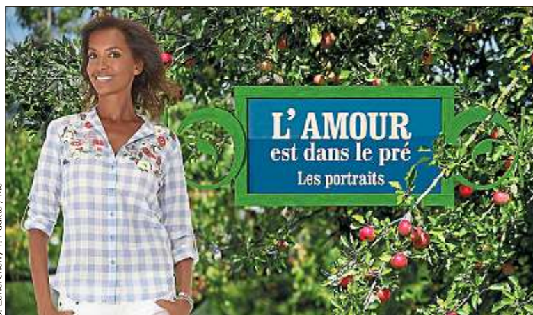
L'animatrice de M6 présente sa dixième saison du programme de rencontres.

Avec « L'amour est dans le pré », l'animatrice a trouvé son programme totem. L'arrêter signifierait un radical changement de carrière : « Je suis très fière de cette émission. Je présente peu d'émissions en fin de