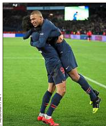
Cavani et Mbappé ont marqué.