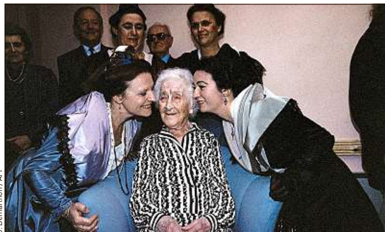
Jeanne Calment ne serait pas morte à 122 ans, selon deux chercheurs russes.

Premièrement, rien ne permet de valider aujourd'hui la thèse de l'escroquerie, il faut donc rester très prudent. Mais il faut savoir si Jeanne Calment reste le symbole de cette longévité extrême ou non. En tant que scientifique, à partir du moment où le doute a été semé, j'ai envie d'obtenir une réponse. Ensuite, dans l'hypothèse où la longévité de Jeanne Calment serait fautive, cela ne changera rien à nos objectifs. Tous les scientifiques, gérontologues ou biologistes spécialisés dans la longévité travaillent au maintien, le plus long possible, de la santé humaine. Et, sur cet aspect-là, nous n'avons pas de référence en