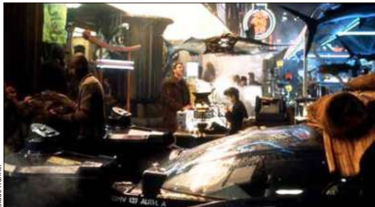
Dans « Blade Runner », l'intelligence artificielle prend le pouvoir en 2019.

L'une des versions les plus séduisantes est celle d'Isaac Asimov. Dans un article paru en 1983 dans The Star , l'auteur de la saga « Fondation » annonçait, pour 2019, une profonde mutation