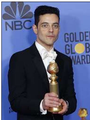
Rami Malek a reçu le prix du meilleur acteur dans un film dramatique.