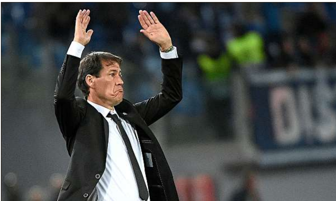
Un licenciement de Rudi Garcia, qui n'est pas à l'ordre du jour, coûterait une dizaine de millions d'euros à l'OM.