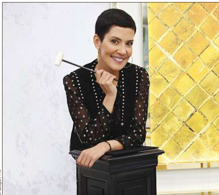
Cristina Cordula, absente du plateau, donne son avis dans des vidéos.

► Le déroulement. Comme dans « Affaire conclue », « Les Reines des enchères » commencent par la présentation de la vendeuse, de l'objet en vente et du prix d'achat de ce dernier. Un expert analyse le pro-