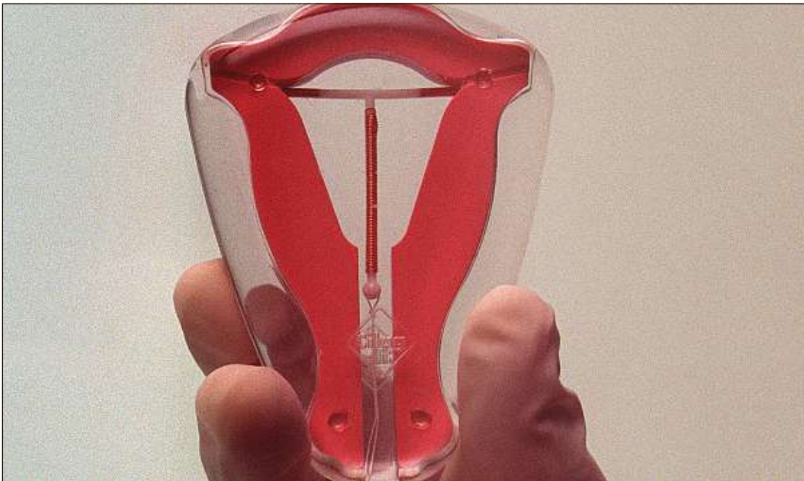
Les stérilets ont évolué, avec des modèles adaptés à l'anatomie des femmes n'ayant pas encore enfanté.