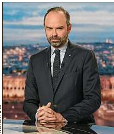
Edouard Philippe, lundi soir, sur TF1.

Le Premier ministre a annoncé une future loi durcissant les sanctions contre les casseurs et les manifestations non déclarées. Elle doit muscler l'arsenal répressif en créant notamment, sur le modèle de la lutte contre le hooliganisme, un dispositif interdisant