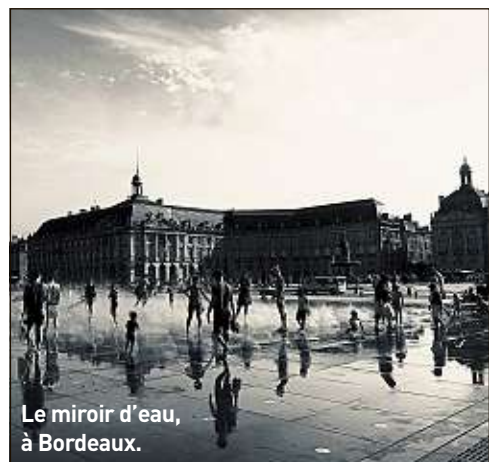
Le miroir d'eau, à Bordeaux.