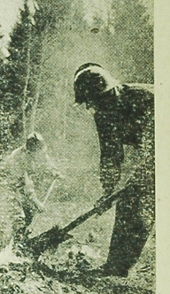
NA ZDJĘCIU: straż pożarna gasi ogień zaprószonej w lesie przez mroźnych turystów.

Przedtym GRN są także obowiązkowe do powoływania wsi przeciwpożarowych. W roku 1953 na Białostoccie powołano ich 2.509. W miejscach, które również przeszkonole. Zespoły kontrolne rozpoczęły działalność 1 maja.