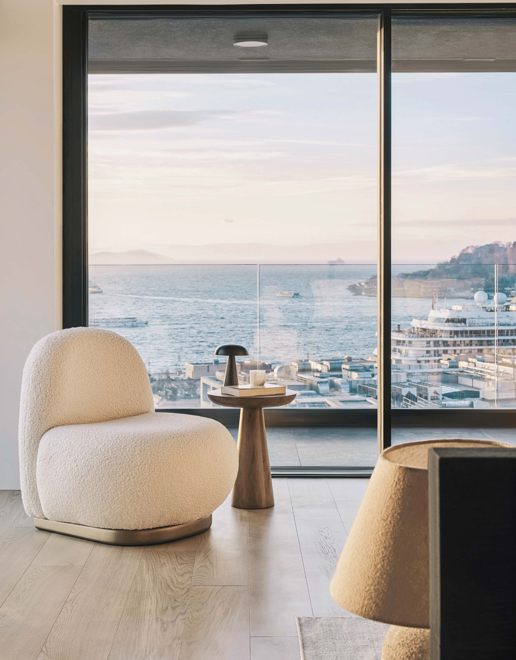
TEXT Mária Galajdová Interiérový dizajn: OZA Design