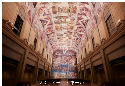
システイーナ・ホール

大塚グループ創立75周年記念事業として1998年3月に創業の地である徳島県鳴門市に設立した陶板名画美術館。世界26カ国の西洋美術を代表する名画1000余点を陶板で原寸大に再現し展示しています。約4kmに及ぶ鑑賞ルートには、古代遺跡や礼拝堂を現地の空間そのままに再現した立体展示のほか、レオナルド・ダ・ヴィンチ「モナ・リザ」をはじめ、ゴッホ「ヒマワリ」、ピカソ「ゲルニカ」など、美術書などで一度は見たことがある名画が一堂に会し、日本に居ながら世界の美術館を体験できます。