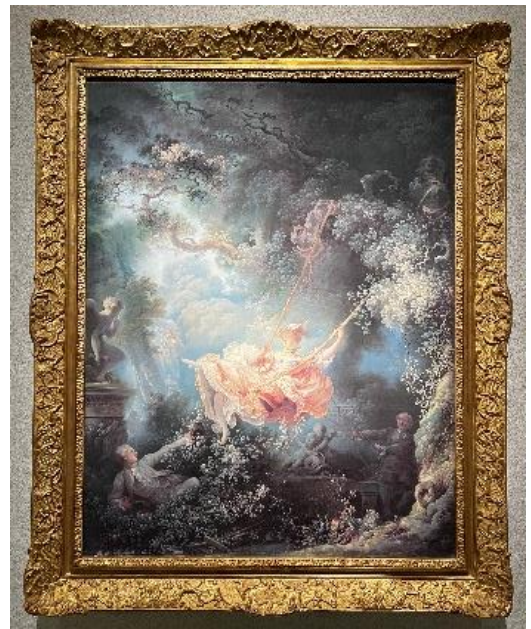
▲フラゴナール「ぶらんこ」