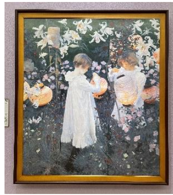
▲サージエント 「カーネーション・リリー・リリー・ローズ」 ユリの花のように真っ白な衣裳を着た少女がとても愛らしい。