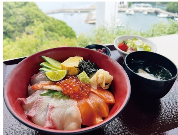
▲うずしお海鮮丼・・・ぱりぱりで弾力のある鳴門の鯛をはじめ、徳島ハマチなど、海の幸をふんだんに使用。