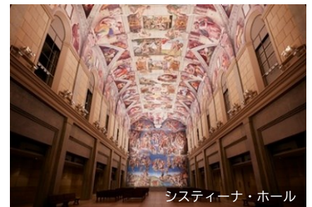
システイーナ・ホール

《お問い合わせ先》大塚国際美術館 広報担当 長谷川 富澤 TEL:088-687-3737 FAX:088-687-1117 MAIL:info@o-museum.or.jp