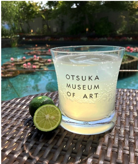
徳島産すだちスカツシユ 600円

生産量全国1位を誇る徳島の特産“すだち”。 すがすがしい香りと爽やかな酸味は、暑い夏にぴったり！