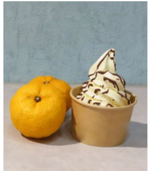
きとう 木頭ゆずソフトクリーム 450円

徳島県の南西部に位置する那賀町木頭地区を中心に栽培されている木頭ゆず。色や香りの良い高品質なゆずを使用した、自家製ソフトクリームです。