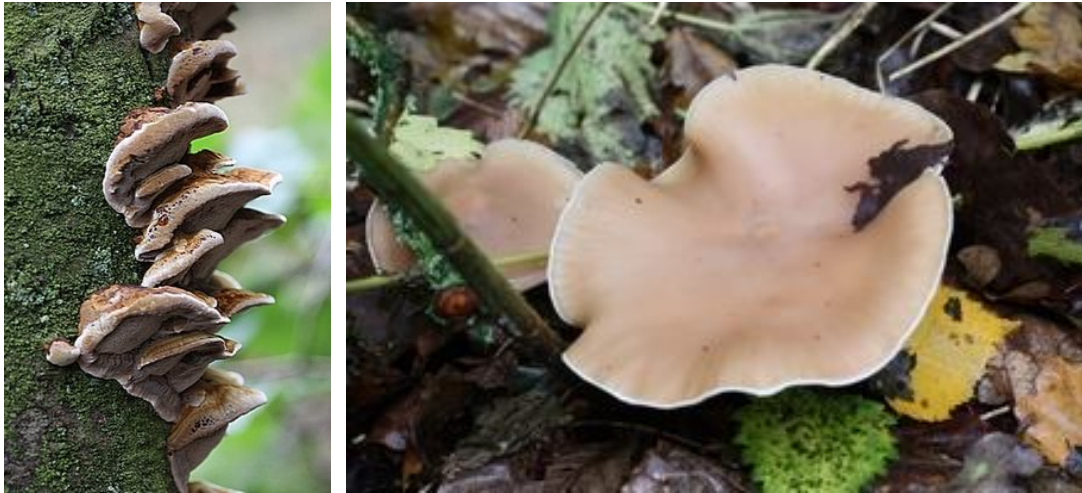
...werden er 57 soorten gevonden, w.o. Elzenweerschijnzwam en vaalpaarse ridderzwam ...