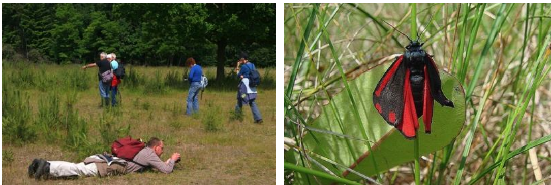
-----het was een gevarieerde excursie en St. Jakobsvlinder