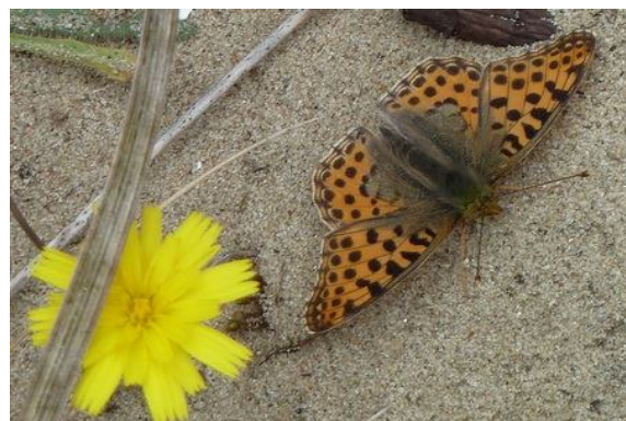
.....en een duinklassieker: de kleine parelmoervlinder