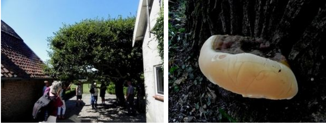
.....waar een indrukwekkende oude beuk te bewonderen was ..... en harslakzwam op eik