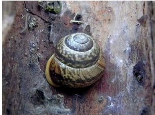
De tijdens de excursie gevonden heesterslak vind je zelden in heesters