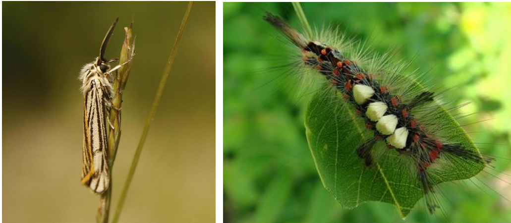
Ook zagen we een geel grasbeertje .....en rups witvlakvlinder

mensen zouden wachten. Zodra we er waren zijn we direct gaan lopen want we waren benieuwd wat we zouden gaan zien. Na een paar honderd meter zagen we de eerste bruine vuurvlinders en hooibeestjes vliegen. Die waren al binnen. Maar daar bleef het niet bij want op de eerste grote braamstruiken zaten bruine zandoogjes, bont zandoogje en grote dikkopjes. Daarna was het geroep niet van de lucht want die zag dit en de andere zag weer dat. Er vlogen veel St. Jacobsvlinders en ook zagen we de rupsen van deze mooie vlinder.