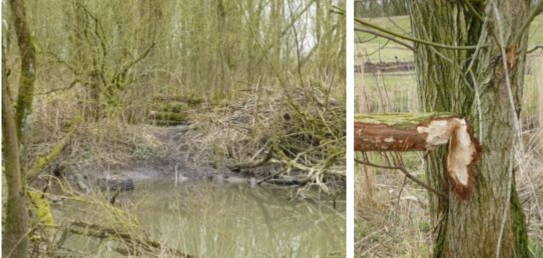
Langs het griendpad hadden bevers een enorme burcht (rechts) gebouwd

Een groepje dat vooruit liep had geluk met een roerdompwaarneming. Hierna werd langs een kreek gewandeld met in de buurt een aalscholverkolonie. Broedvlekken waren alweer duidelijk zichtbaar. Een vos had, aan de grote zandhoop te zien, een enorm hol in de dijk gegraven. Er werd voor de derde keer geluisterd naar de cetti's zanger, een vogelsoort die de laatste jaren steeds meer wordt gesignaleerd in ons land en wel in het bijzonder in de Biesbosch. Het bleef bij luisteren want de soort, die op een winterkoning in het groot lijkt, leidt een verborgen bestaan en is dus niet gemakkelijk te zien.