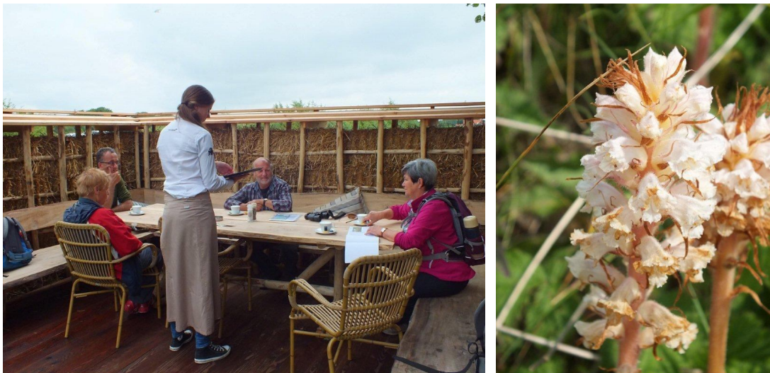
We zaten om 10.00 uur al aan de koffie en bitterkruidbremraap