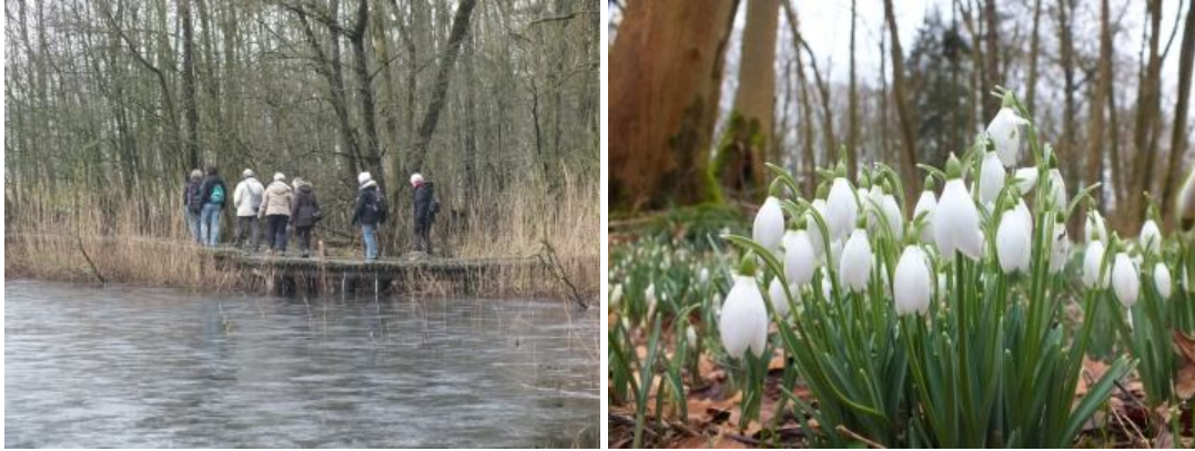
We kwamen voor de sneeuwklokjes