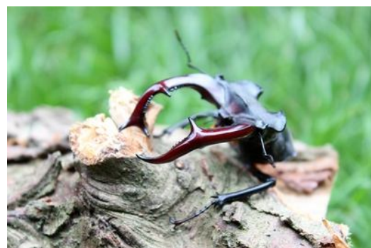
Bij enig nazoeken werd nog een enkel rugschild en een volledige kaak gevonden