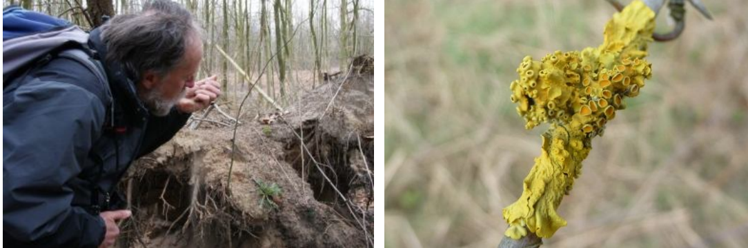
Even verderop laat hij zien hoe rivierzand verstuijft omdat.....en dooiermos