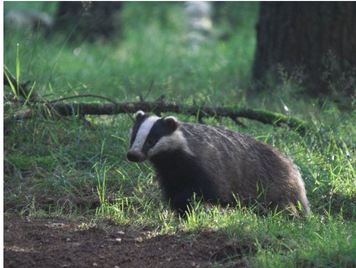
In de omgeving komt een dassenburcht voor