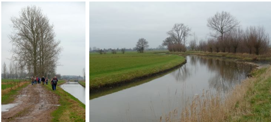
Een klompenpad dat gelukkig redelijk begaanbaar bleek.....

En zoals beloofd, ook van mijn hand nog een impressie met name over het laatste stuk. Dit laatste stuk bood niet echt een heel andere aanblik. Het klompenmakerspad rond Oene loopt voornamelijk door agrarisch cultuurland met mooie vergezichten. Hierin vielen de silhouetten van vrijstaande bomen zoals eik op. Het weer was somber en de temperatuur was, zoals de laatste weken steeds al, hoog zo rond de tien graden. Hierdoor stonden de paarse dovenetel en de hazelaar al volop in bloei. Op de website van het klompenmakerspad werd geklaagd over de slechte wegaanduiding. Door de perfecte voorbereiding van Ton en Carla liepen wij geen enkele keer verkeerd. Het was leuk om met de vele deelnemers bij te praten. De wandeling werd besloten in een leuk café midden in het dorp Oene. Het lag vlak bij de kerk en heet Dorpszicht. Er stond een biljart en de geweien aan de wand gaven blijk van de ligging tussen uiterwaarden en Veluwe. Met een kop koffie of een biertje werd een nieuw en veelbelovend KNNV jaar vol activiteiten ingeluid.