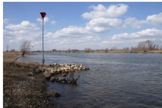
We lunchten bij een oude steenfabriek..... met uitzicht op de IJssel