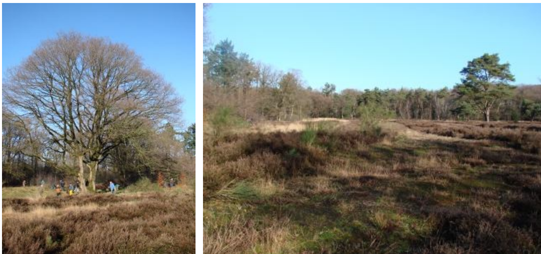
Met ongeveer 20 personen op landgoed Volenbeek en Norden