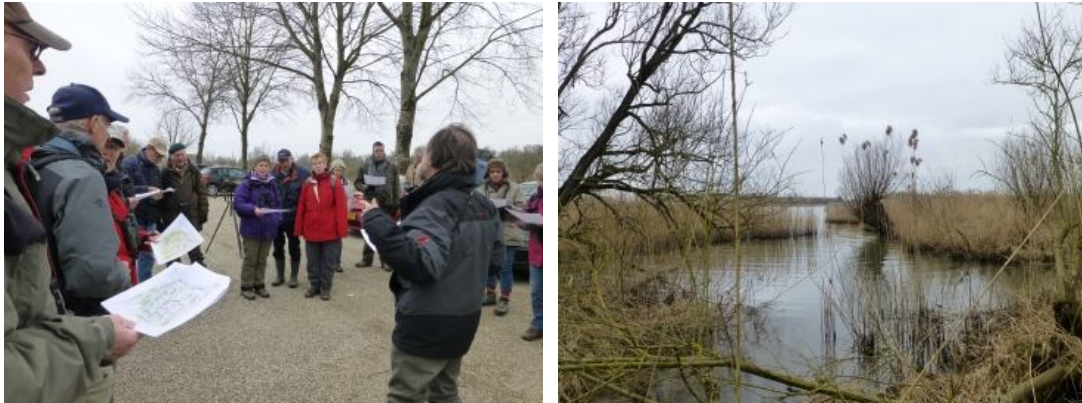
.....de programmatoelichting voor de dag..... en zicht op de Nieuwe Merwede (foto's: Ellen van der Meer)

rivierengebieden in Nederland vinden momenteel op grote schaal werkzaamheden plaats in het kader van "Ruimte voor de Rivier". Dat was ook hier goed te zien. De Noordwaard wordt momenteel ontpolderd zodat de weilanden in tijden van hoog water "doorstroombaar". Dijken worden gedeeltelijk afgegraven waardoor doorstroomopeningen worden gecreëerd. De aanzienlijke waterstanddaling van 30 centimeter die hierdoor wordt bereikt werkt door tot aan de Boven Merwede bij Gorinchem. Het water uit dit gebied wordt vervolgens via het Hollands Diep naar zee afgevoerd.