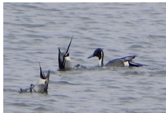
Grote groepen eenden waaronder pijlstaarten