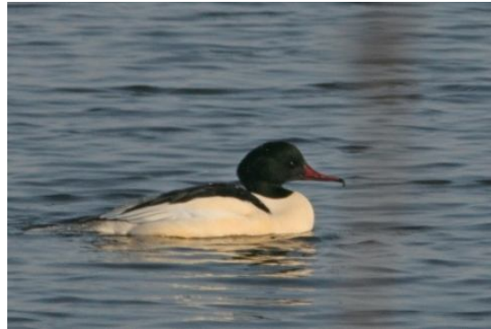
Op de Kop van 't End begon het wat te sneeuwen ..... en grote zaagbek