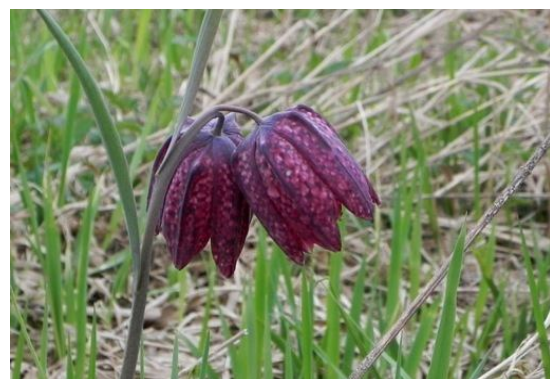
Het was behoorlijk fris.....en kievitsbloemen