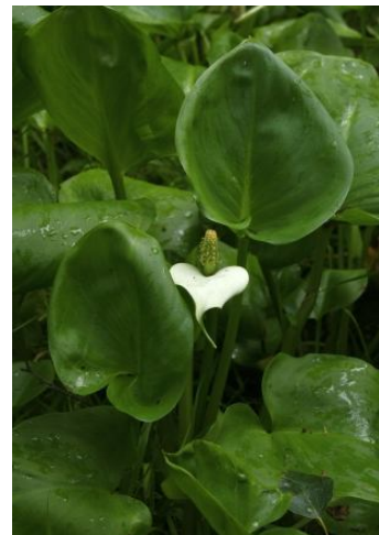
We lopen door een nat stukje hooiland..... en slangenwortel