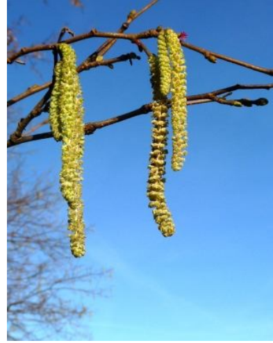
De koffiepauze hielden we in een immense schuur ..... en bloeiende hazelaar