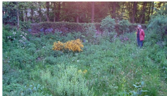
De vijvers en moerasjes zijn ook interessant.....