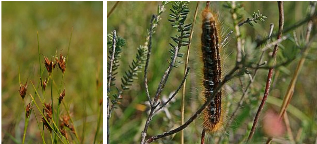
Een groot aantal bijzondere plantensoorten zoals bruine snavelbies..... en heideringelrups