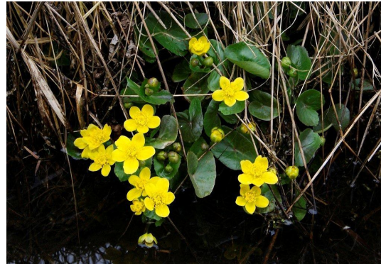
Uiteindelijk groeide de groep deelnemers.....en dotterbloem

Nico: ik was dus met de vogelaars op pad en kan niet anders zeggen dan dat er veel te horen en te zien was. In het bos schrokken we op door twee houtsnippen die er met veel geraas vandoor gingen, prachtige, forse vogels met dolken van snavels. We werden verrast door groepen kramsvogels en enorme hoeveelheden koperwieken die zich verzamelden voor de grote terugreis. We zagen op de Beekweg een overtrekkende blauwe kiekendief en hoorden de eerste fitis en zwartkop. Ook een boompieper liet zich horen bij het Kievitsweiland. Toen we het essenhakhoutbos 'de bloemkampen' uit kwamen, hoorden we de regenwulp en later ook de wulp. Op het pad naar de kust zagen we mooie roodborsttapuiten, graspiepers en een aantal boerenzwaluwen. Op zo'n moment weet je het, de Lente is niet meer te stuiten. In een prima stemming liepen we terug.