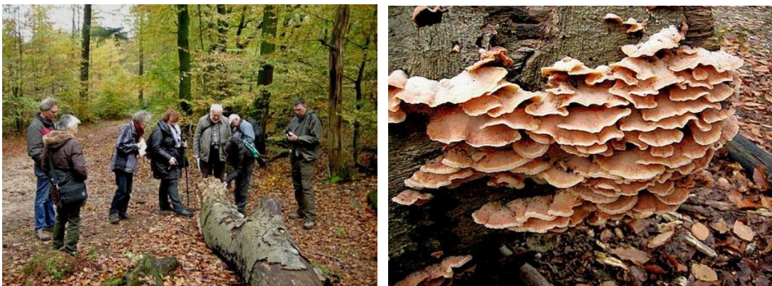
Verder een greep uit de circa 70 (!) soorten: spekzwoerdzwam,.....