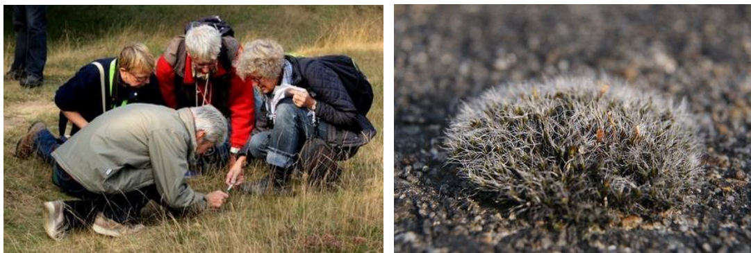
Toch heeft Arie ons enthousiast gemaakt.....en zilvermos