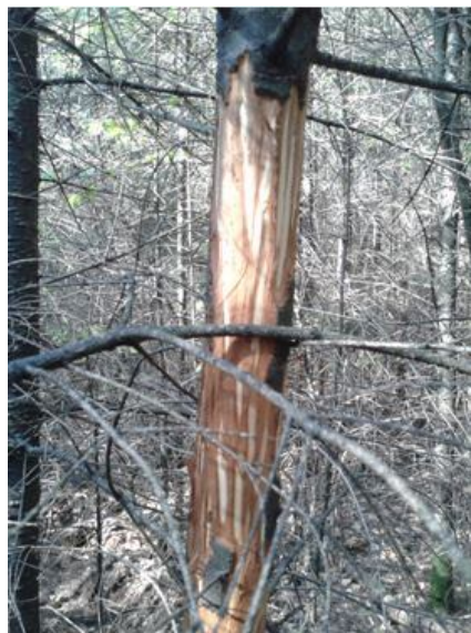
Reesporen