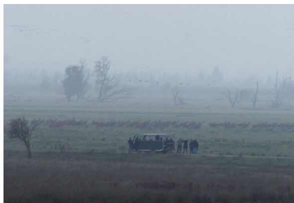
Van heel dichtbij werd met uitstappen wel heel letterlijk genomen!