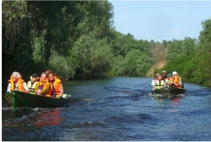
Wandelingen van 5 tot 10 kilometer en ....met bootjes diep het gebied in