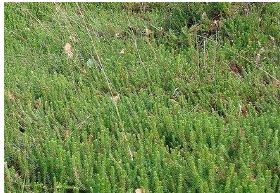
Het was knippen en zagen van de opslag en.....kraaiheide