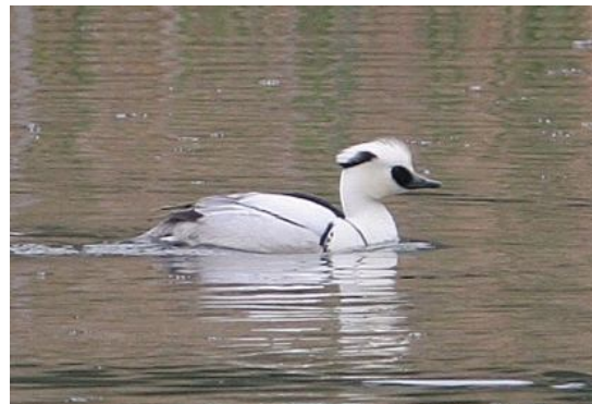
Op het water van het Deltagebied onder andere nonnetjes