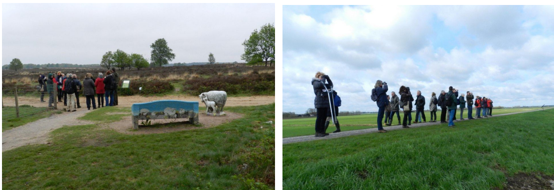
Geslaagde excursies na de theorieavonden vsn de vogelcursus