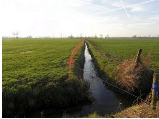
Tussen koeien door en beken met namen die herinneren aan buurtschappen