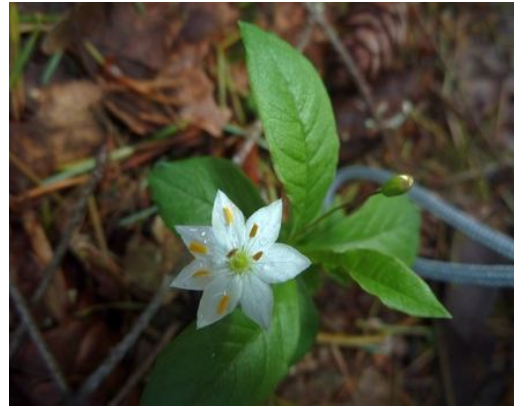
.....en direct al vonden we de zevensterren bloeiend.....