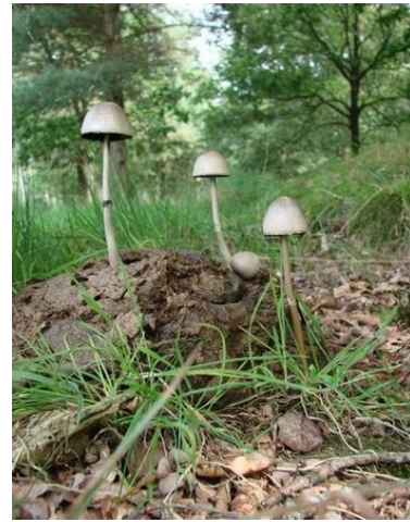
Waterlobelia en de bijzondere geringde vetplaat die groeit op koeienvlaaien