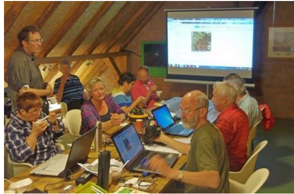
Er werd ijverig gespeurd naar....., op naam gebracht en digitaal verwerkt