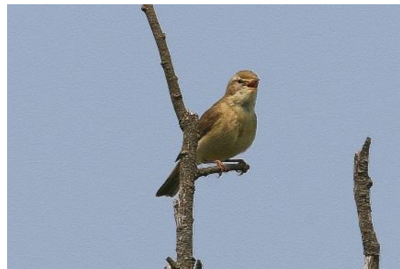
Zo zong de fitis al volop .....