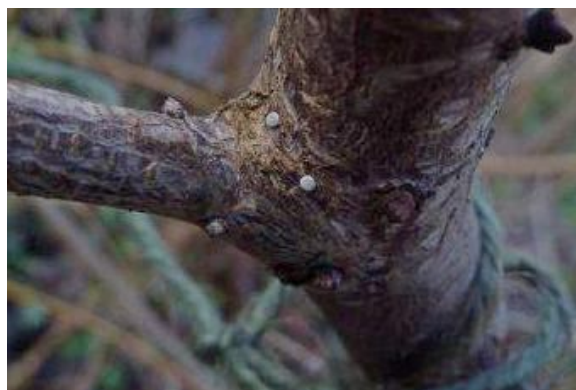
.....omdat ze zo klein zijn als een speldenknopje.....