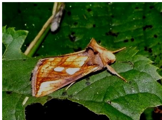
Zeker toen aan het einde van de avond nog het prachtige goudvenstertje werd ontdekt.....