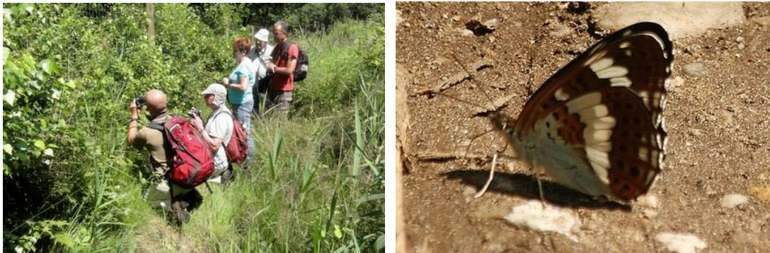
Kleine ijsvogelvlinder, wat een prachtige vlinder toch.....