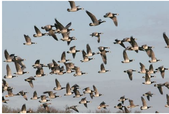
.....overvallen door een geweldige regenbui..... en daarna massa's brandganzen.....