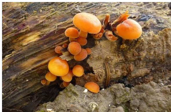
Uitzicht vanaf de heuvel en fluweelpootje