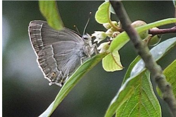
We vonden twee eikepagevlinders.....