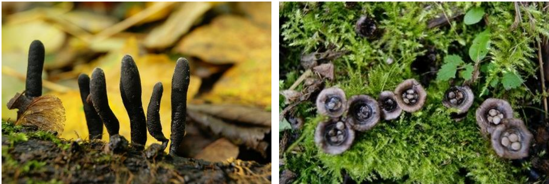
We vonden wel veel soorten paddenstoelen, waaronder houtknotszwammen en bleke nestzwammen