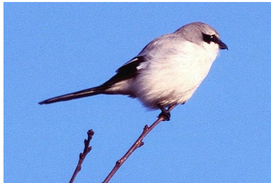
.....een mooie witte stip in de bomenrij op 200 meter

De struiken werden stuk voor stuk af gezocht maar geen klapekster. Klapeksters zijn heel slim, maar ondanks het soms eksterachtige geluid horen ze niet tot dezelfde familie als de ons bekende slimme ekster. Nico leerde de aanwezigen dat je bij de klapekster altijd achterom moet kijken. We hadden ons er eigenlijk al mee verzoend: geen klapekster vanmiddag tot..... zo'n tweehonderd meter verder achterom werd gekeken en jawel: een mooie witte stip in de bomenrij helemaal aan de zijkant van de open ruimte. Hoe één vogel ons allemaal om de tuin kan leiden want we waren natuurlijk al lang opgemerkt. Nico had de telescoop bij zich zodat we allemaal de klapekster in zijn fraaie verenkleed mooi konden bewonderen. Verder was het wat stilletjes in