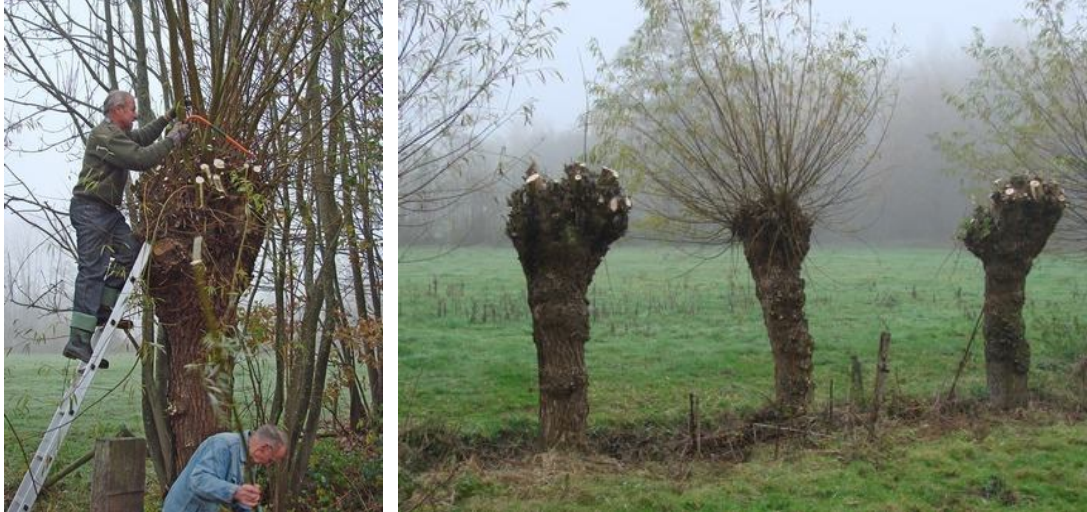
Wilgen knotten op de Arlermolensteeg

enorme klus die nu bijna klaar is. Ook is er een klompenpad aangelegd dat deels over het landgoed loopt en is de schaapskooi aan de Hoge Steeg opgeknapt. Deze dient nu als stopplaats voor wandelaars en fietsers. Je kunt er binnen uitrusten en drinken uit de automaat halen. Na de pauze hebben we de laatste wilgen geknot en kon iedereen weer terugkijken op mooie klus. Michiel de Vries