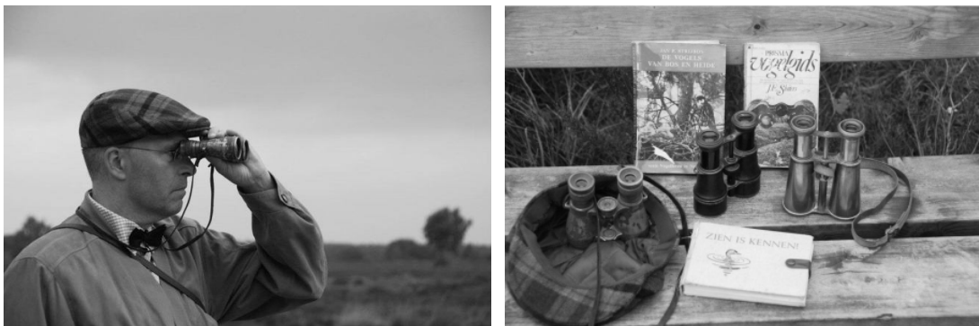
Met fotografische plaatjes in de sfeer van toen!