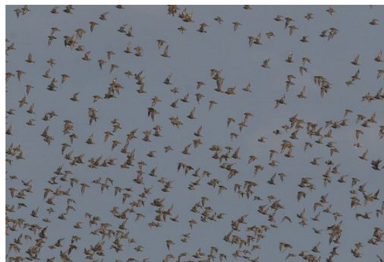
.....en ook zeer veel goudplevieren