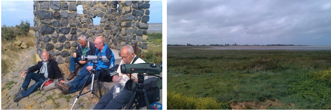
.....die geweldige uitzichten geeft over wadden en kwelders.