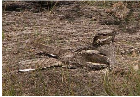
Ermelose heide (foto: Tjalling van der Meer) en nachtswaluw (bron: Wikipedia)