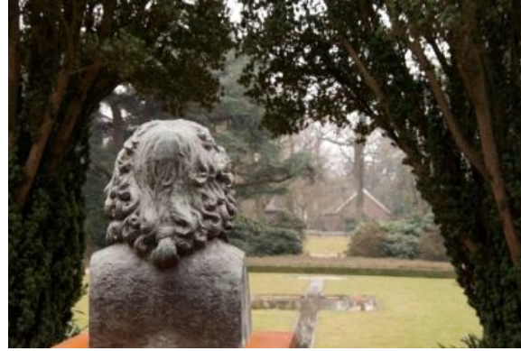
Linnaeus kijkt tevreden over de tuin