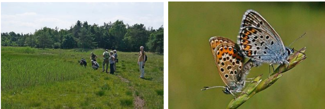
Verder zagen we het heideblauwtje

Op 5 juli hielden we met het maximaal toegestane aantal deelnemers voor het gebied een excursie naar de Leemputten bij Ermelo. Er moesten zelfs enkele leden teleurgesteld worden. Het was prachtig weer, dus het tempo was rustig. Alle tijd om te genieten van de vele mooie planten en insecten die we zagen. Gelukkig was Annemarie Kooistra erbij, zodat het meeste wat we zagen ook op naam gebracht kon worden. Een groot aantal bijzondere plantensoorten werd waargenomen, zoals onder andere geelhartje, dwergglas, wateraardbei, bruine snavelbies, beenbreek, heidekartelblad, stekelbrem en welriekende nachtorchis. Helaas vonden we geen draadgentiaan. Ook diverse zeggesoorten werden op naam gebracht, zoals onder andere zwarte zegge, dwergzegge, vlozegge en blonde zegge. Doordat er een flink aantal vlinder- en insectenliefhebbers in de groep was, is er ook goed naar vlinders, rupsen en andere insecten gekeken. Van de blauwtjes zagen we het heideblauwtje, het icarusblauwtje en het gentiaanblauwtje, hoewel de klokjesgentiaan nog niet bloeide.