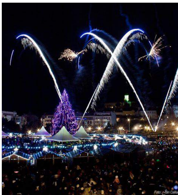
Ohňostroj nad Svätoplukovým námestím v Nitre.