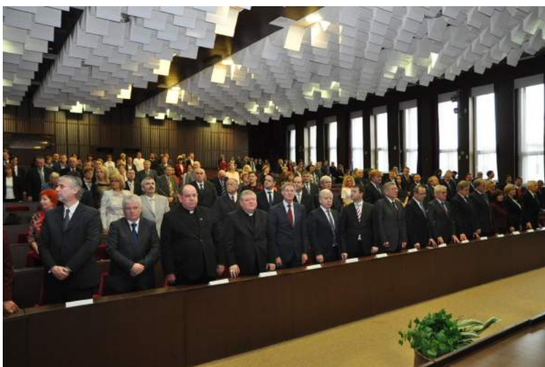
Pohľad na Veľkú zasadačku počas ustanovujúceho zastupiteľstva.