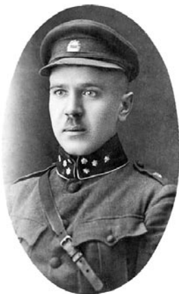
JAAN TÕNISSON, Johani p VR I/3, II/3

Onupoeg, riigivanem Jaan Tõnisson oli samuti Vabaduse Risti kavalier. (Vt elulugu VMA 2003: 154–155.)