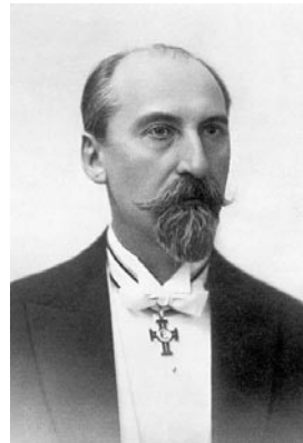
JAAN TÕNISSON, Jaani p VR III/1

Õppis 1878–1881 Viljandi valla Tusti koolis, 1881–1882 Viljandi kihelkonnakoolis, 1882–1883 Viljandi linna algkoolis, 1883–1886 Viljandi kreiskoolis/linnakoolis, 1888 Tallinna kroonugümnaasiumis, 1889–1892 Tartu ülikooli õigusteaduskonnas. Õigusteaduse kandidaat 1894, Tartu ülikooli õigusteaduse audoktor 1928.