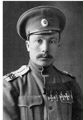
ANTON IRW VR I/2, II/2, II/3

VR I/2, nr 2686/07.04.1922 „Wabadusõjas langenud kangelase kapten Anton IRW'ete teeneid isamaa vastu hinnates, otsustas Wabariigi Walitsus 7. aprillil 1922 a. annetada temale I liigi II järgu Wabaduse Risti sõjaliste teenuste eest“.