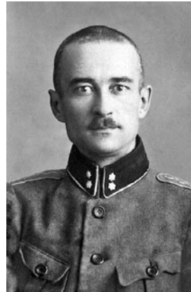
VILLEM MÄNNIK VR I/3

Sündis 30. (vkj 18.) märtsil 1886 Viljandimaa Viljandi kihelkonna Viljandi valla Vardja küla Laane-Suki talus. Vabadussõjas 6. detsembrist 1918 Varustuse Valitsuse toitlustusjaoskonna ülema abi ning alates aprillist 1919 intendantuuri osakonna ülema abi. Detsembrist 1919 Sõjaväe intendandi abi, alates jaanuarist 1920 Sõjaväe intendandi valitsuse majandusosakonna ülem.