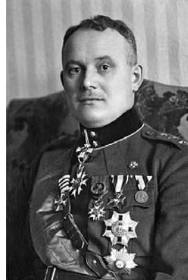
JOHAN LAIDONER VR I/1, III/1

Astus vabatahtlikult augustis 1901 sõjaväkke ja määrati Kovnosse 110. Kaama jalaväepolku, kus läbis õppekomando. Läkitati septembris 1902 sõjakooli, mille lõpetas aprillis 1905. Ülendati alamleitnandiks