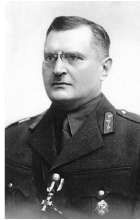
ALEKSANDER- VOLDEMAR PULK VR I/2

Määrati aprillis 1934 Pärnu-Viljandi kaitseringkonna ja ühtlasi Viljandi garnisoni ülemaks. Septembris 1936 viidi üle 1. diviisi ülema kohusetäitjaks, jaanuaris 1937 nimetati diviisiülema ülemaks. Ühtlasi oli