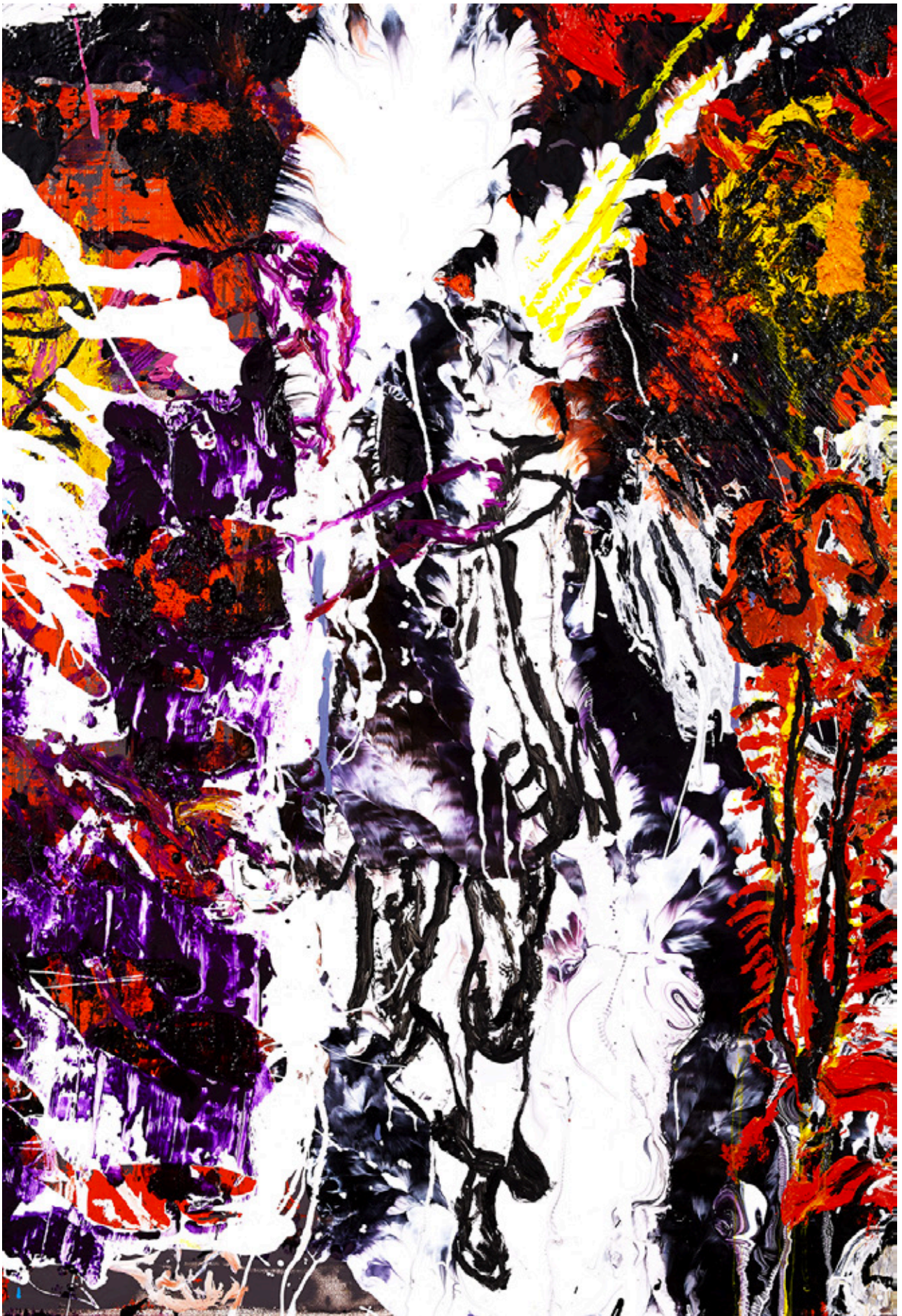
NACHSPRECHEN [Double-page précédente]