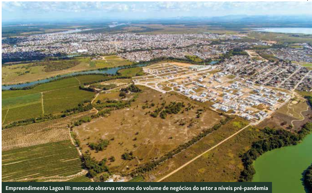
Empreendimento Lagoa III: mercado observa retorno do volume de negócios do setor a níveis pré-pandemia