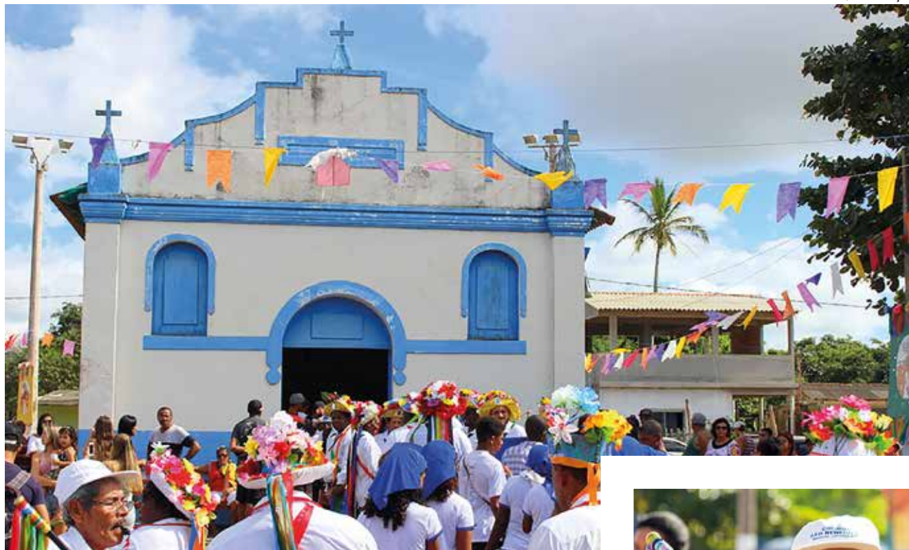
A Festa do Caboclo Bernardo é uma das mais tradicionais de Linhares