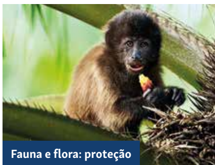
Fauna e flora: proteção