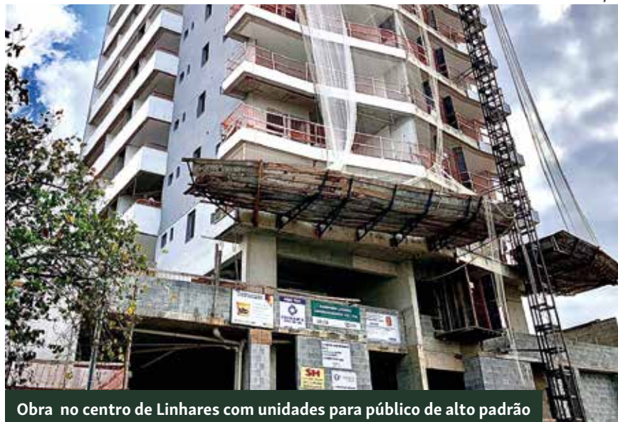
Obra no centro de Linhares com unidades para público de alto padrão

Para as imobiliárias, o momento é de retomada e o que se observa agora, na prática, é um retorno do volume de negócios do setor a níveis pré-pandemia.