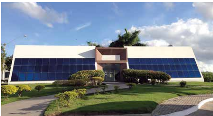
O Ifes oferece vagas em graduação e pós-graduação

contribuirá para o desenvolvimento social de todas as regiões do Estado.