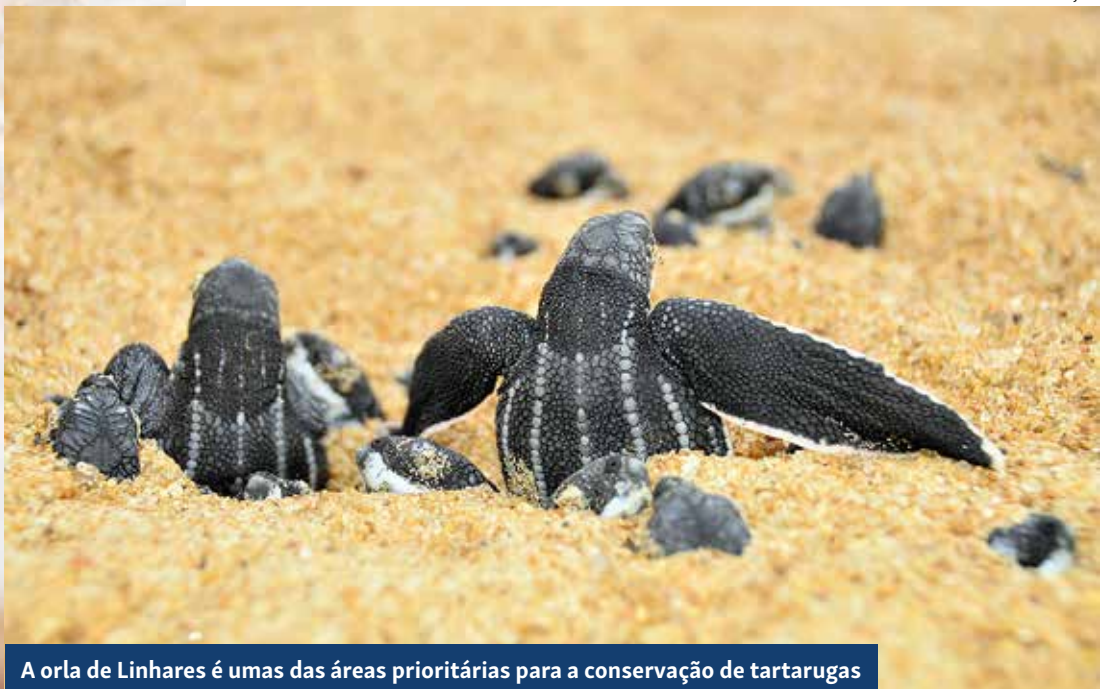
A orla de Linhares é umas das áreas prioritárias para a conservação de tartarugas