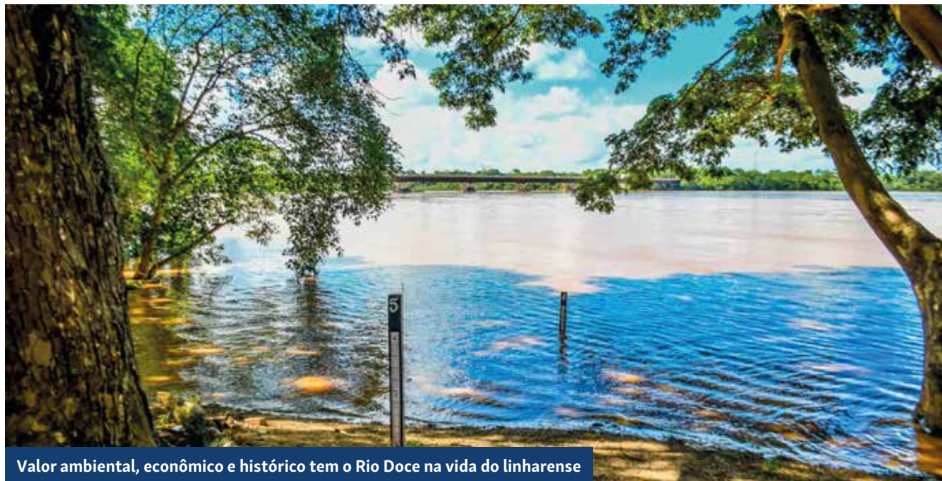
Valor ambiental, econômico e histórico tem o Rio Doce na vida do linharenses