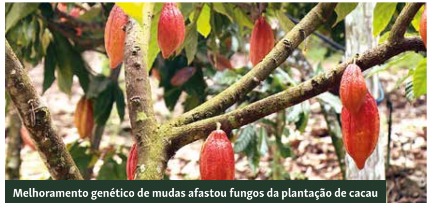
Melhoramento genético de mudas afastou fungos da plantação de cacau