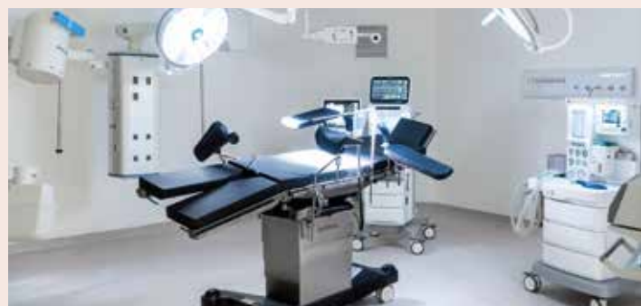
Leitos particulares foram disponibilizados para pacientes do SUS durante a crise sanitária