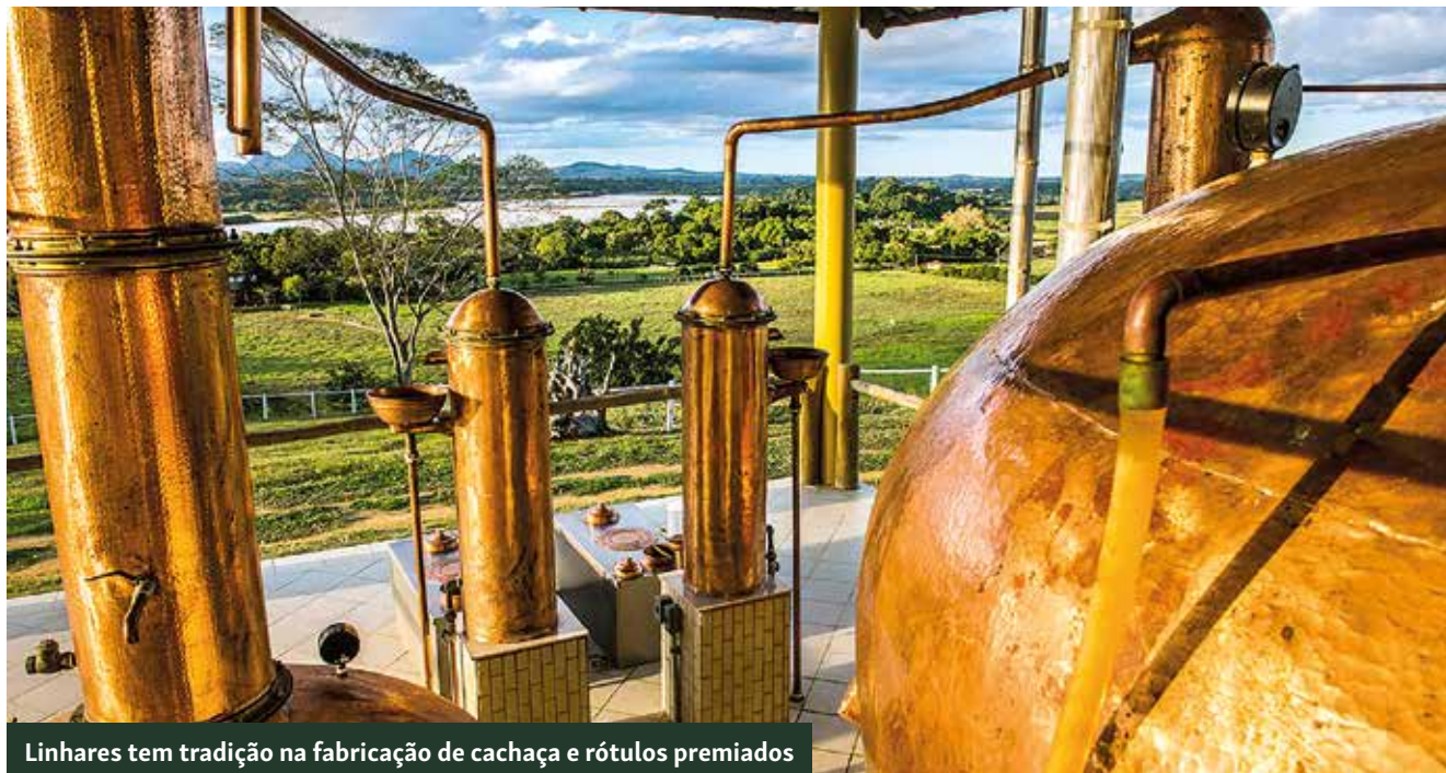
Linhares tem tradição na fabricação de cachaça e rótulos premiados