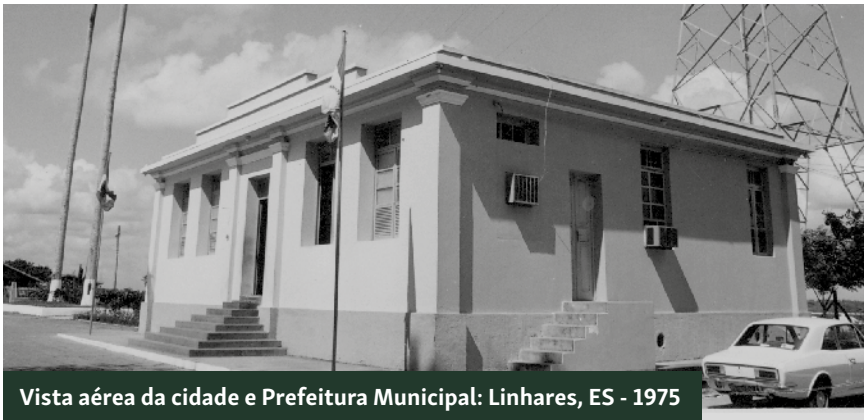
Vista aérea da cidade e Prefeitura Municipal: Linhares, ES - 1975