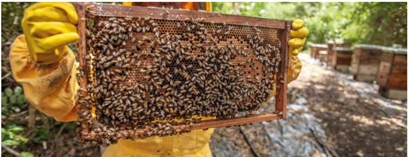
A produção de mel é uma das atividades de destaque em Linhares