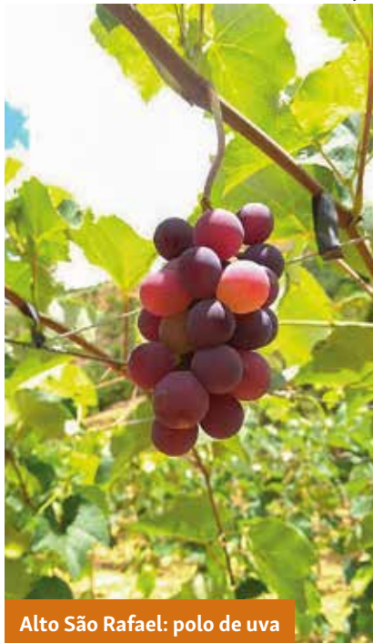
Alto São Rafael: polo de uva

interessados em ver os primeiros frutos e colherem as parreiras carregadas, mas têm planos de, no futuro, investir na produção de derivados da fruta, como licores, vinhos e geleias.