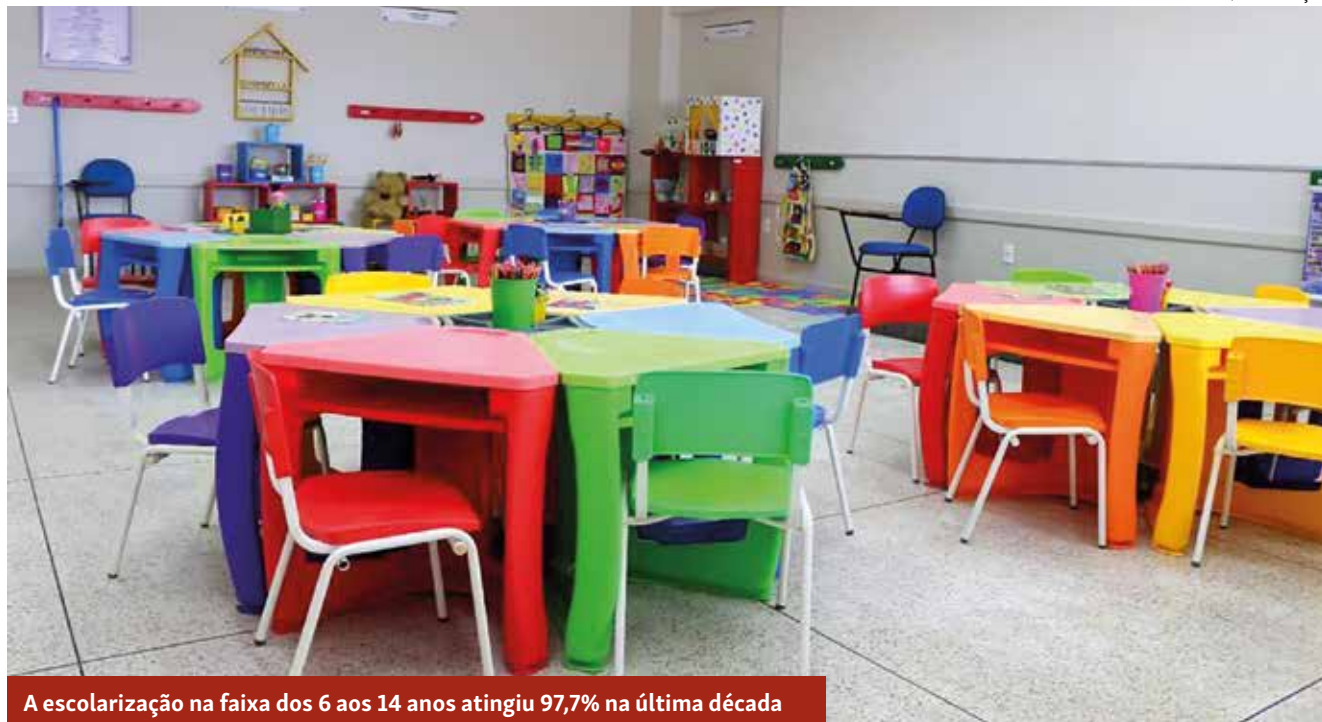
A escolarização na faixa dos 6 aos 14 anos atingiu 97,7% na última década