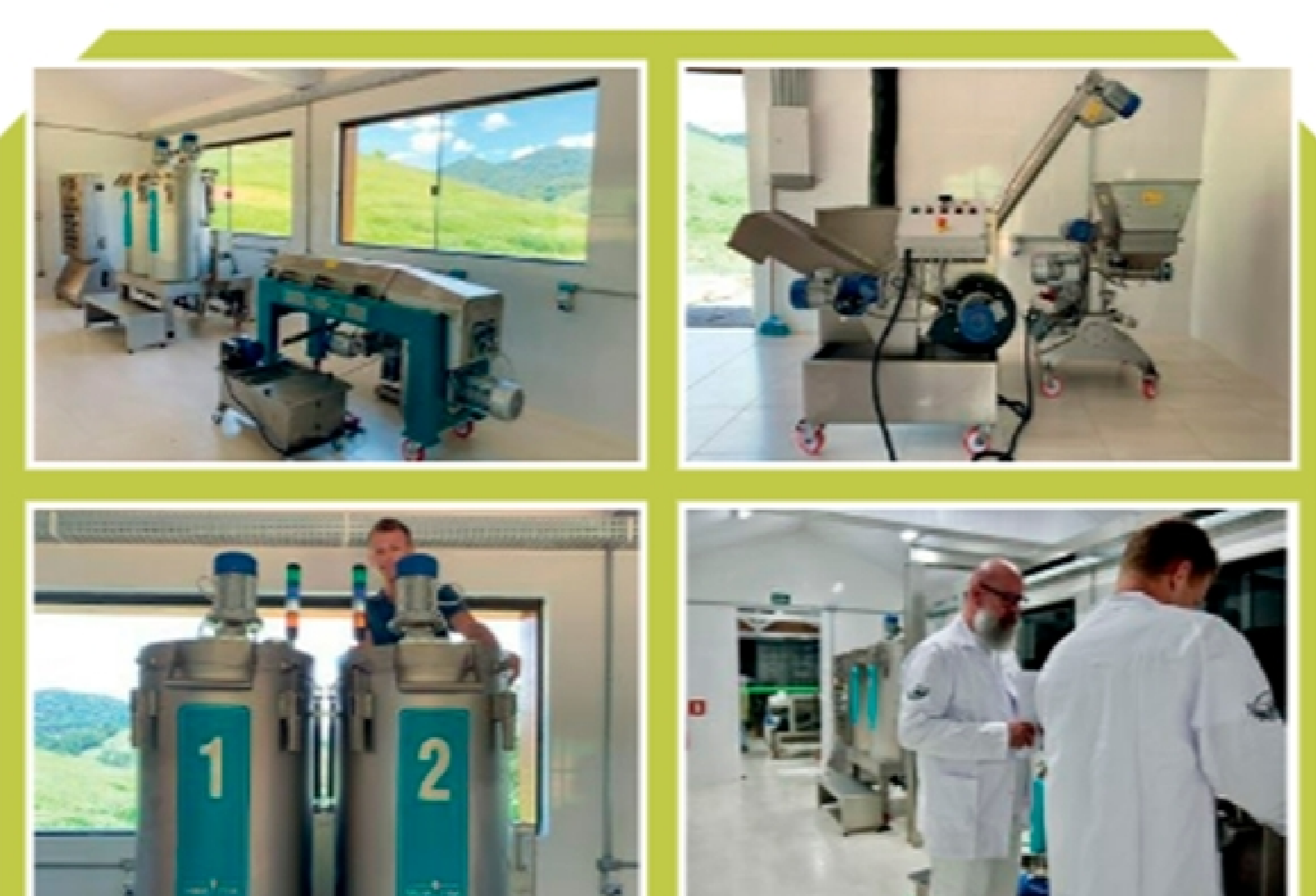
Instalaciones de la almazara de Azeite Sabiá en Santo Antônio do Pinhal, equipada con maquinaria y tecnología de la firma MORI-TEM.

del mundo, nacido en tierras brasileiras y premiado en todo el mundo".