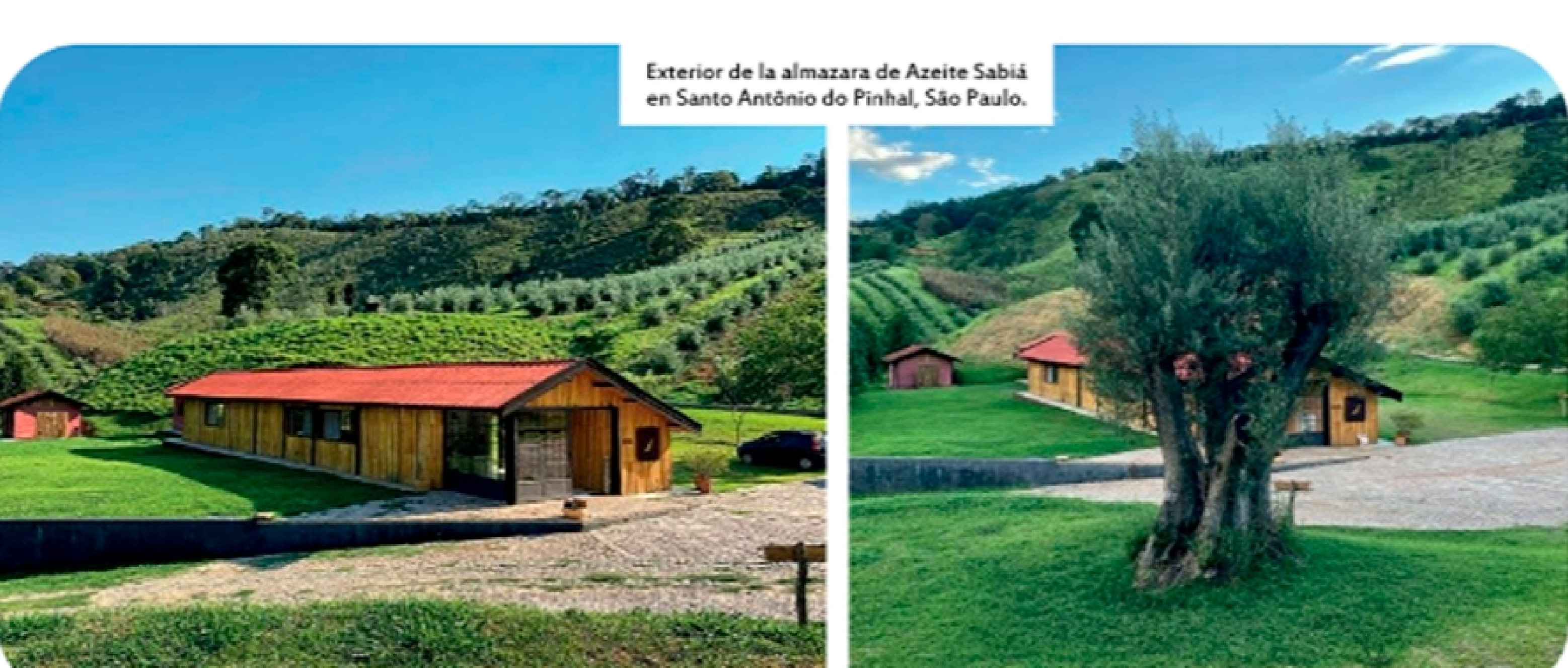
Exterior de la almazara de Azeite Sabiá en Santo Antônio do Pinhal, São Paulo.

Cabe destacar que, con 94 puntos, Azeite Sabiá Blend Especial forma parte del selecto TOP10 del concurso EVOOLEUM Awards 2022 -la primera vez que un aceite brasileño ostenta se-