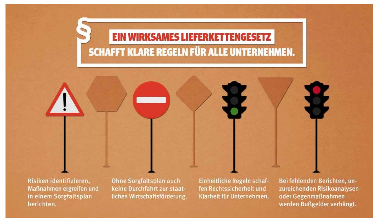
Abbildung 4: Ein wirksames Lieferkettengesetz schafft klare Regeln für alle Unternehmen.

heranziehen. Indes haben die Sorgfaltspflichten insoweit bisher noch weitgehend den Charakter von völkerrechtlich unverbindlichem soft law. Ein Lieferkettengesetz würde das aus Gesetzen und dem soft law bekannte Konzept der Sorgfaltspflicht in einen rechtsverbindlichen transnationalen Kontext übertragen, der auch die diejenigen Unternehmen bindet, die ihr freiwillig nicht nachkommen und somit bisher einen Wettbewerbsvorteil gegenüber fair agierenden Unternehmen genießen.