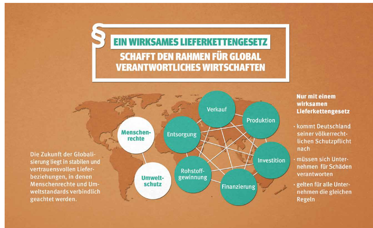
Abbildung 2: Ohne ein wirksames Lieferkettengesetz fehlt der Wertschöpfungskette der gesetzliche Rahmen.

Mit einem Lieferkettengesetz würde die Bundesregierung diesem Auftrag der Vereinten Nationen nachkommen und dazu beitragen, international gleiche Wettbewerbsfähigkeit sowie Rechtssicherheit für Unternehmen voranzubringen.