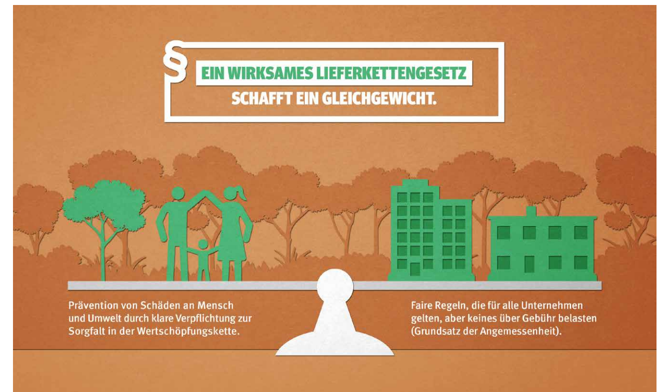
Abbildung 1: Ein wirksames Lieferkettengesetz schafft ein Gleichgewicht.

Die Anforderungen der Initiative Lieferkettengesetz umfassen keine Vorschläge für eine ebenfalls notwendige Änderung strafrechtlicher Vorschriften. Die Initiative verweist diesbezüglich auf den am 15.08.2019 vom Bundesministerium der Justiz und für Verbraucherschutz (BMJV) vorgelegten Referentenentwurf für ein „Gesetz zur Sanktionierung von verbandsbezogenen Straftaten“.