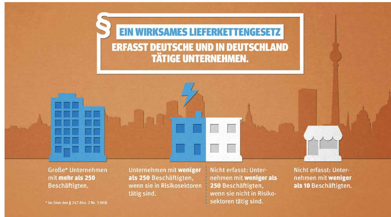
Abbildung 3: Ein wirksames Lieferkettengesetz erfasst deutsche und in Deutschland tätige Unternehmen.